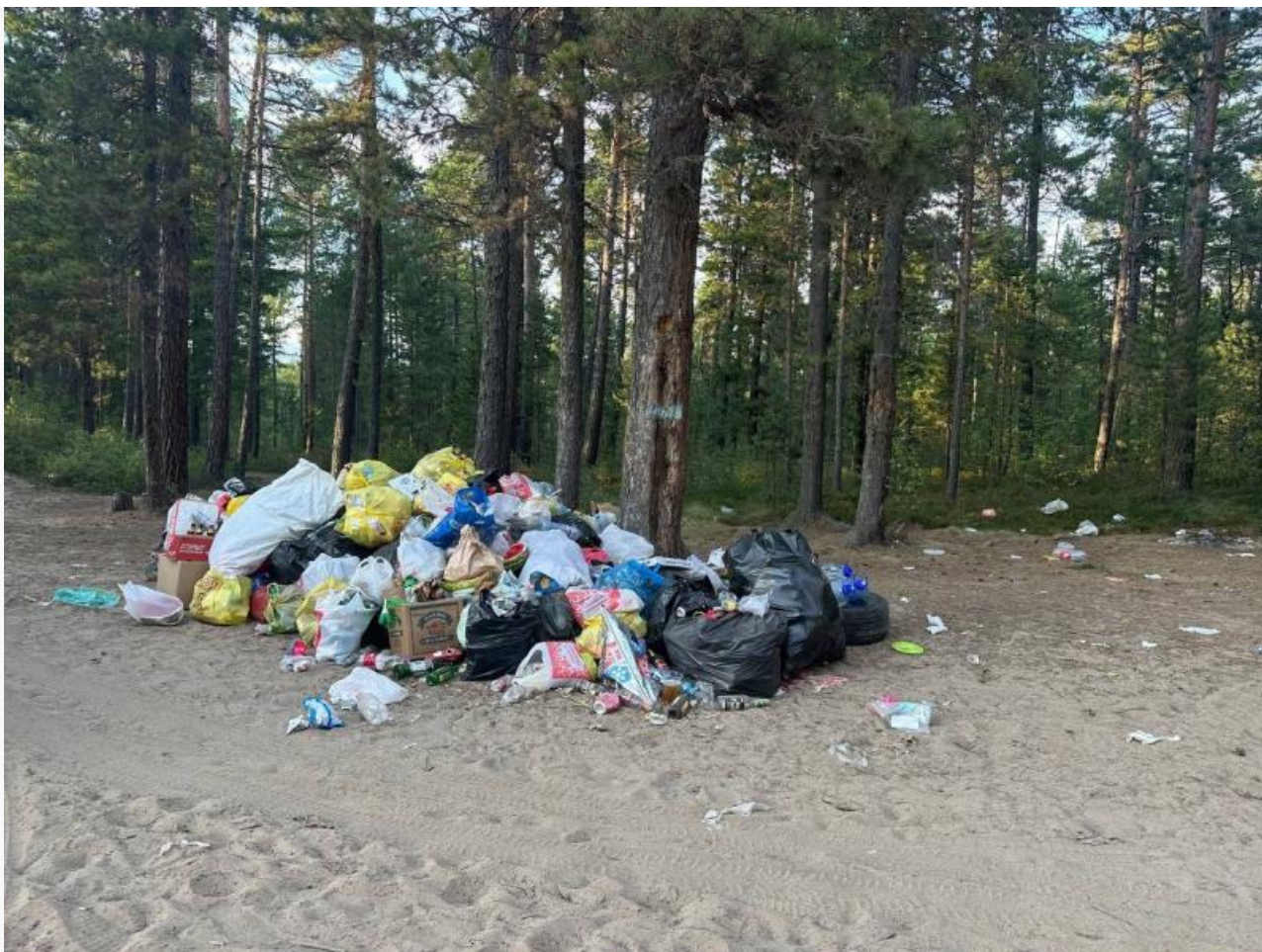
Село Горячинск – одно из самых популярных мест отдыха в Бурятии на берегу Байкала, лето 2024

В Бурятии вновь разрастается конфликт из-за неудовлетворительной работы «ЭкоАльянса», который превращает республику в сплошную антисанитарную достопримечательность страны. Побережье Байкала – не исключение. В связи с этим «мусорную» проблему в Бурятии в очередной раз хотят обсудить в стенах Хурала.