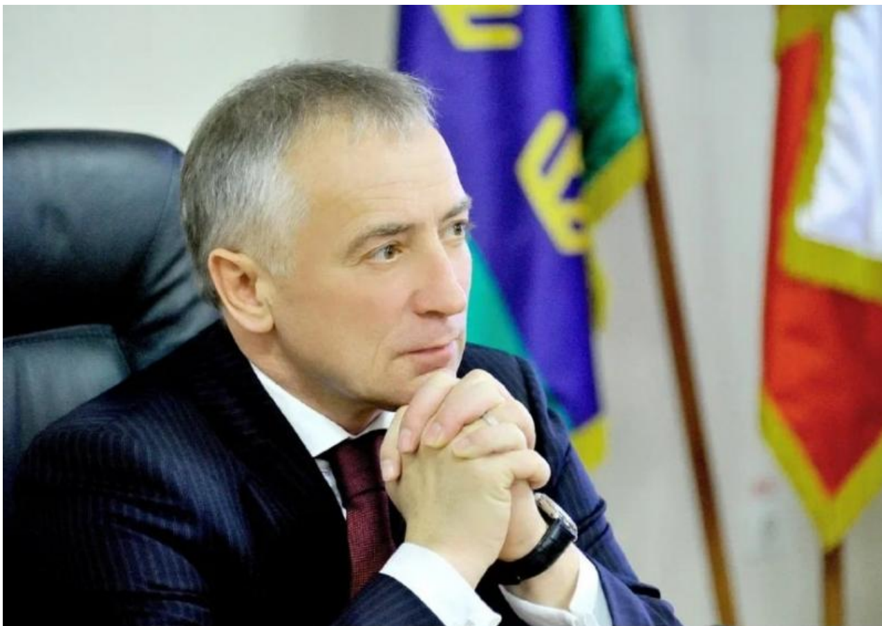
Фото: r4.mt.ru , avatars.dzeninfra.ru

Автор: Алексей Серебряный © Babr24.com ПОЛИТИКА, БЛАГОУСТРОЙСТВО, СКАНДАЛЫ, ТОМСК 05.09.2024, 18:01 604 32099