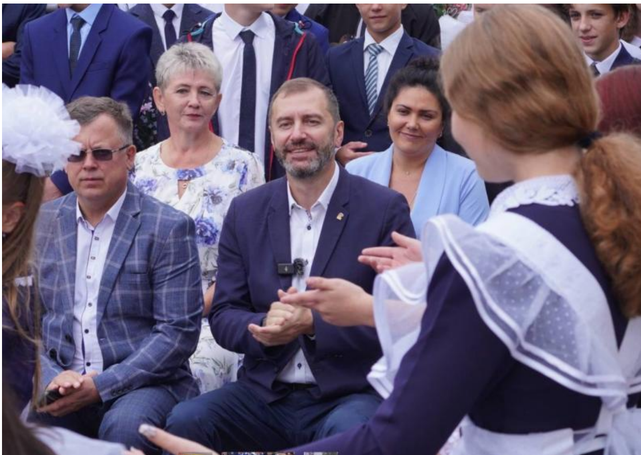
Фото: t.me/narodnieNETnovosti , t.me/Irkparlament , t.me/tabinaev1 , t.me/merbratsk

Автор: Георгий Булычев © Babr24.com ПОЛИТИКА, СКАНДАЛЫ, ОБЩЕСТВО, ИРКУТСК 03.09.2024, 17:35 145 16039