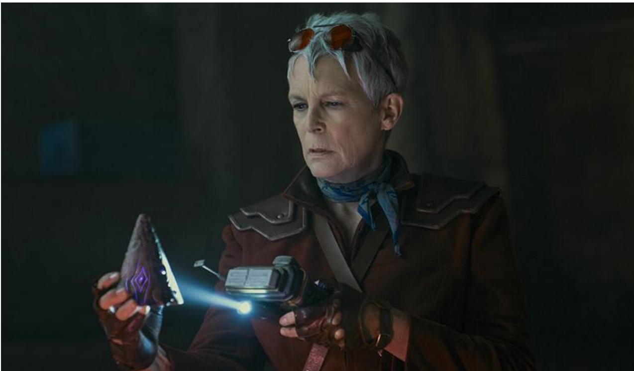
Джейми Ли Кёртис в фильме «Бордерлендс»

Общая касса топ-20 фильмов уикенда составила 247,1 миллиона рублей. Это на 29,91 % больше по сравнению с предыдущими выходными .