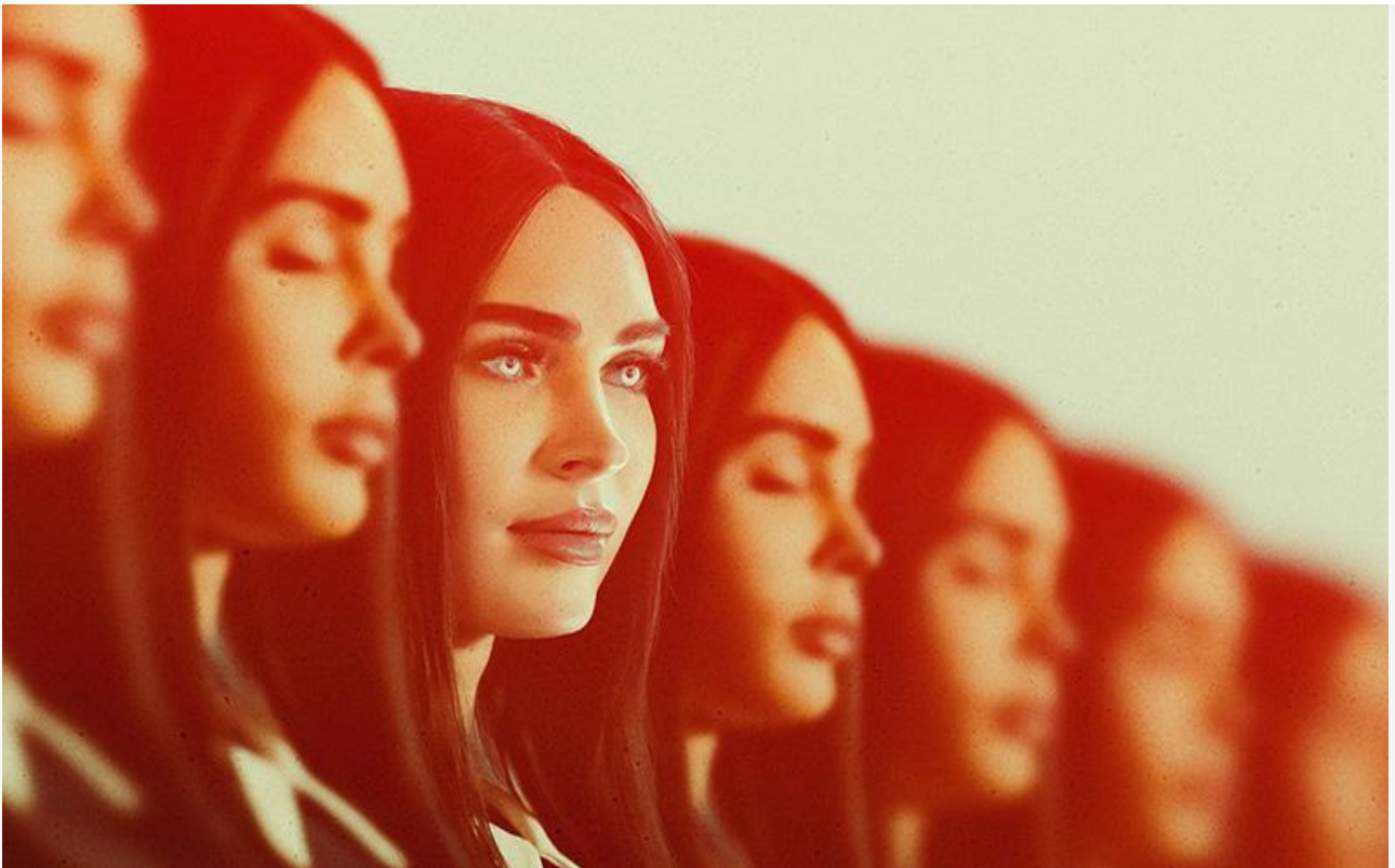
Постер к фильму «Меган: К вашим услугам»