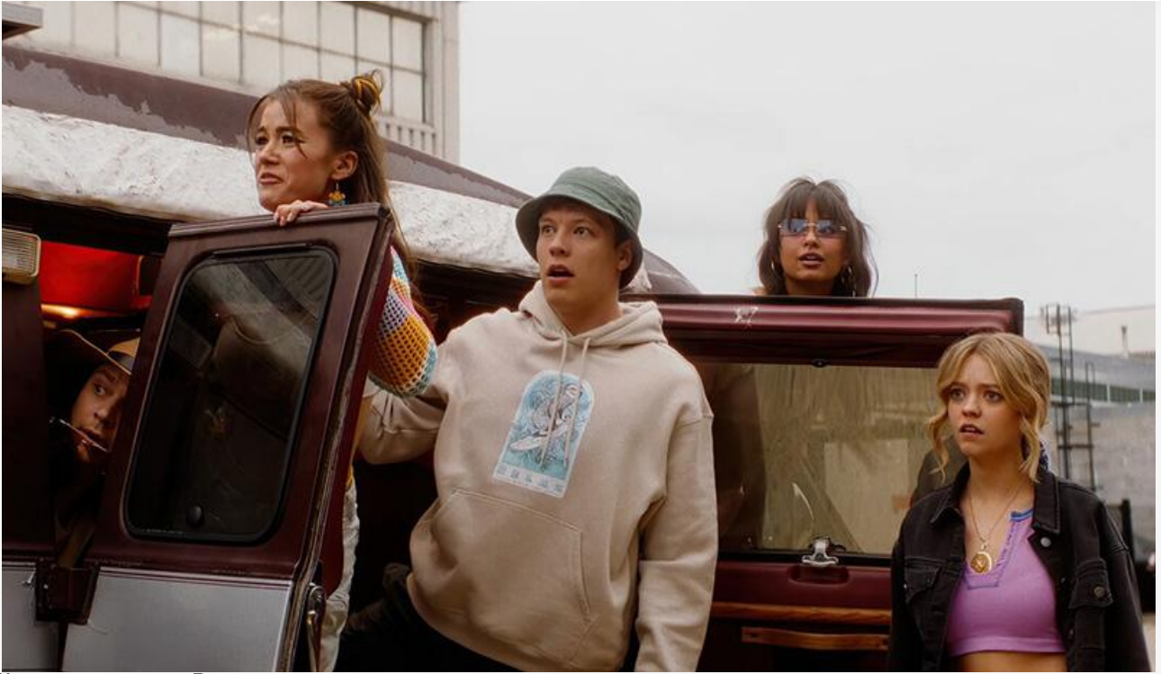
Кадр из фильма «Все мои друзья мертвы»