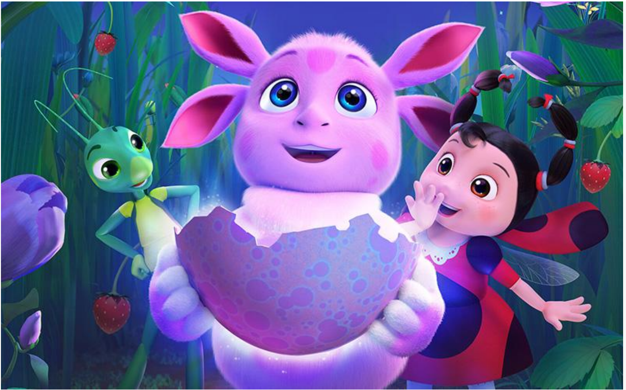
Постер к фильму «Лунтик. Возвращение домой»