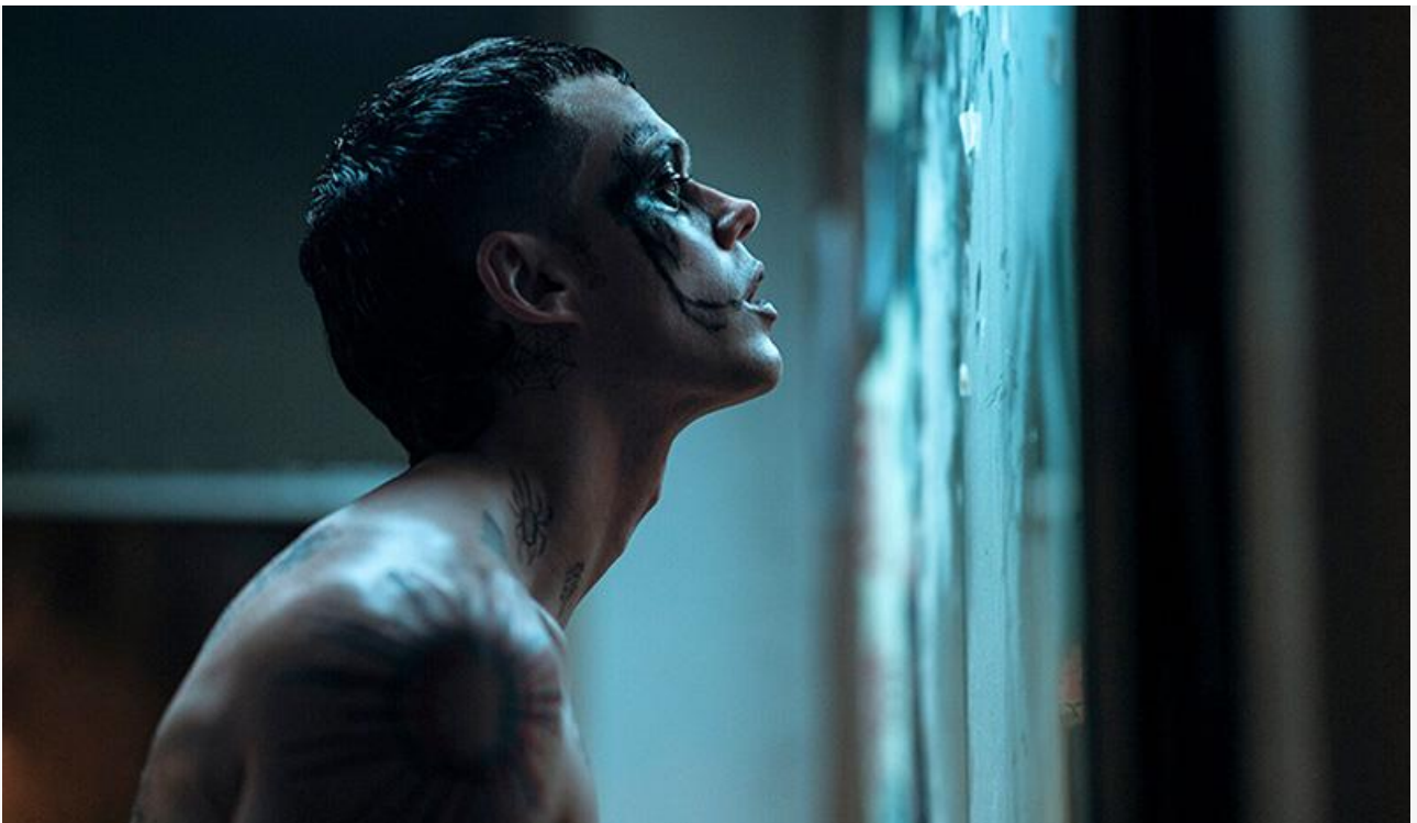
Билл Скарсгард в фильме «Ворон»

Серебро и бронза уикенда достались семейным новинкам проката. Анимационный вестерн «Как приручить бизона» собрал 22,9 миллиона и занял второе место, а фантастическая лента Антона Борматова «Пираты галактики Барракуда» с выручкой 22,1 миллиона стала третьей.