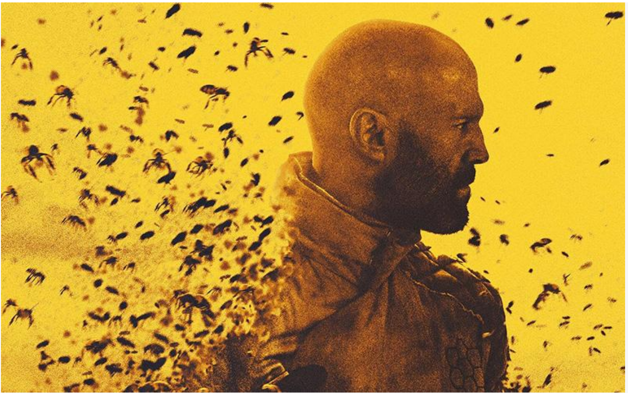
Постер к фильму «Пчеловод»

В формате перевыпуска зрители смогут посмотреть на большом экране отреставрированный в 4K культовый триллер Жан-Пьера Мельвиля с недавно ушедшим из жизни Аленом Делоном « Самурай », впервые вышедший на экраны в 1967 году, и аниме Хаяо Миядзаки 1988 года « Мой сосед Тоторо ».