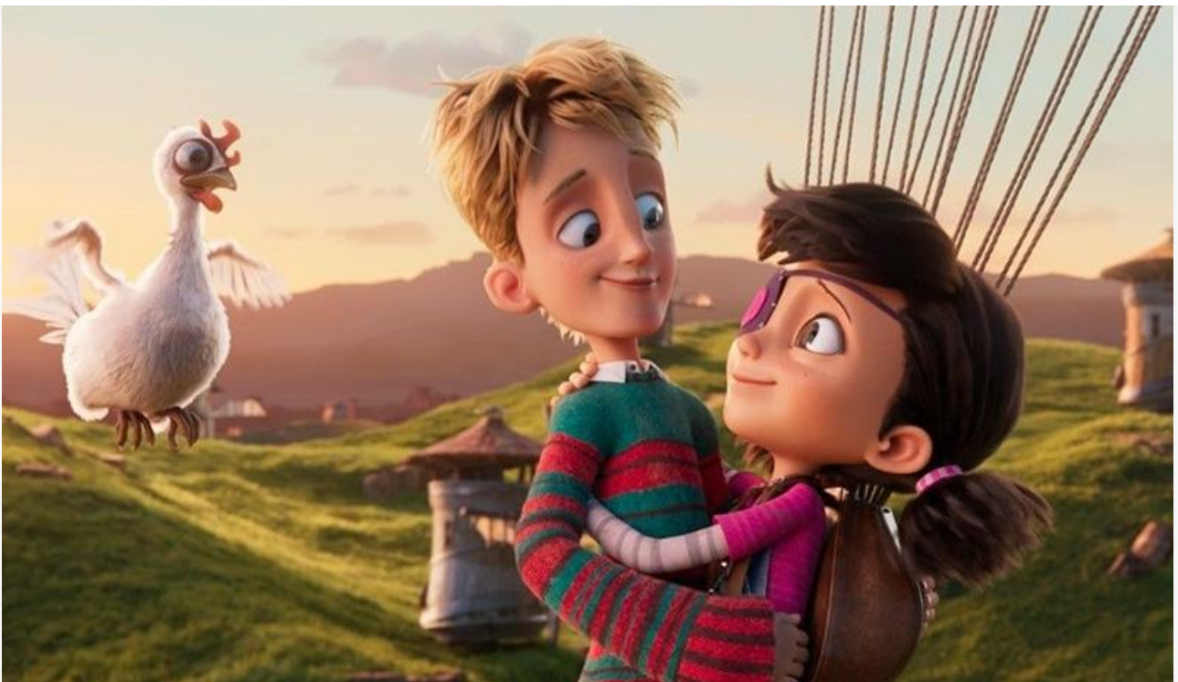
Кадр из фильма «Гиганты Ла-Манша»

А вот новые хорроры с треском провалились. «Нечисть в Сеуле» Хан Дон-сока с прибылью 2,1 миллиона заняла 18-е место, «Месть Золушки» Энди Эдвардса и вовсе стала 23-й с доходом 917 тысяч рублей.