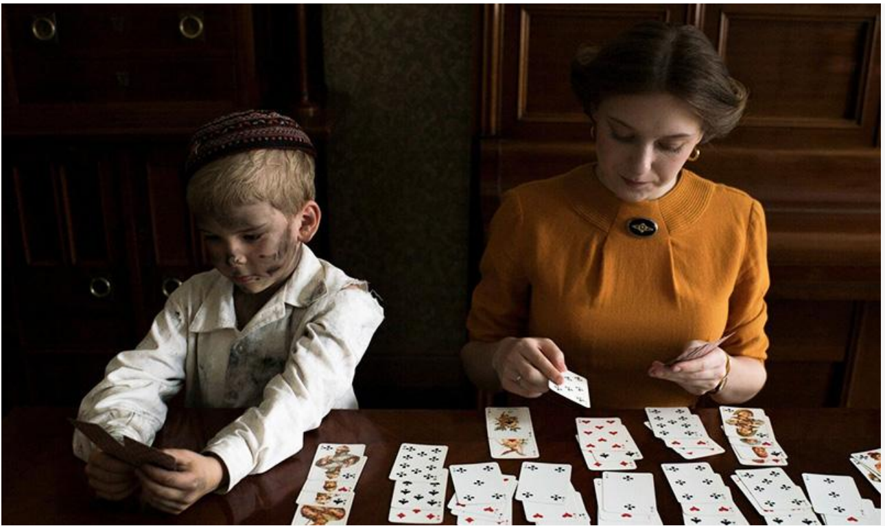
Кадр из фильма «Тайна Чёрной Руки»