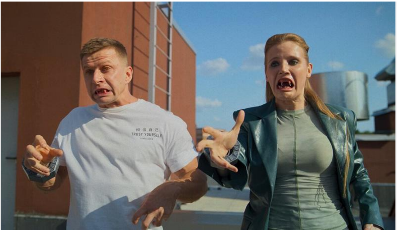
Кадр из фильма «Пираты галактики Барракуда»

Ещё один зарубежный мультфильм – «Гиганты Ла-Манша» Гонсало Гутьерреса – на 1 207 экранах заработал 7,2 миллиона рублей и расположился на седьмой строке чарта. Драма Дэвида Шурманна «Мой пингвин» с Жаном Рено в главной роли всего на 517 экранах выручила 6,3 миллиона и заняла восьмое место.