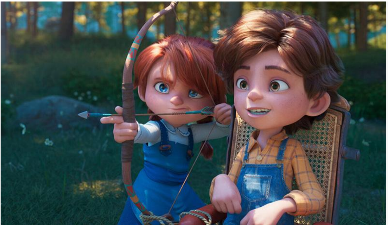
Кадр из фильма «Как приручить бизона»

Стоит отметить, что у отечественного фильма было в распоряжении на 752 экрана больше, чем у испанского мультфильма. Как следствие, при практически одинаковом доходе посещаемость «Бизона» заметно лучше, чем у «Пиратов»: 61,3 зрителя за сеанс против 35,1.