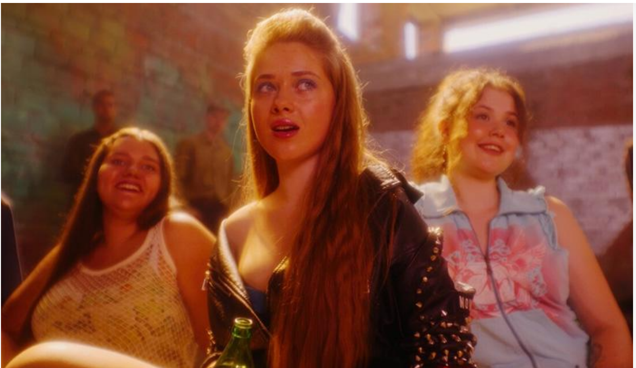
Кадр из фильма «Подростки. Первая любовь»