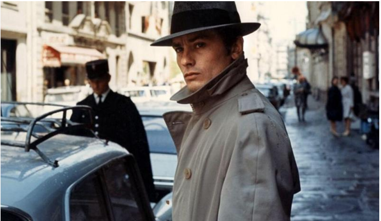
Ален Делон в фильме «Самурай»

В формате перевыпуска зрители смогут посмотреть на большом экране отреставрированный в 4K культовый триллер Жан-Пьера Мельвиля с недавно ушедшим из жизни Аленом Делоном « Самурай », впервые вышедший на экраны в 1967 году, и аниме Хаяо Миядзаки 1988 года « Мой сосед Тоторо ».