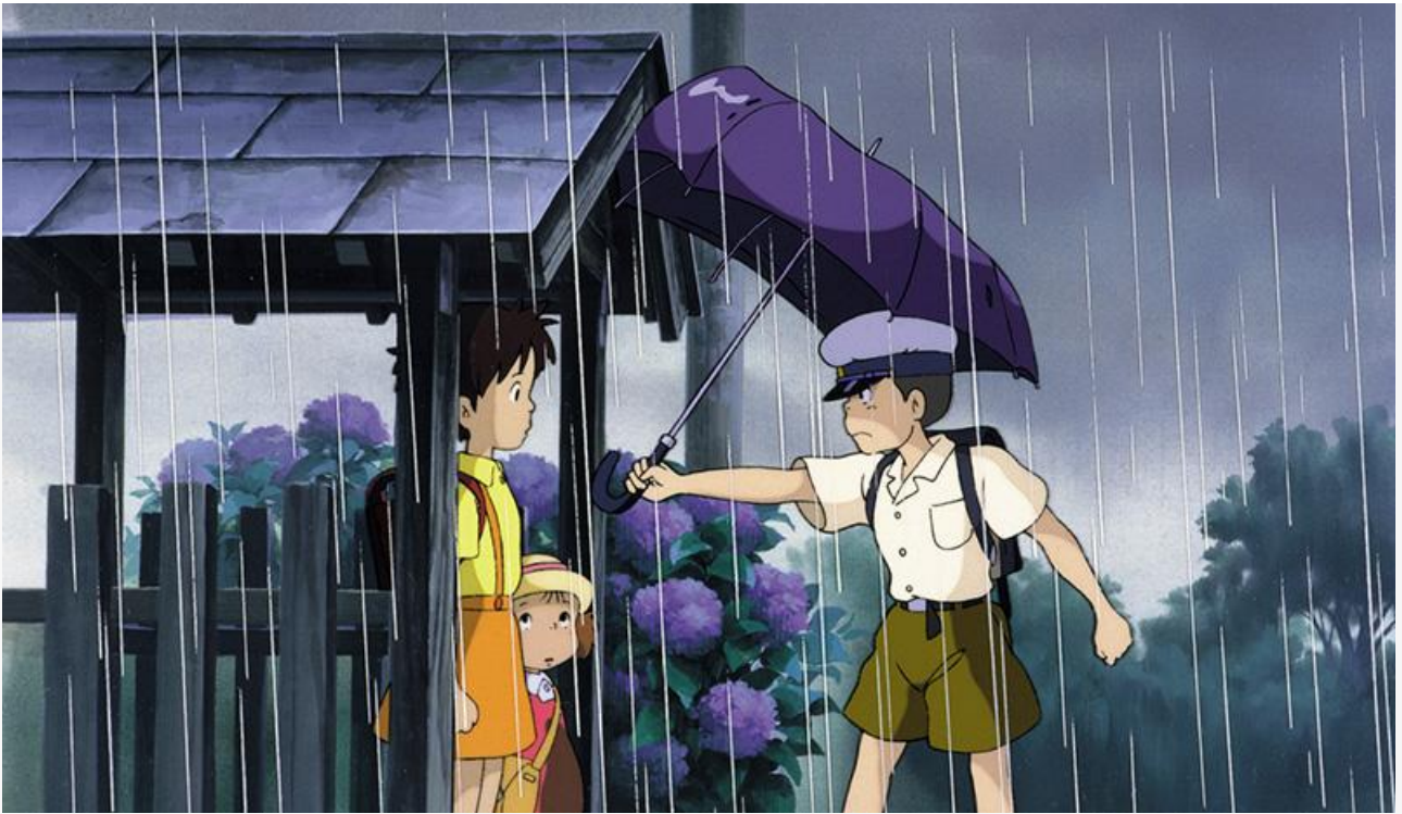
Кадр из фильма «Мой сосед Тоторо»