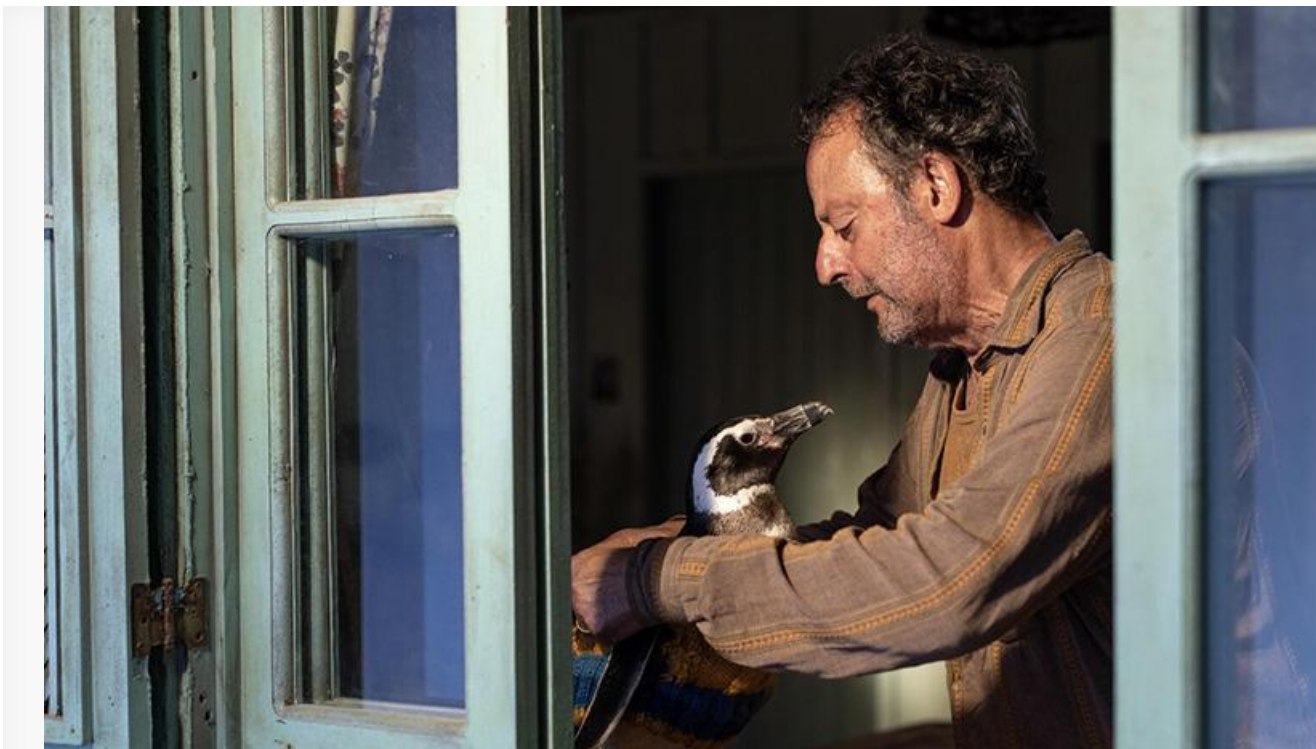
Кадр из фильма «Мой пингвин»

Лидер двух предыдущих уикендов – экшн-комедия Элая Рота «Бордерлендс» – потерял в сборах 63 % и опустился на пятую строку чарта, пополнив копилку на 11,9 миллиона.