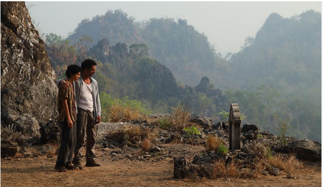
Кадр из фильма «Ларго Винч: Гнев прошлого»