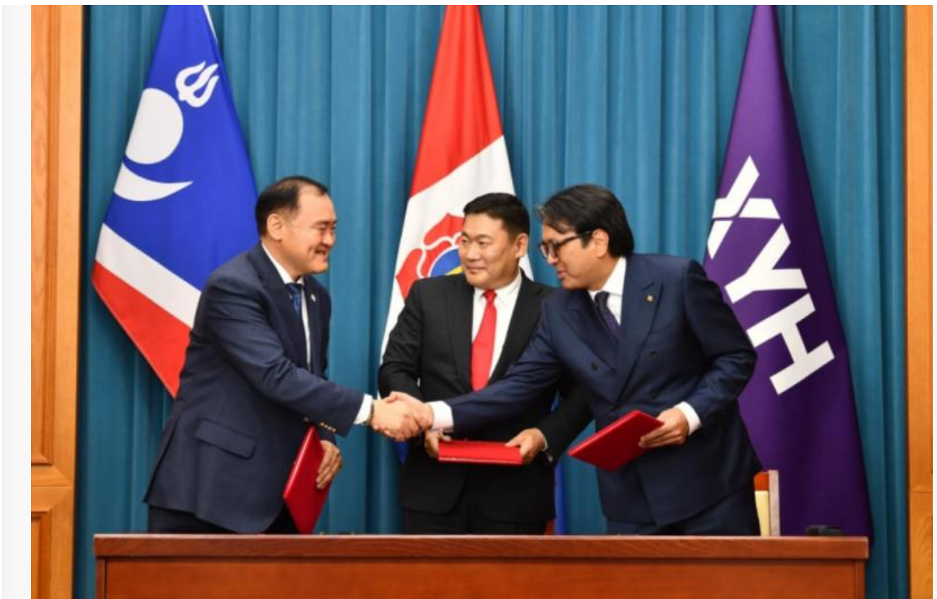
Лидеры трёх партий подписывают Совместный правительственный договор

Однако монгольский политический исследователь Оргил Дугерсурен считает, что создание подобной коалиции в Монголии может подрывать демократические устои. В своей статье для международного политического издания East Asia Forum он заявил, что коалиция была создана лишь потому, что Монгольская народная партия не хочет отказываться от абсолютного большинства в парламенте, которым она обладала с 2016 года. Более 80% имеющихся мест в парламенте всегда принадлежали МНП. В результате выборов 2024 года партия впервые получила не абсолютное большинство в парламенте, а простое большинство в 68 мест из 126 возможных.