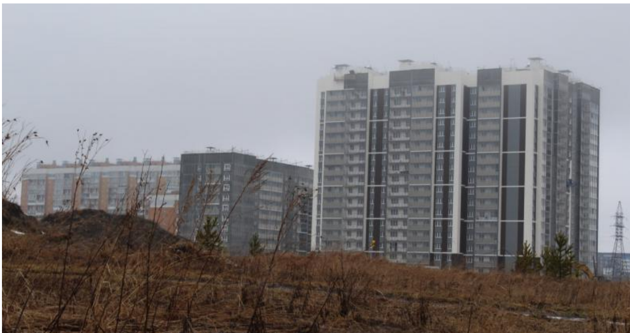
Фото: тг-канал «МИЛЫЙ ТОМСК», Бабр

Автор: Андрей Игнатьев © Babr24.com НЕДВИЖИМОСТЬ, ОБЩЕСТВО, ЭКОНОМИКА И БИЗНЕС, ТОМСК 👁 14543 23.08.2024, 10:07 🔄 236