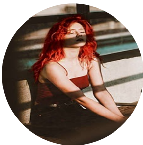
Автор текста: Саша Савельева , журналист.

Связаться с редакцией Бабра в Иркутской области: irkbabr24@gmail.com