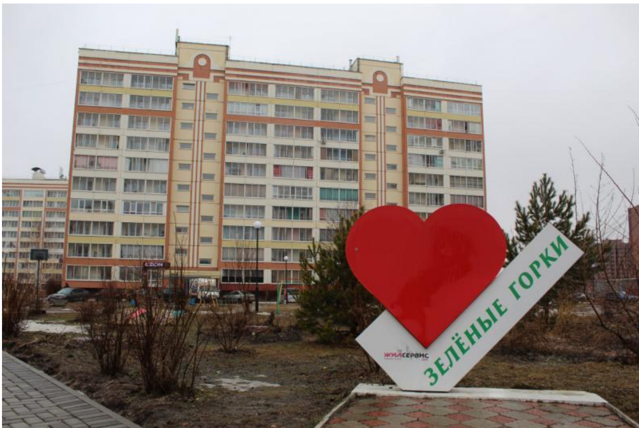
Видео: тг-канал Владимира Мазура

Автор: Андрей Игнатьев © Babr24.com ЗДОРОВЬЕ, ОБЩЕСТВО, ПОЛИТИКА, ТОМСК 👁 13955 22.08.2024, 15:08 📄 223