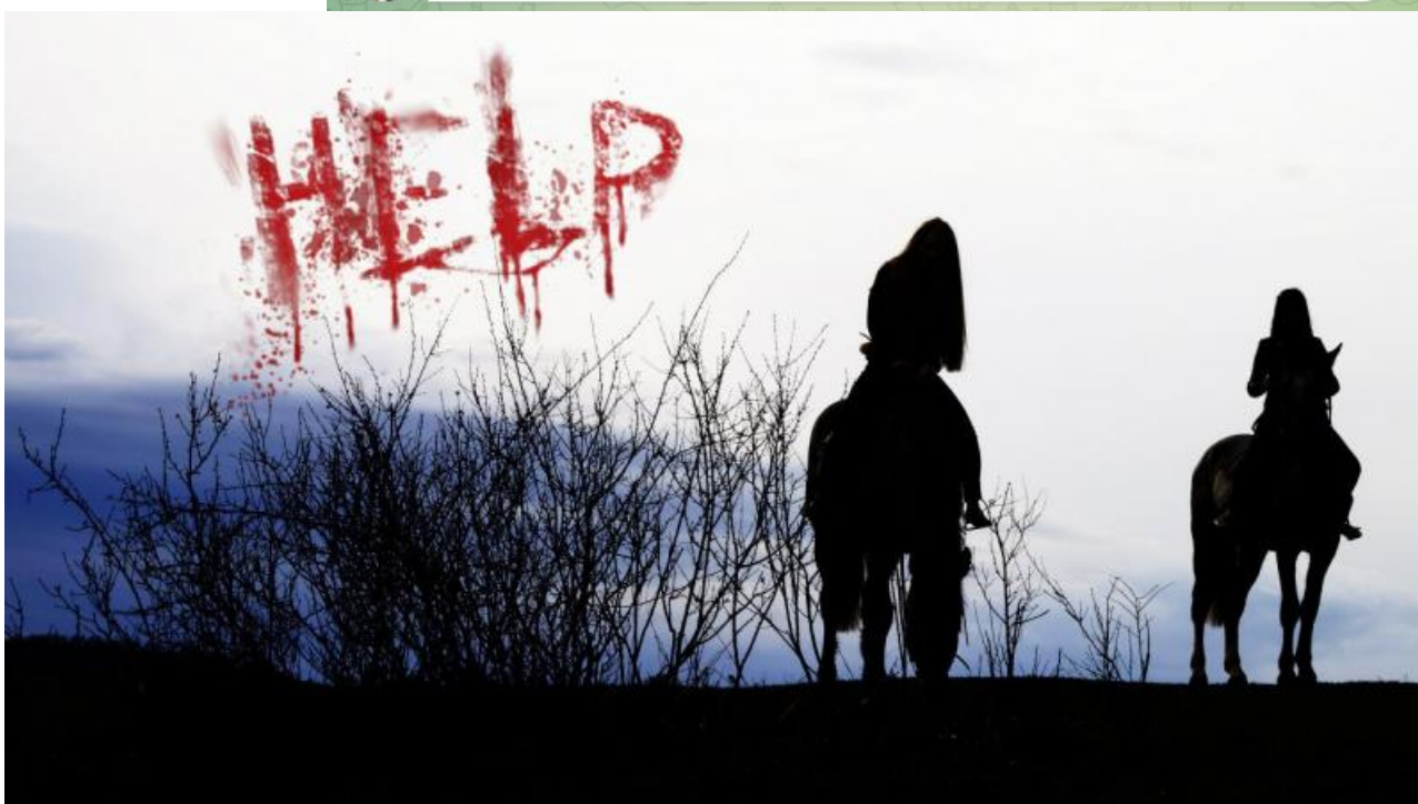
Фото: t.me/kras_mash , vk.com/kapriolclub , trk7.ru

Автор: Анна Роменская © Babr24.com БРАТЯ МЕНЬШИЕ, СКАНДАЛЫ, ЭКОНОМИКА И БИЗНЕС, КРАСНОЯРСК 👁 23534 22.08.2024, 13:12 📄 151