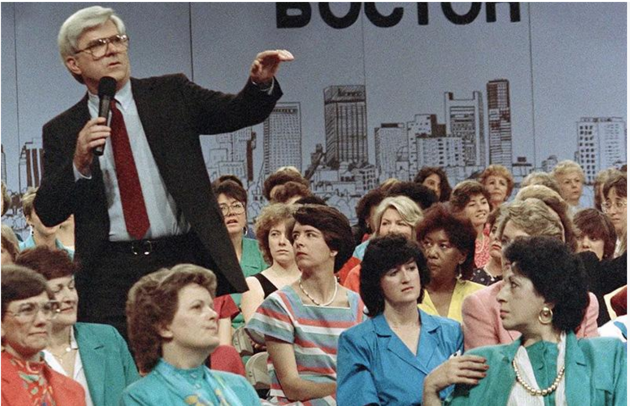
Фил Донахью во время телемоста Ленинград – Бостон

Не менее знаковым событием стал советско-американский телемост журналистов 1987 года, который также вели Познер и Донахью.