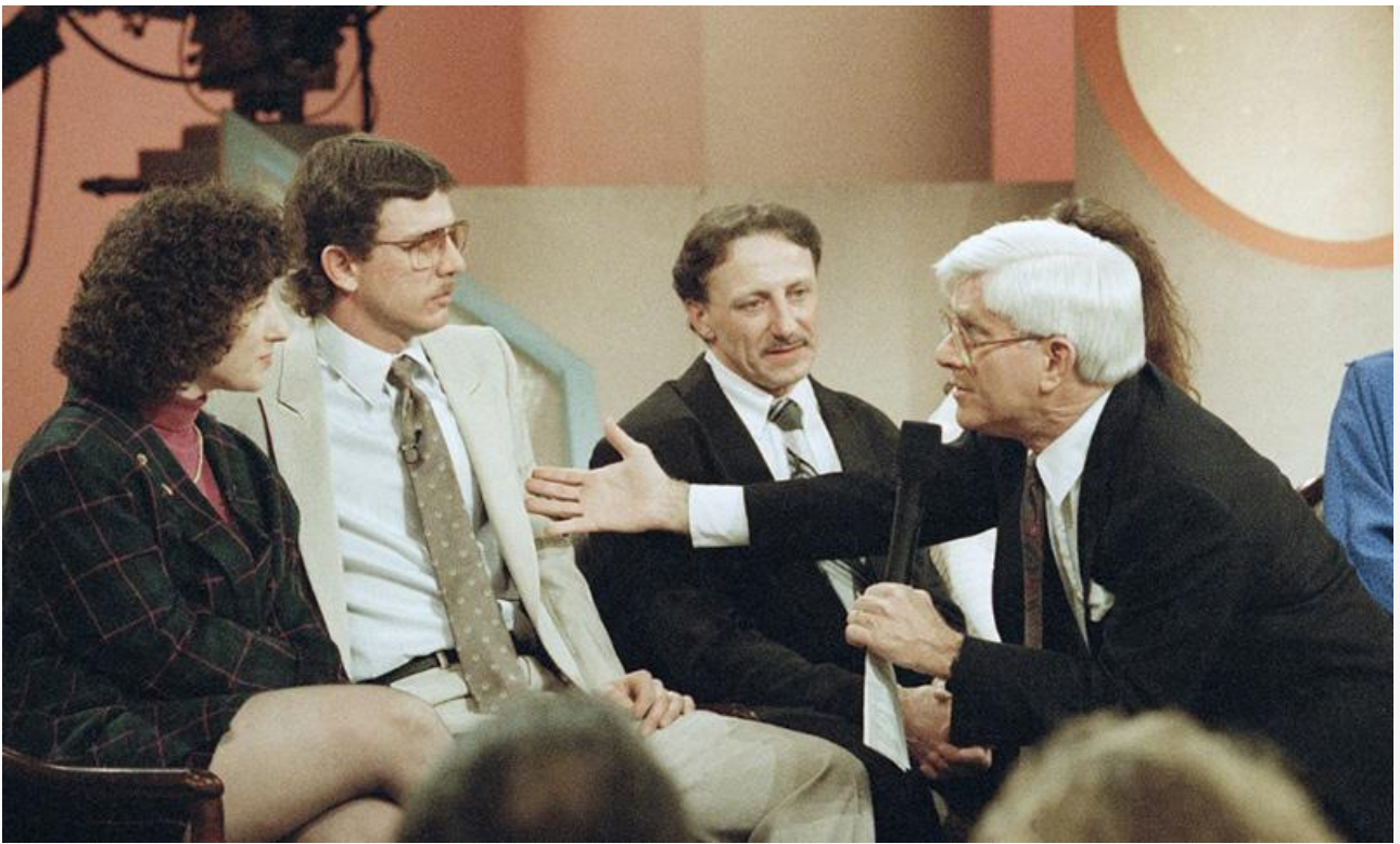
Шоу Фила Донахью

В Советском Союзе Фил Донахью стал известен благодаря резонансным телемостам СССР – США, которые он вёл совместно с Владимиром Познером. Во время одного из них, а именно телемоста Ленинград – Бостон «Женщины говорят с женщинами» в 1986 году, была впервые произнесена фраза «В СССР секса нет» (дословно: «секса у нас нет, и мы категорически против этого»), ставшая впоследствии крылатой.