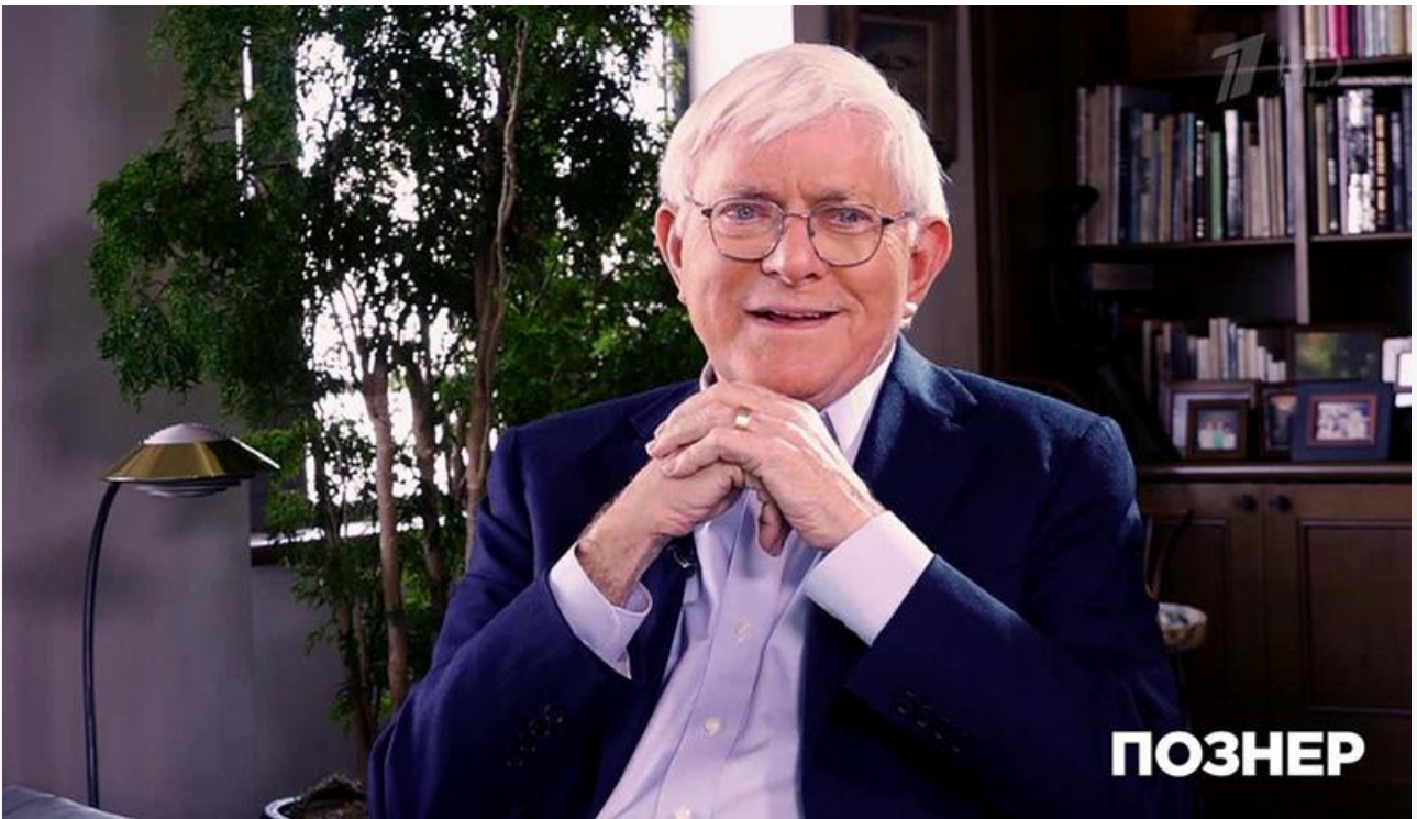
Фил Донахью в программе «Познер», 2019 год

В мае 2024 года, за 3,5 месяца до смерти, Фил Донахью был награждён одной из двух высших гражданских наград США – Президентской медалью Свободы.