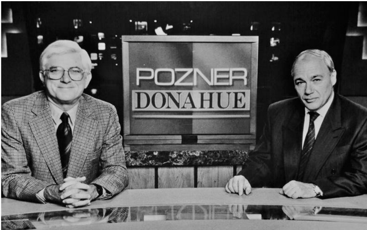
Фил Донахью и Владимир Познер в программе Pozner & Donahue

С 1991 по 1996 год в США на телеканале CNBC еженедельно выходила совместная программа Фила Донахью и Владимира Познера Pozner & Donahue. В апреле 2019 года Донахью стал гостем программы «Познер» на Первом канале.