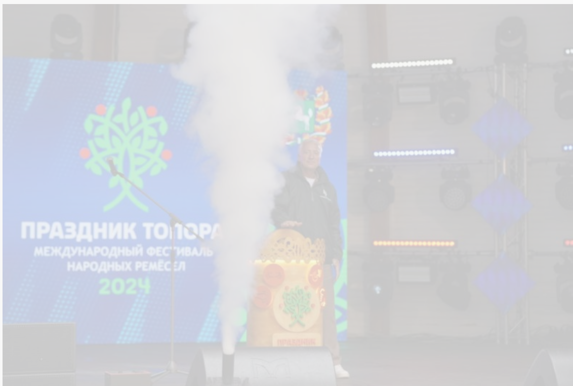
Народный НЕ Губернатор (@negubernatore)

Фестиваль продлится до 24 августа включительно. Приезжайте всей семьей и вы!