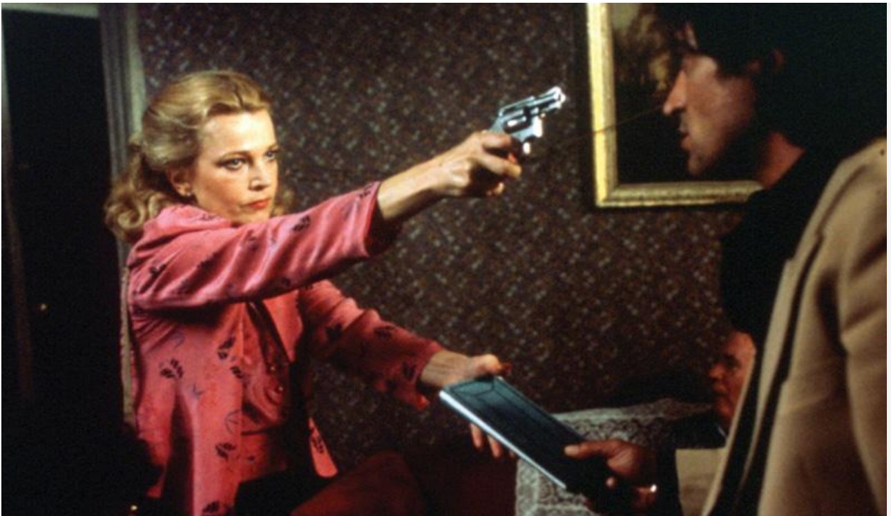
Глория Свенсон в фильме «Глория», 1980 год

Всего Джина Роулэндс снялась более чем в 60 фильмах и сериалах, в том числе снятых её супругом Джоном Кассаветисом («Ребёнок ждёт», «Лица», «Минни и Москович», «Женщина не в себе», «Премьера», «Глория», «Потоки любви»), сыном Ником Кассаветисом («Отцепись от звёзд», «Она прекрасна», «Дневник памяти», «Жёлтый») и дочерью Зоей Кассаветис («Любовь со словарём»).