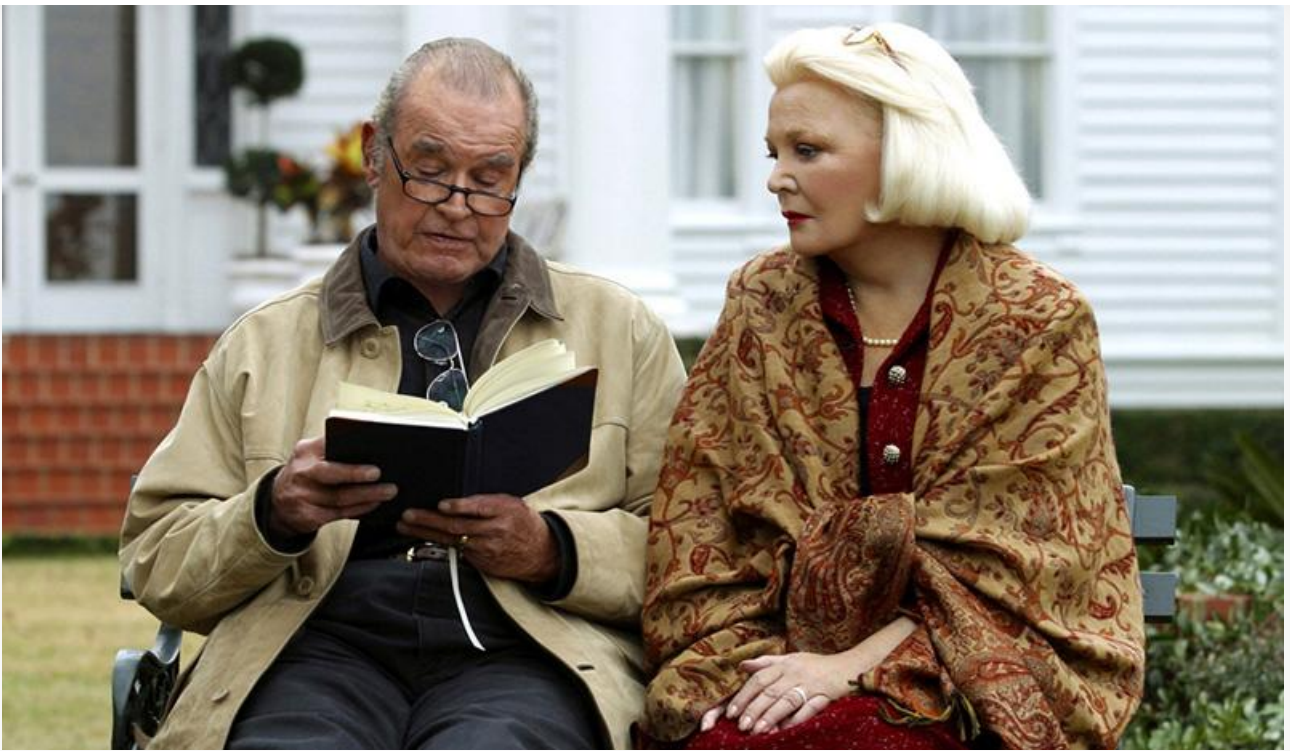
Элли Кэлхун в фильме «Дневник памяти», 2004 год