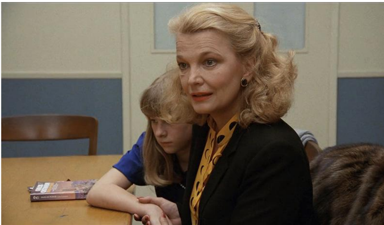
Сара Лаусон в фильме «Потоки любви», 1984 год