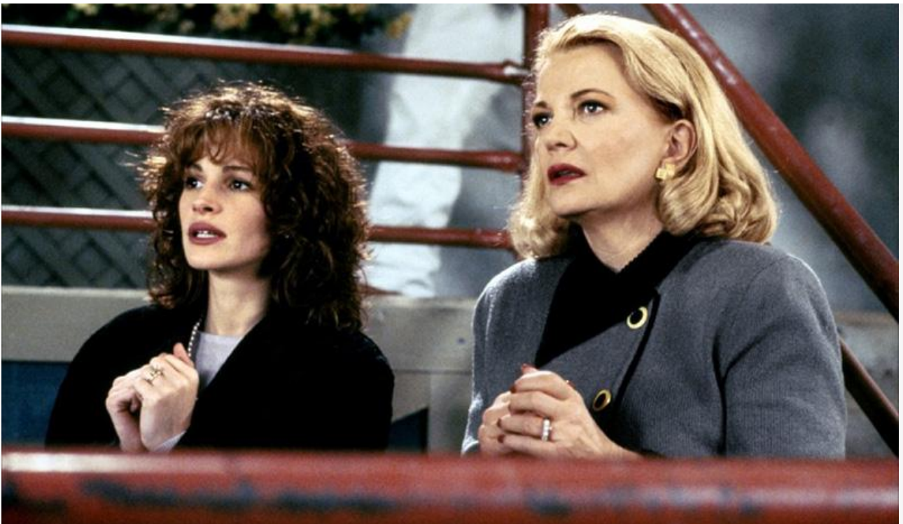
Джорджия Кинг в фильме «Тема для разговора», 1995 год