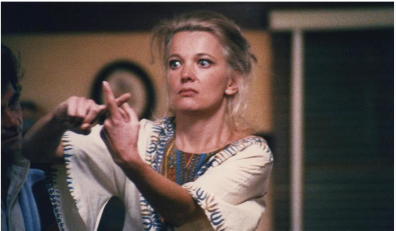
Мэйбл Лонгетти в фильме «Женщина не в себе», 1974 год