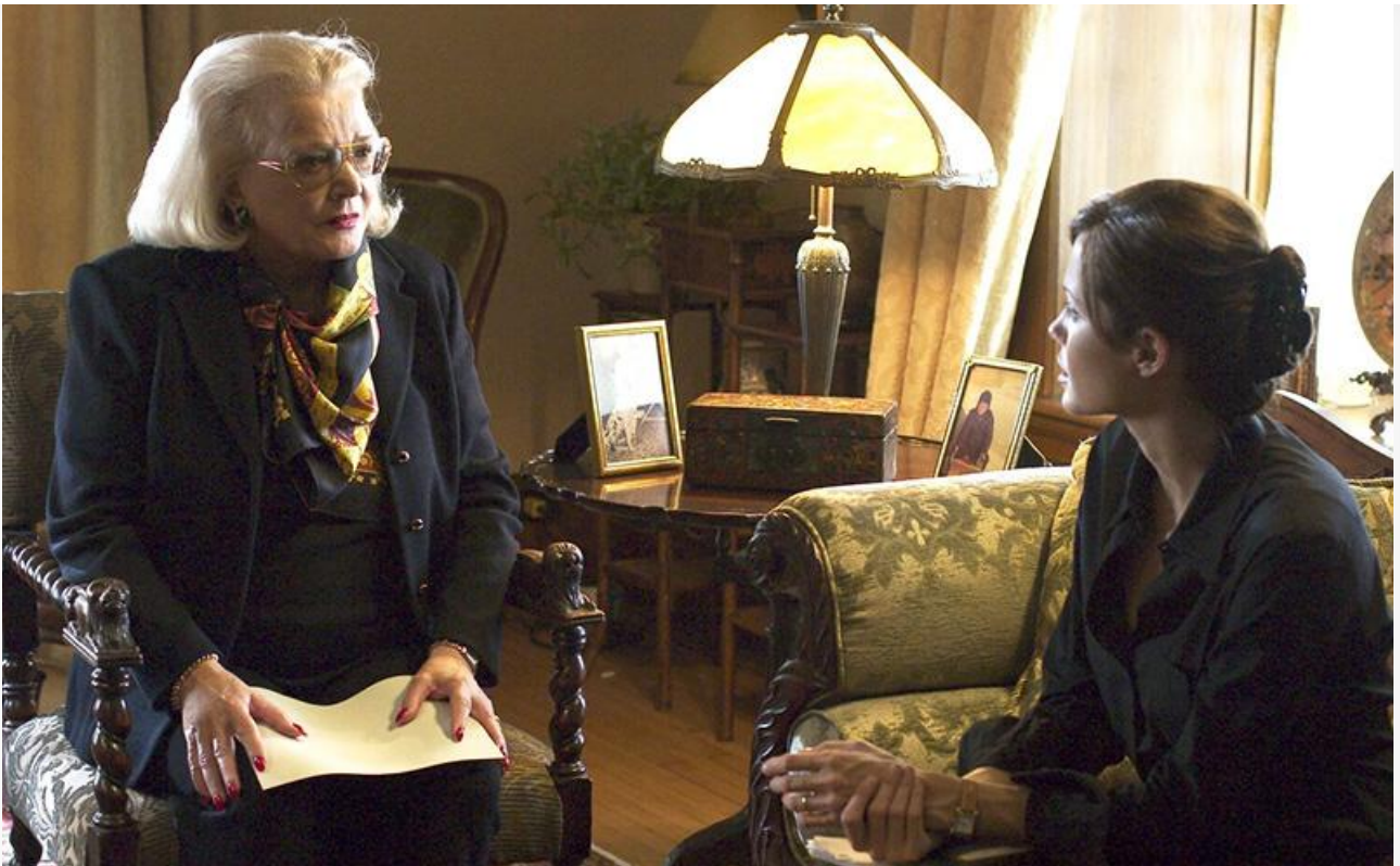
Миссис Эшер в фильме «Забирая жизни», 2004 год