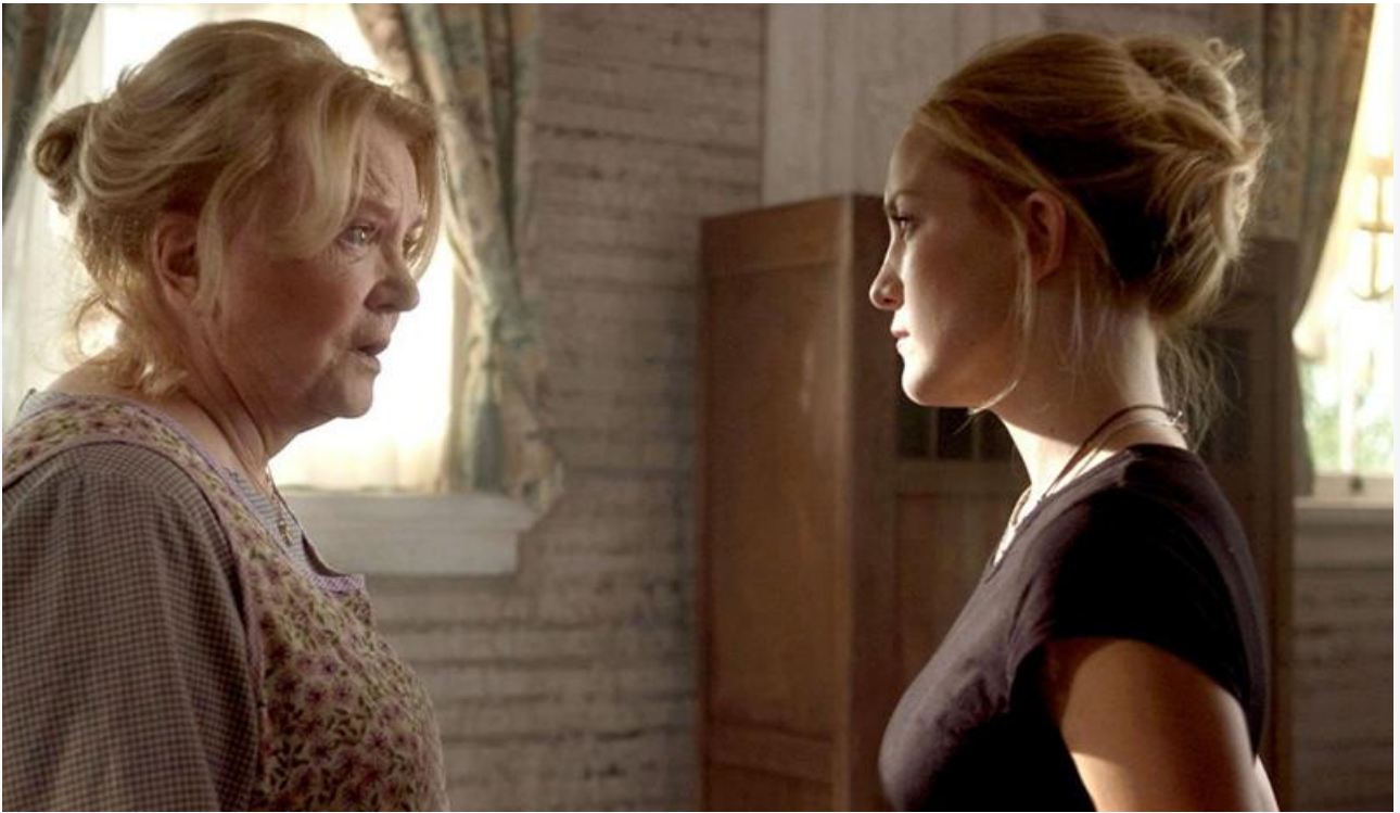
Вайолет Деверо в фильме «Ключ от всех дверей», 2005 год