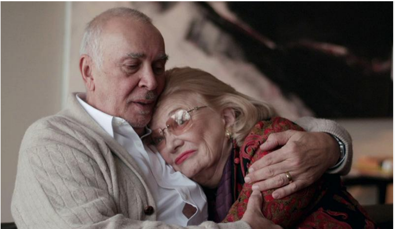
Эстер в фильме «Одна миллиардная доля». Последняя роль в кино, 2014 год