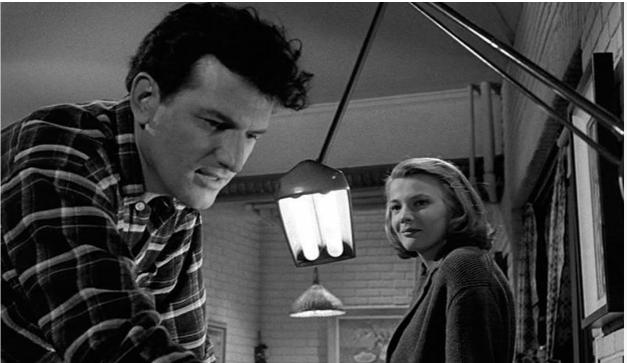
Софи Уиддикомб в фильме «Ребёнок ждёт», 1963 год