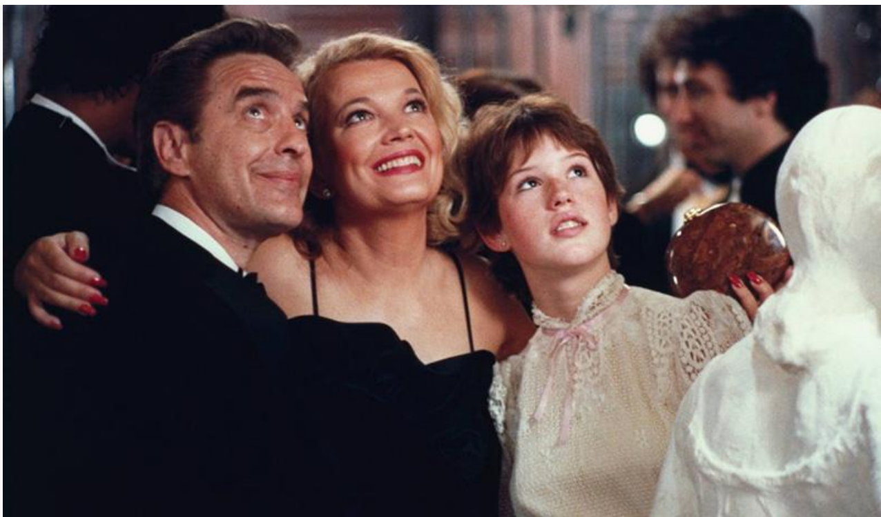
С Джоном Кассаветисом в фильме «Буря», 1982 год

Бринкса»), Пола Мазурски («Буря»), Пола Шредера («Дневной свет»), Вуди Аллена («Другая женщина»), Джима Джармуша («Ночь на Земле»), Лассе Халльстрёма («Тема для разговора»), Фореста Уитакера («Проблески надежды»), Питера Челсома («Великан»), Иэна Софтли («Ключ от всех дверей») и других именитых режиссёров.