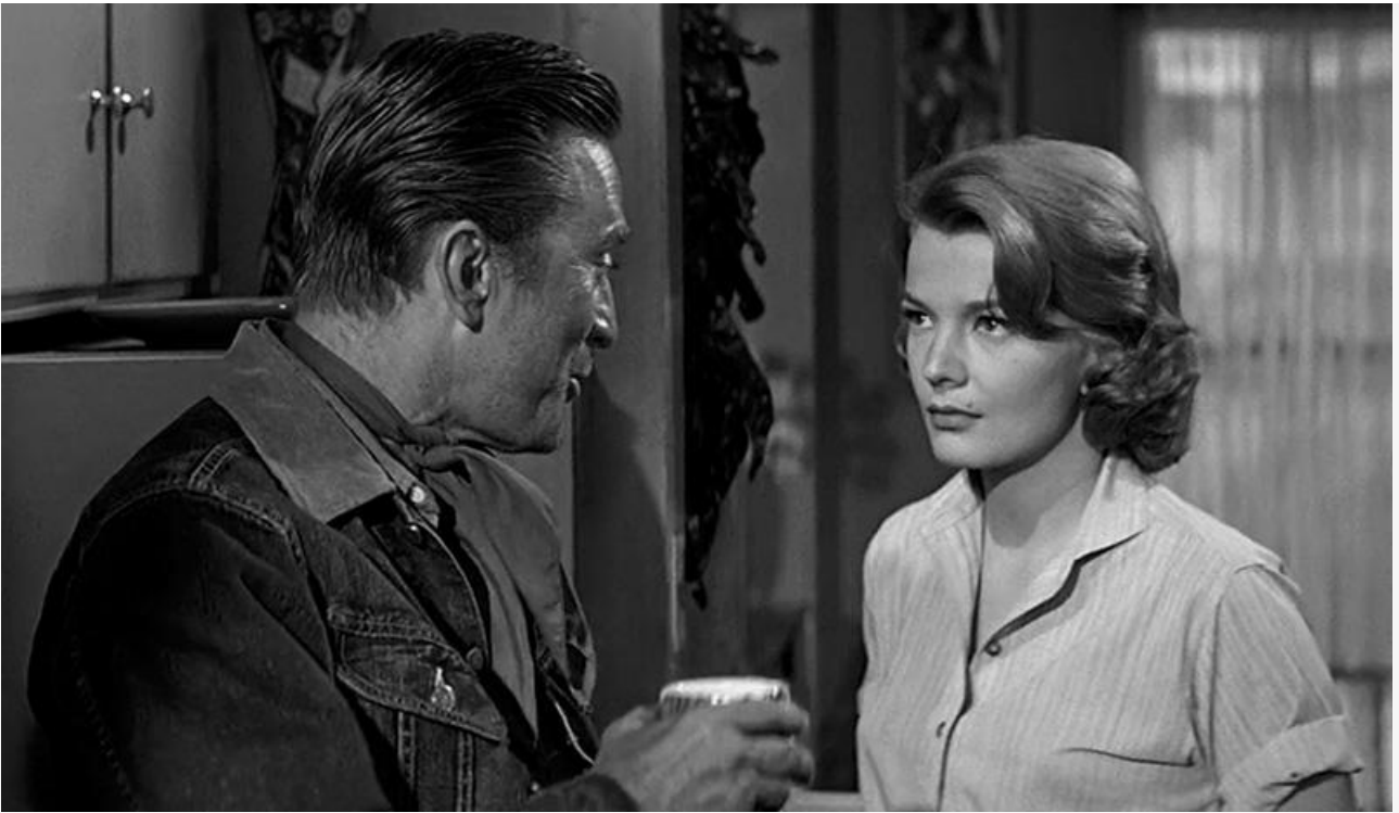
С Кирком Дугласом в фильме «Одиноким отважны», 1962 год