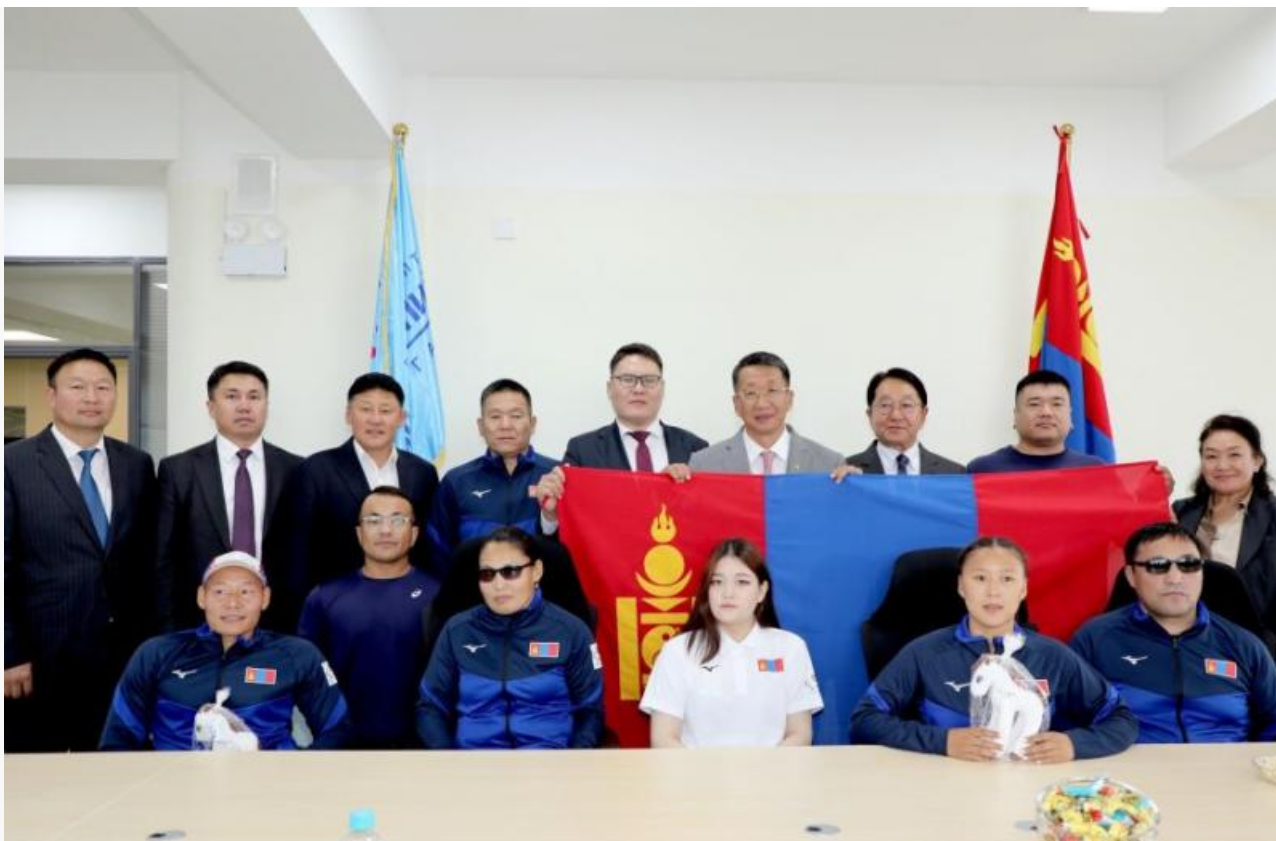
Паралимпийская сборная Монголии в гостях у депутатов Великого хурала