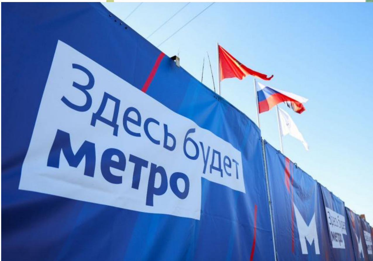
Фото: t.me/metrovkrsk , t.me/adm_krasnoyarsk , t.me/prmira_news

Автор: Анна Роменская © Babr24.com ПОЛИТИКА, ТРАНСПОРТ, ЭКОНОМИКА И БИЗНЕС, КРАСНОЯРСК 👁 11823 13.08.2024, 13:04 🗨 145