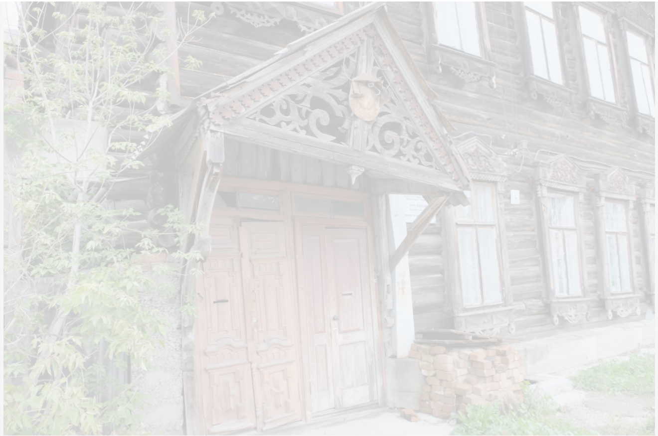
Автор: Алёна Штерн Фото из альбома "Томск. Старый город" © Фотобанк "RuBabr"

Осенью 2023 года Министерство культуры РФ приняло проект исторических границ Томска и направило его в Министерство юстиции РФ для утверждения.