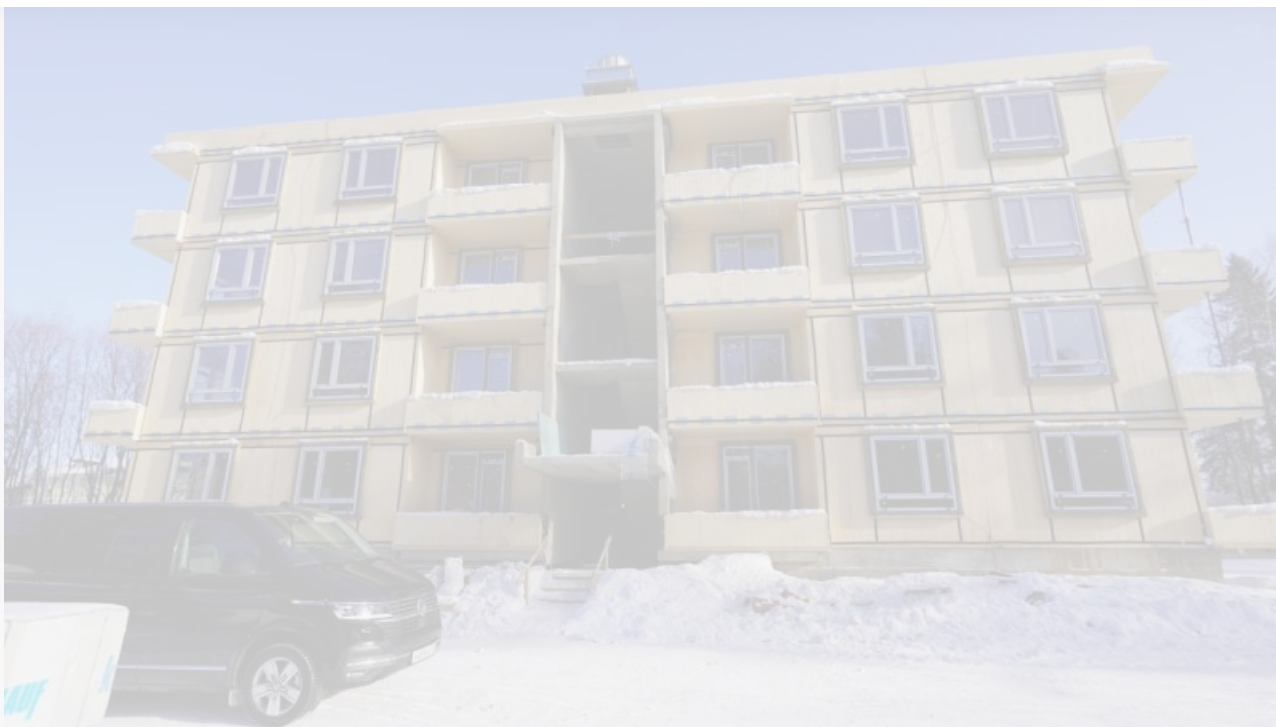
Недостроенный дом из CLT-панелей в Байкальске

Но каждая из озвученных проблем в своем решении требует реальных действий и затрат, осуществлять который ВЭБ.РФ не планировал. И предчувствие надвигающейся беды витало в городе задолго до свершившегося факта. Когда же и дальше измываться над городом и тащить бюджеты в свой карман стало просто невозможно, госкорпорация запаковала чемоданчики и отбыла в неизвестном направлении. Брошены на произвол судьбы вымученные эко-тропы, которые теперь неясно кому и зачем содержать, и недостроенный дом из CLT-панелей, в который вряд ли кто-то уже заселится. В целом: байкальчане брошены.