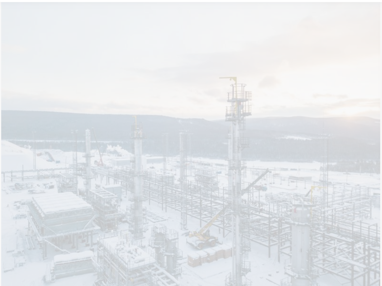
Завод полимеров в Усть-Куте

В конкретном случае мастер-план – стратегия дальнейшей деятельности компании по развитию северного города, способ привлечь внимание иных спонсоров к отдалённой территории и сбалансировать вклад частных инвесторов и бюджетных средств. Мастер-план – инструмент по привлечению, а не лекарство от всех болезней.