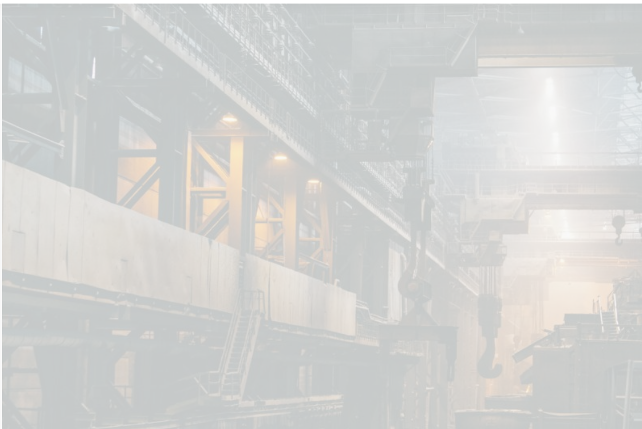
Байкальский целлюлозно-бумажный комбинат

Байкальск – молодой моногород на западном побережье Байкала. До 2013 года экономика населенного пункта базировалась на работе Байкальского целлюлозно-бумажного комбината. Он был главным поставщиком рабочих мест для населения города, он же формировал бюджет города и брал на себя обязательства социального партнерства, поддерживая власть города точечными проектами.