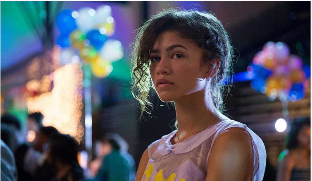
Зендея в фильме «Человек-паук: Возвращение домой»