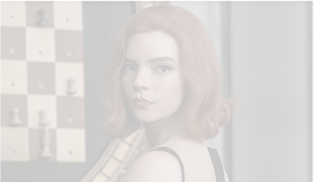
Аня Тейлор-Джой в фильме «Ход королевы»