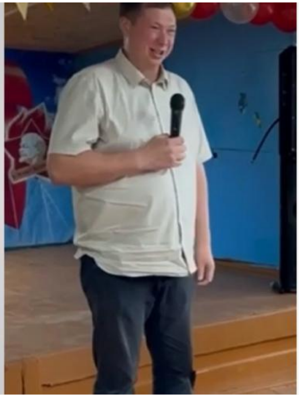
Дядя и племянник

Автор: Георгий Булычев © Babr24.com ПОЛИТИКА, СКАНДАЛЫ, ОБЩЕСТВО, ИРКУТСК 👁 25221 31.07.2024, 18:42 📄 191