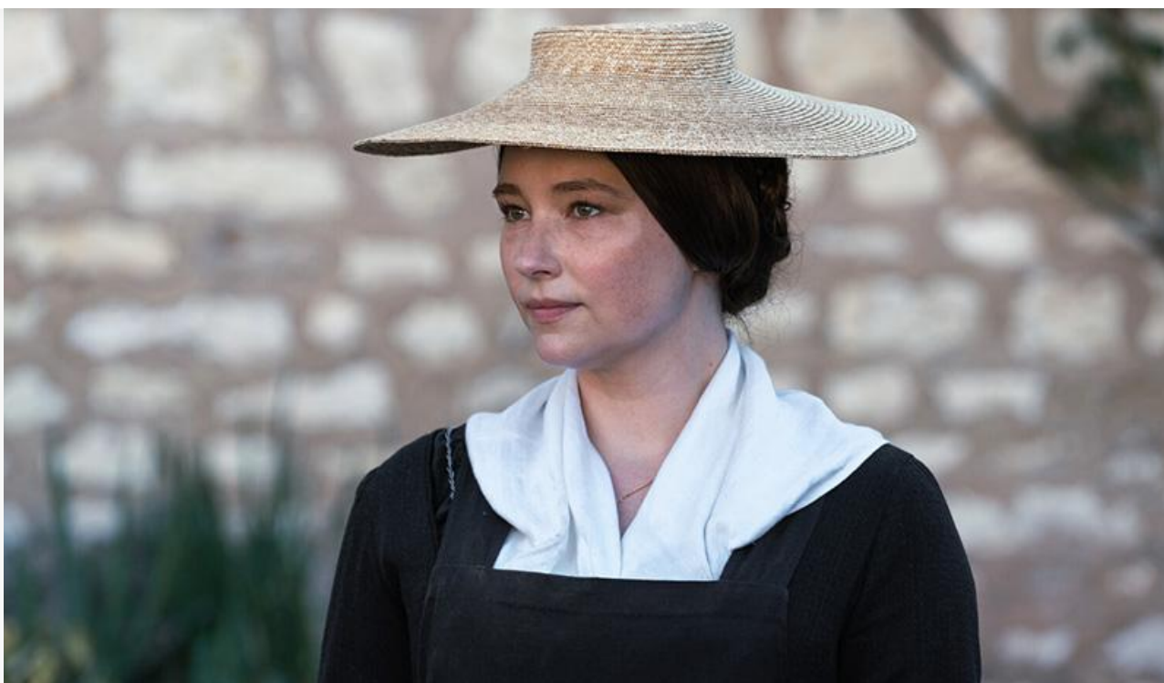
Хейли Беннетт в фильме «Мадам Клико»

Не задался старт в прокате и у «Эффекта парадокса» Скотта Вейнтроба с Ольгой Куриленко и Харви Кейтелем: 1,7 миллиона на 439 экранах и 20-е место в чарте.