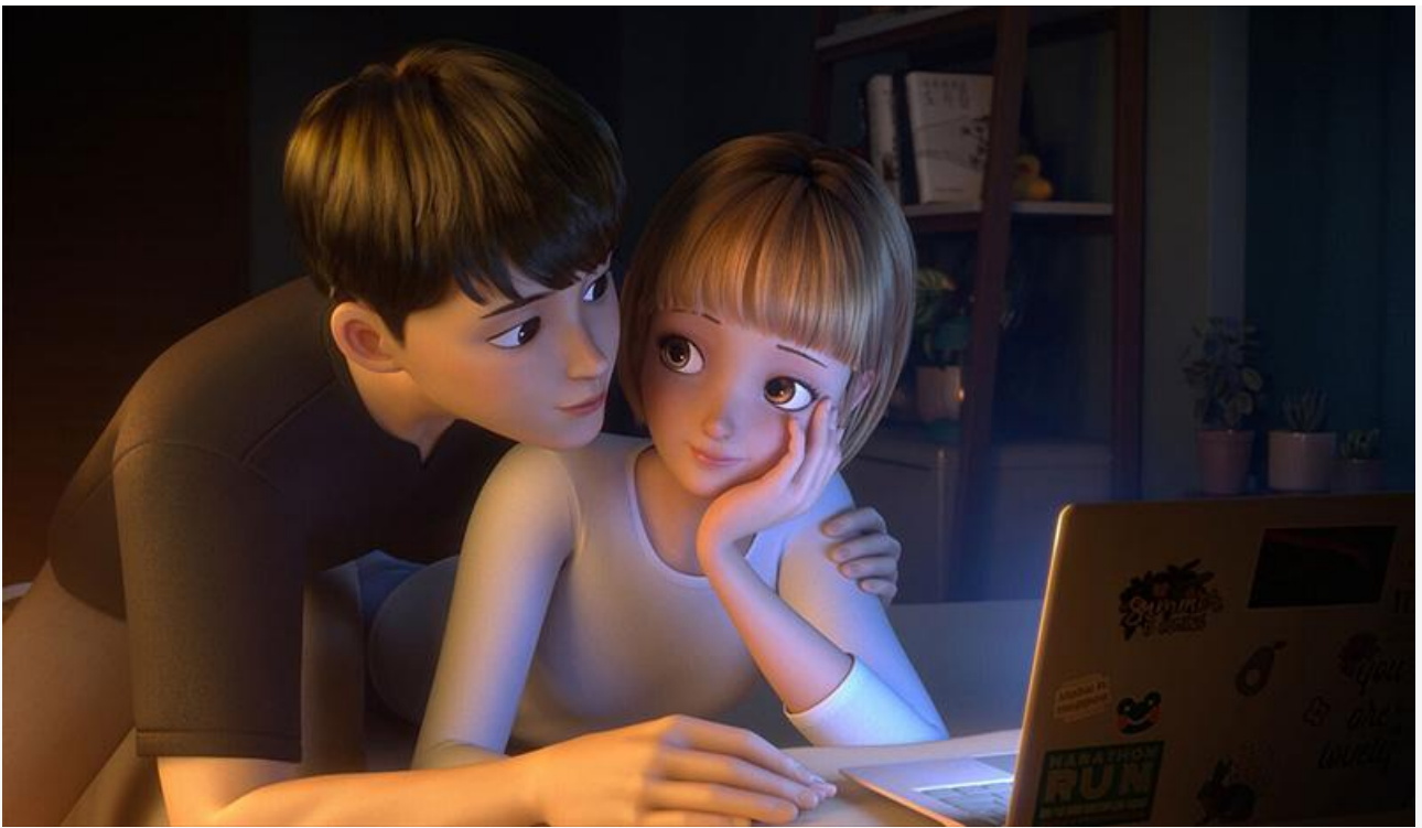
Кадр из фильма «Мир в моей голове»

Впервые в российском прокате будет показан индонезийско-южнокорейский хоррор Джоко Анвара «Заклятье: Слуги Сатаны» (18+), мировая премьера которого состоялась в 2017 году.