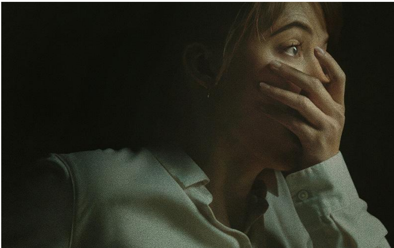
Постер к фильму «Собиратель душ»