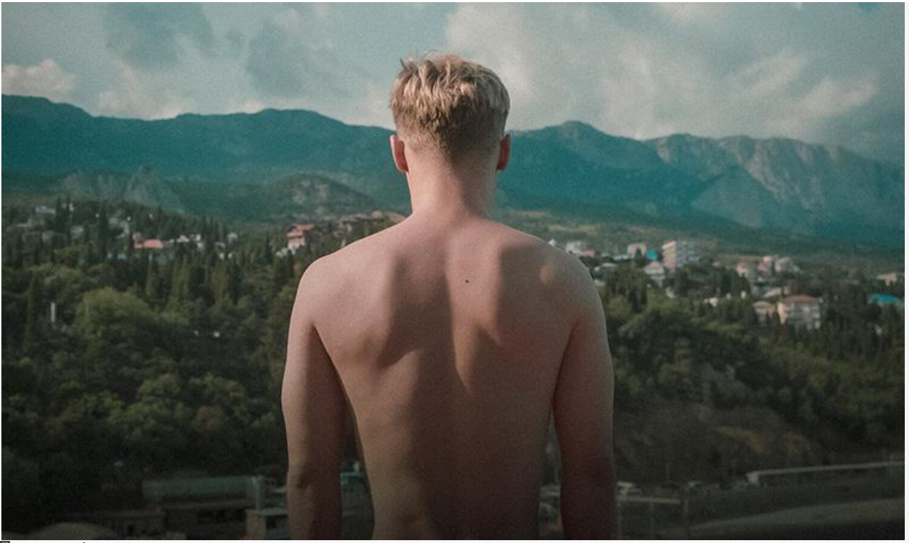
Постер к фильму «В потоке трёх стихий»

Семейную аудиторию ждут в кинотеатрах китайский мультфильм Линя Хуэйды «Побег из лабиринта времени» и южнокорейская драмеда Ким Дон-мина «Хвостатый переполох» .