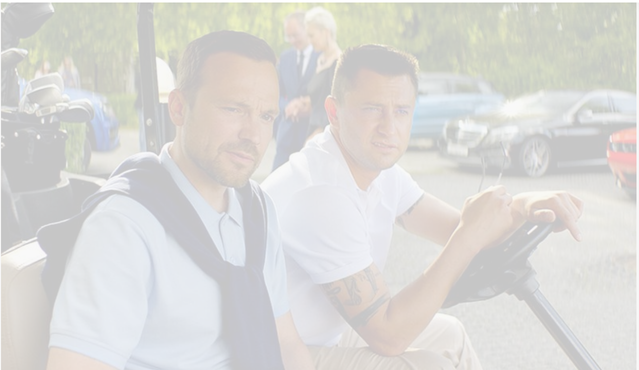
Алексей Чадов и Павел Прилучный в фильме «Водитель-олигарх»

«Сарафан» новинки при этом не провальный, но и не выдающийся: рейтинг «Водителя-олигарха» на «Кинопоиске» зафиксировался на отметке 5,8.