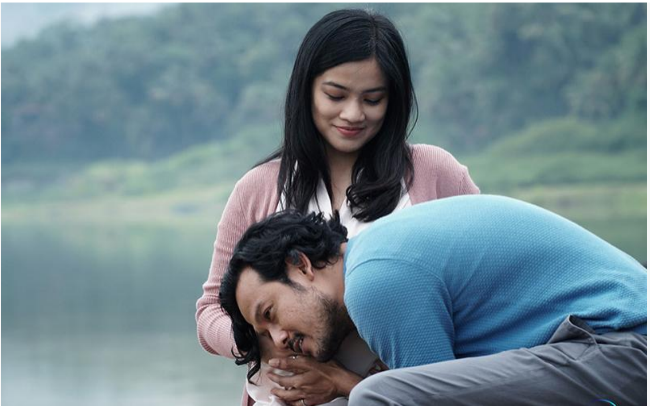
Кадр из фильма «Кукла: Зарождение зла»

Лидер предыдущего уикенда – семейная комедия Василия Свиридова «Не одна дома» – потеряла в сборах сдержанные 23 % и, пополнив копилку на 32,6 миллиона, гордо опустилась на вторую строку чарта.