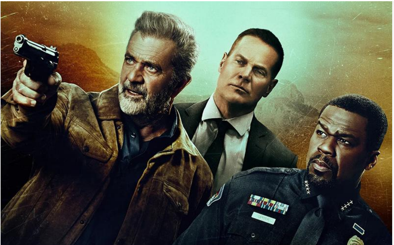
Постер к фильму «Список подозреваемых»