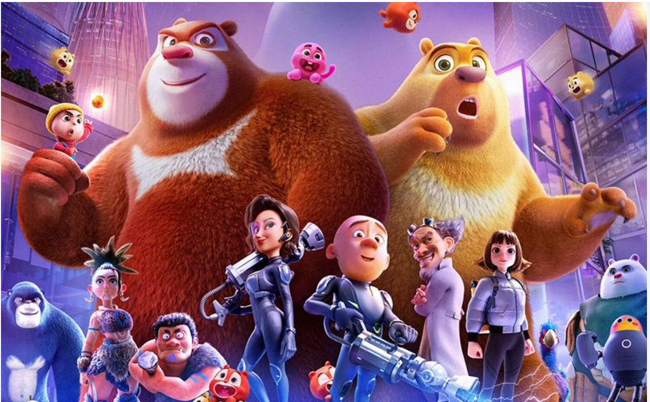
Постер к фильму «Побег из лабиринта времени»

Неплохие шансы на попадание в топ-10 у американского экшн-триллера Азифа Акбара с Брайаном Ван Холтом и Мэлом Гибсоном «Список подозреваемых» (18+).