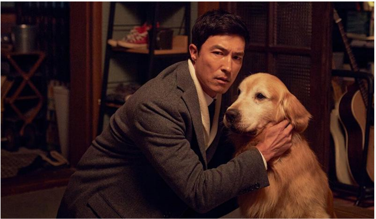
Кадр из фильма «Хвостатый переполох»