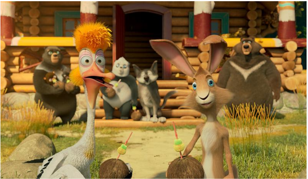
Кадр из фильма «Большое путешествие. Вокруг света»