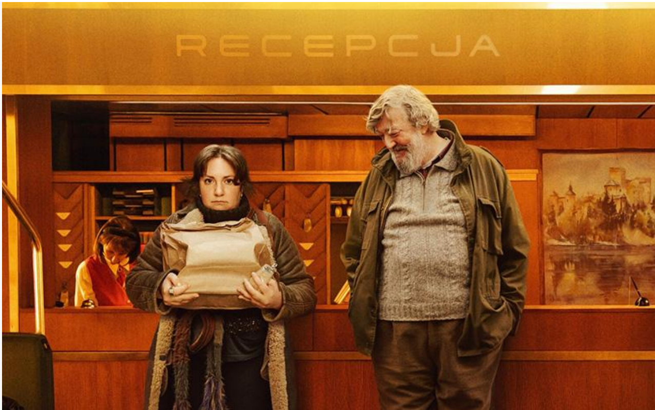
Постер к фильму «Моя семья»