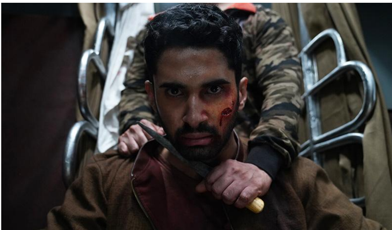
Кадр из фильма «Схватка»