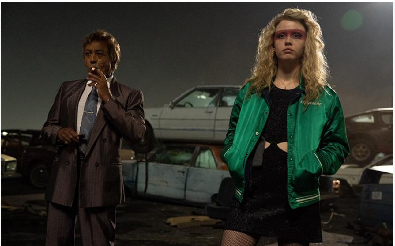
Кадр из фильма «Максин XXX»

Общая касса топ-20 фильмов уикенда составила 237,5 миллиона рублей. Это на 15,75 % больше по сравнению с предыдущими выходными .