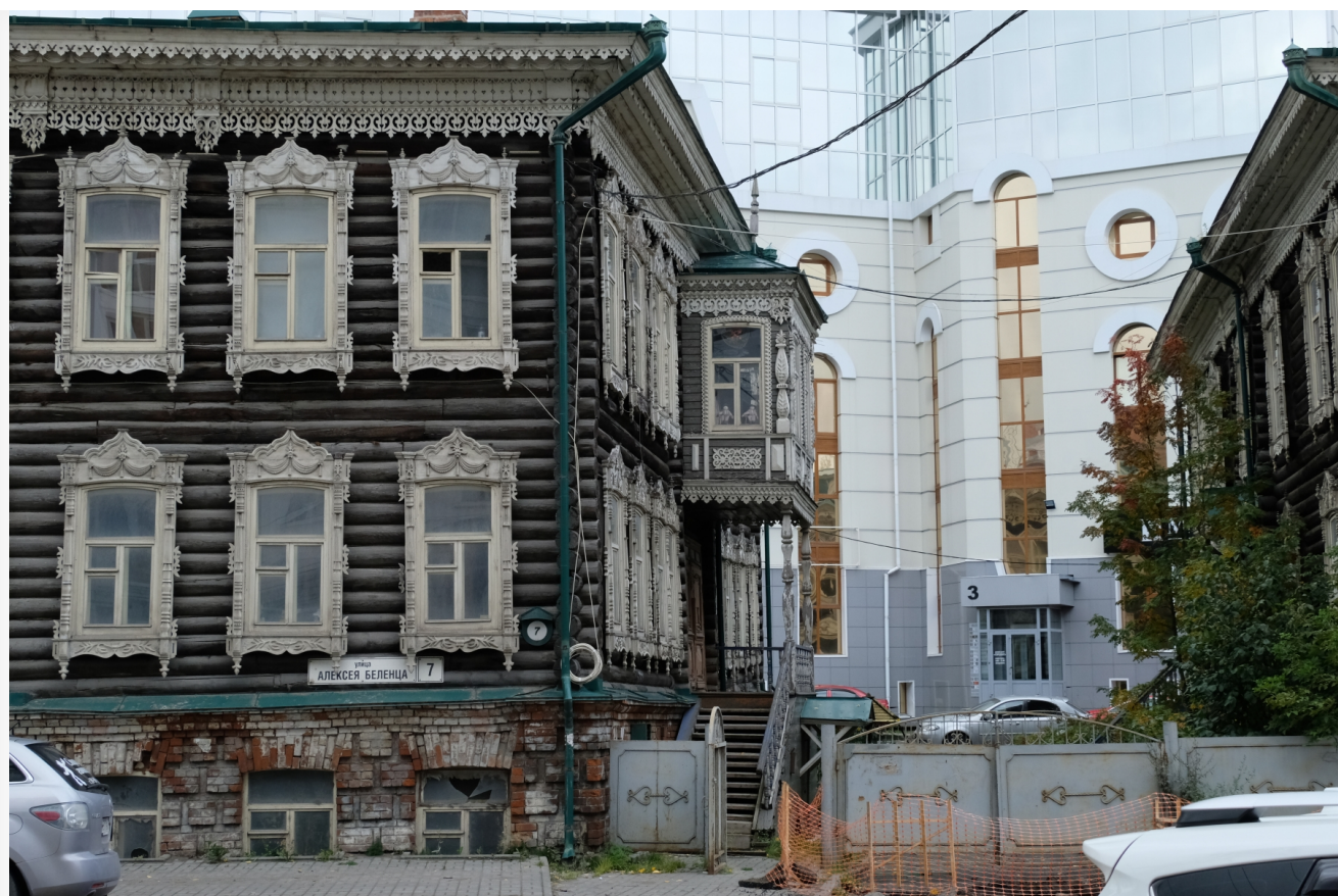
Автор: Алёна Штерн Фото из альбома "Томск. Старый город" © Фотобанк "RuBabr"

22 июля случилось утверждение проекта исторических границ Томска. Случилось, отметим, несмотря на многочисленные попытки местных властей не допустить этого. Невольно возникает вопрос: а что дальше? Неужели наконец-то старинные здания перестанут гореть и незаконно сносятся?