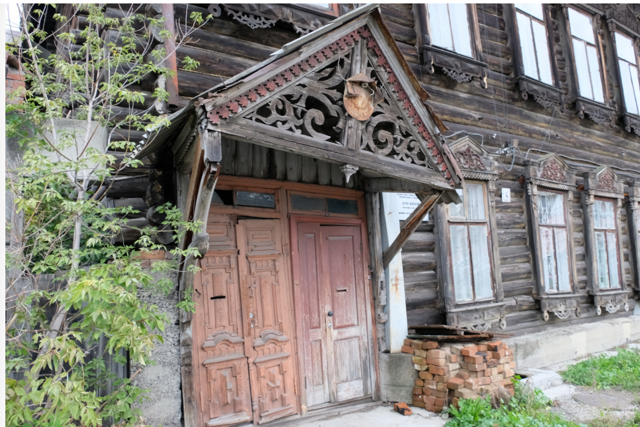
Фото из альбома "Томск. Старый город"