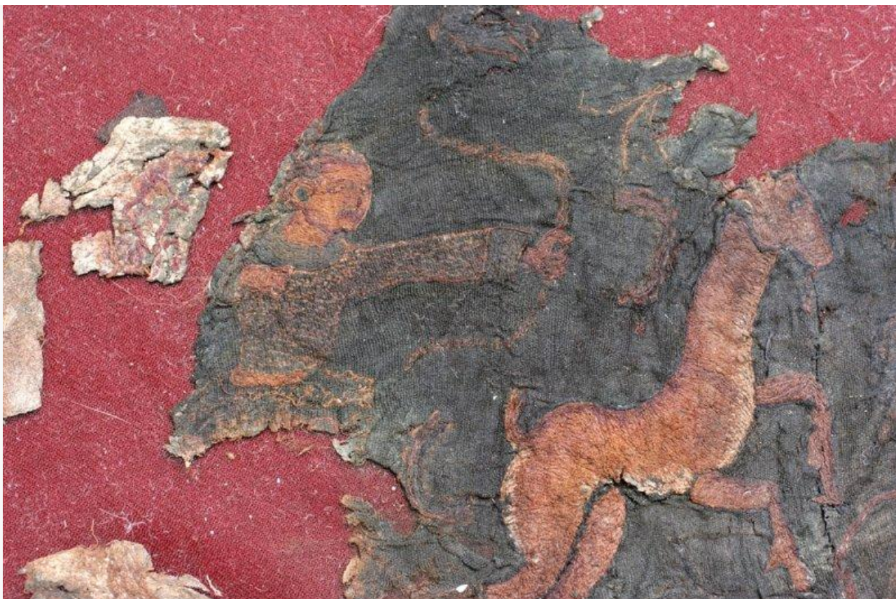
Фрагмент одежды с изображением сцены охоты

Ученые уверены, что более детальный и технологичный подход к исследованию данных артефактов станет ключом к пониманию того, как древний народ, обитавший здесь на рубеже эр, влиял на культурный обмен на территории от Римской империи до Китая эпохи Хань. Поспособствовать этому должна совместная российско-монгольская программа «Междисциплинарное исследование коллекции текстиля из Ноин-улинских курганов».