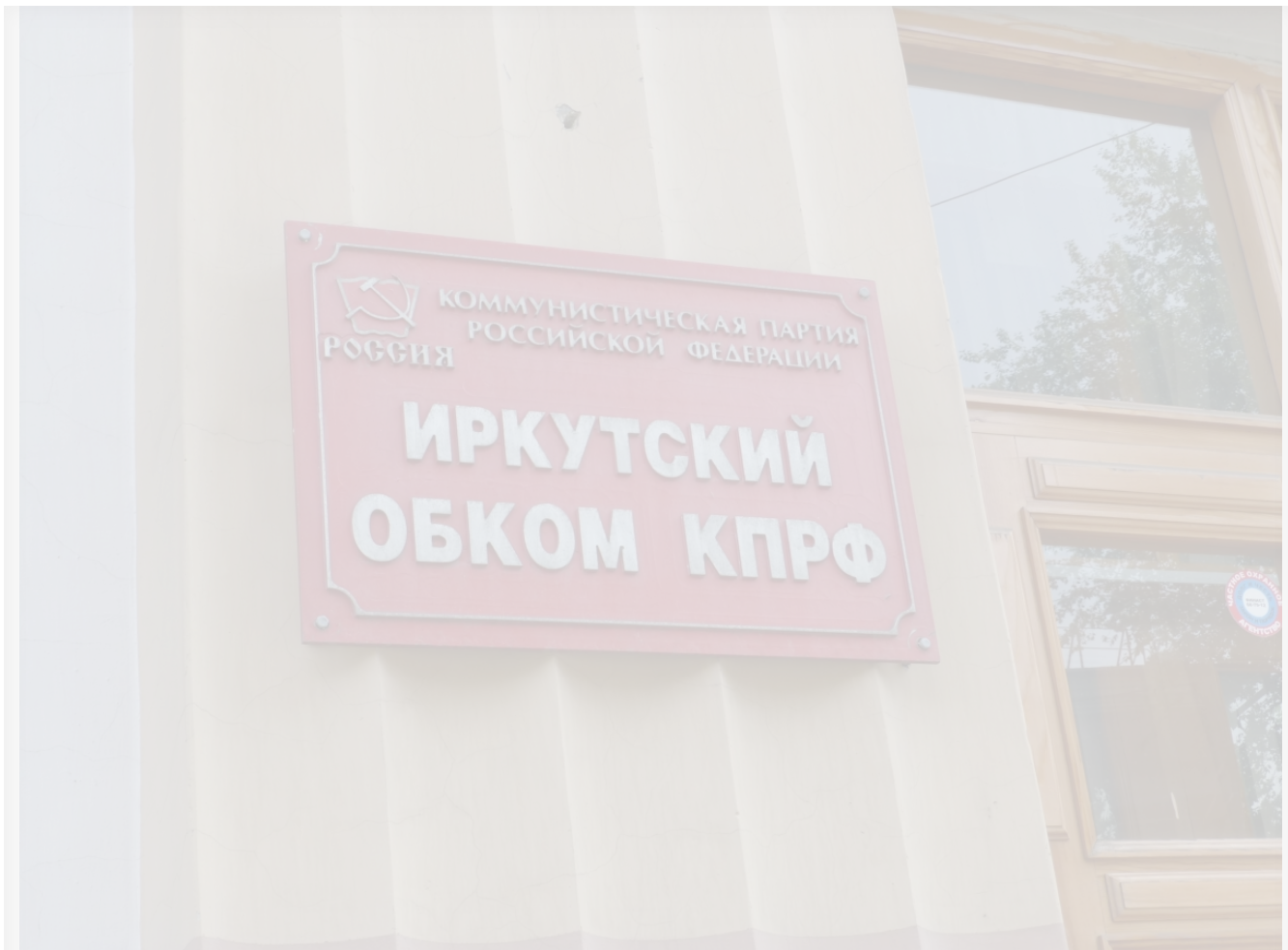
Автор: Даниил Тетерин Фото из альбома "Иркутск. Политика" © Фотобанк "RuBabr"

Прошедшая неделя ознаменовалась чередой партийных конференций по выдвижению кандидатов на осенние выборы. В очередной раз КПРФ привлекла внимание откровенной слабостью предвыборных раскладов.