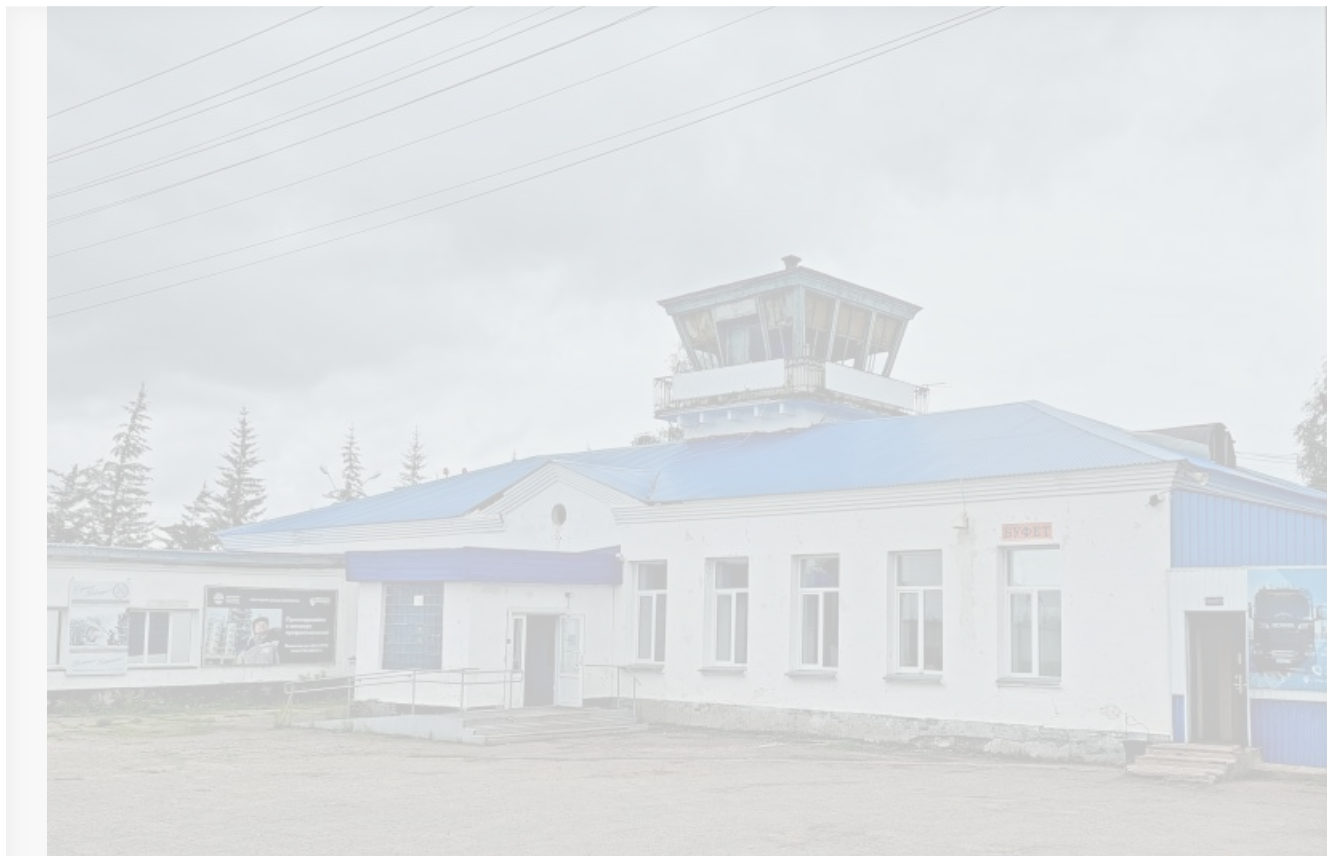
Здание аэропорта `Усть-Кут`

Обратная история разворачивается сегодня в Усть-Кутском районе. Там по соглашению, заключенному между правительством региона и частным авиаперевозчиком «ЮТэйр», являющимся собственником аэропорта «Усть-Кут», в скором будущем появится новый терминал аэропорта и будет модернизирована взлетно-посадочная полоса.