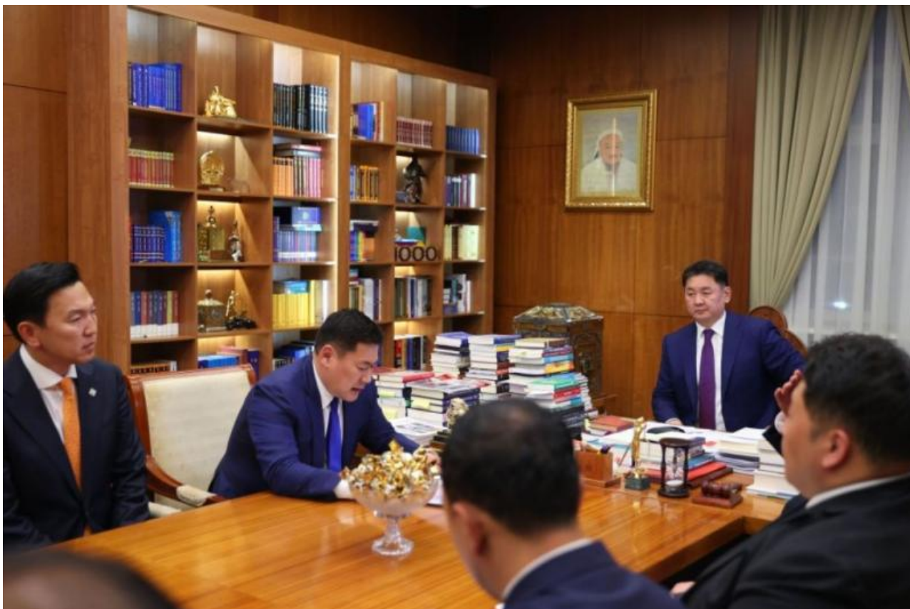
Фото: пресс-служба правительства Монголии

Автор: Денис Большаков © Babr24.com ПОЛИТИКА, ОБЩЕСТВО, МОНГОЛИЯ 18207 10.07.2024, 15:26 181