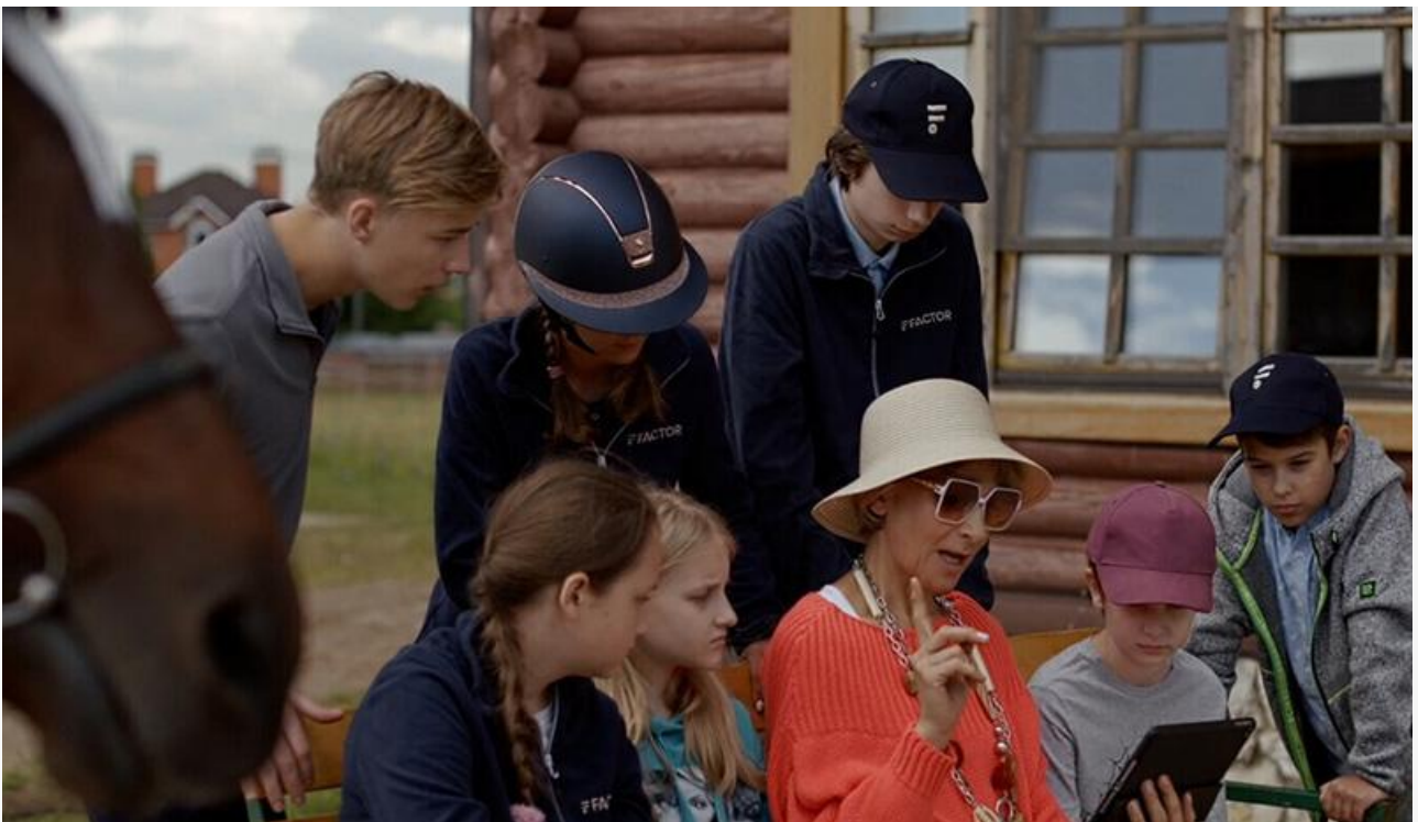
Кадр из фильма «Мой любимый чемпион»

Лидерство в прокате без каких-либо проблем сохранил мультфильм «Три богатыря. Ни дня без подвига» , на 2 203 экранах пополнивший копилку на 39,4 миллиона. Потери в сборах по сравнению с предыдущим уикендом составили 37 %.