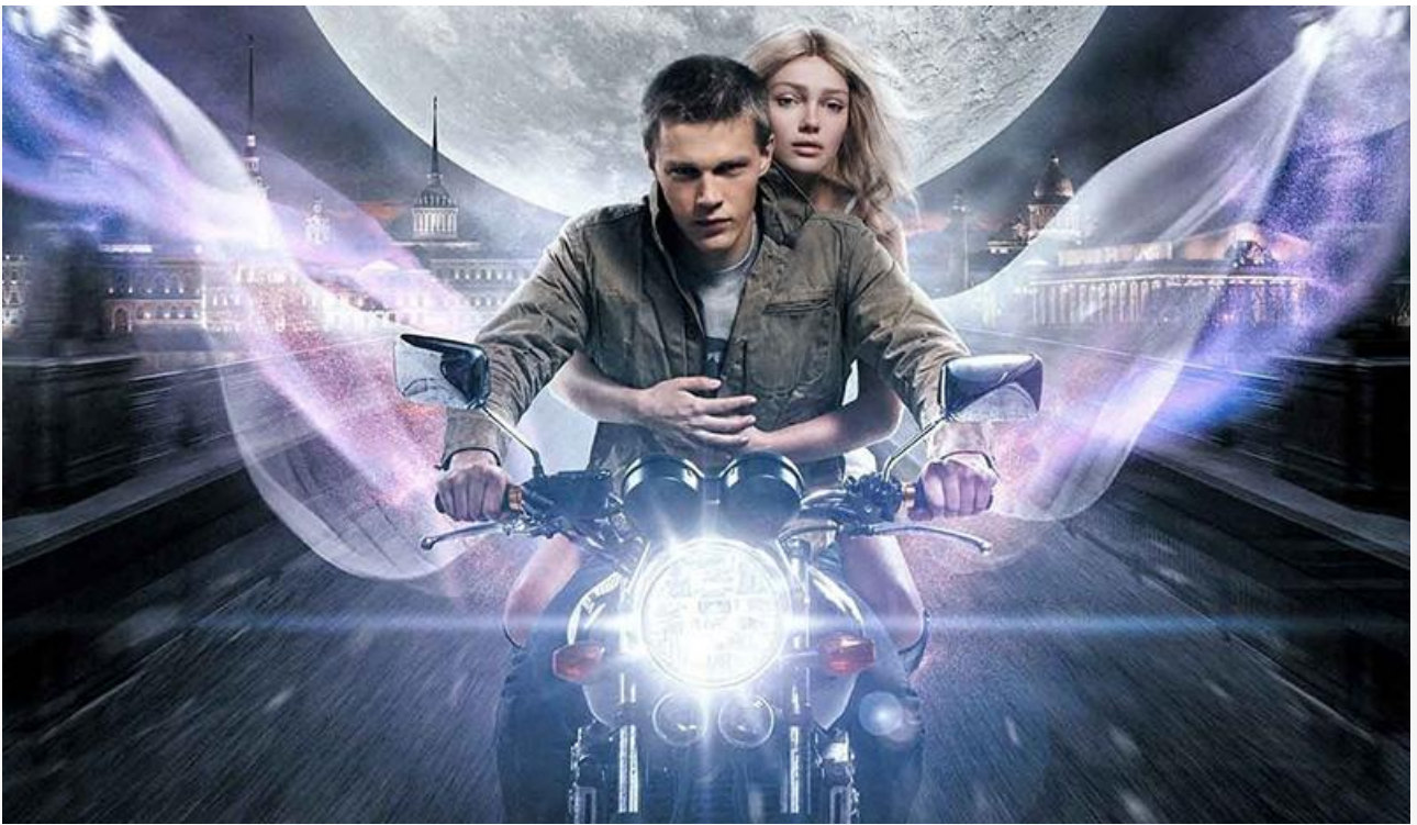
Постер к фильму «Самая большая луна»

Неплохие шансы на попадание в топ-10 у американо-германского триллера Джордан Скотт «Город страха» (18+) с Эриком Баной, Сэди Синк и Сильвией Хукс и американского триллера на выживание с элементами фильма ужасов «Ханна. В игре» от Джеймса Крока.