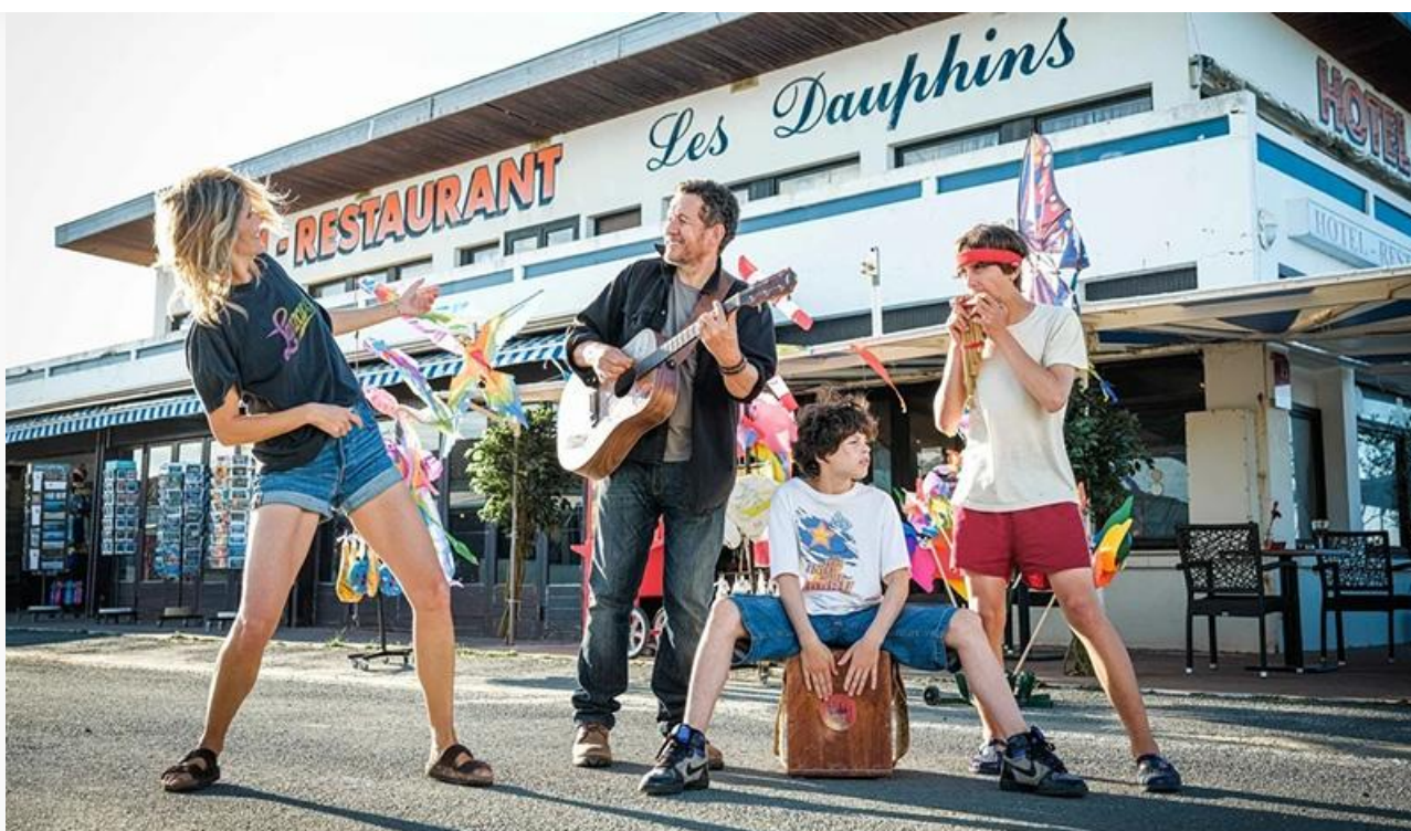
Кадр из фильма «Развесёлые каникулы»