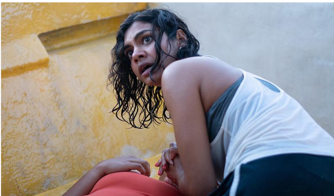
Кадр из фильма «Челюсти. Кровавый риф»