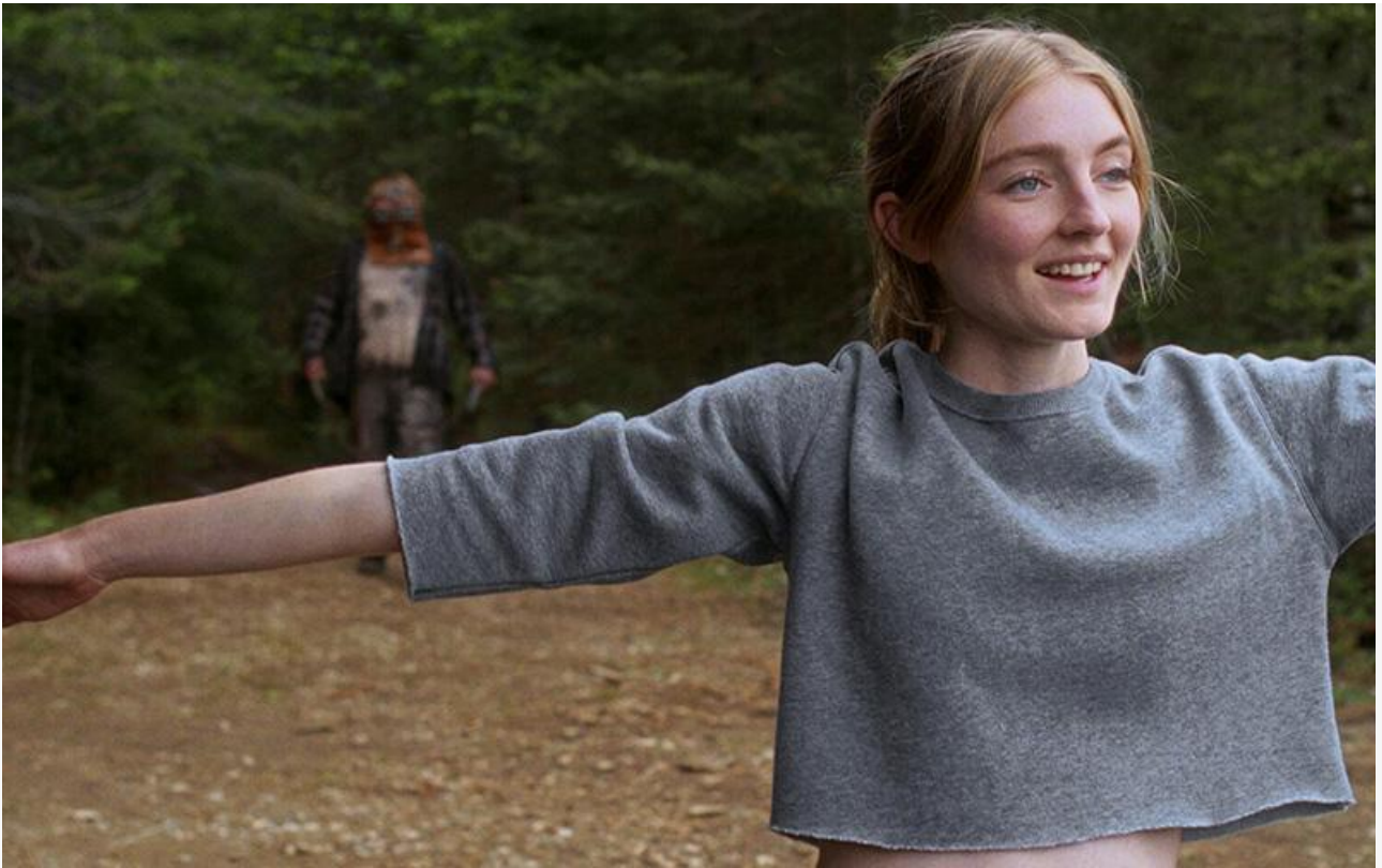
Кадр из фильма «Нежить»

На подростковую аудиторию рассчитано американское фэнтези Зака Уорда « Хранители пяти королевств ».