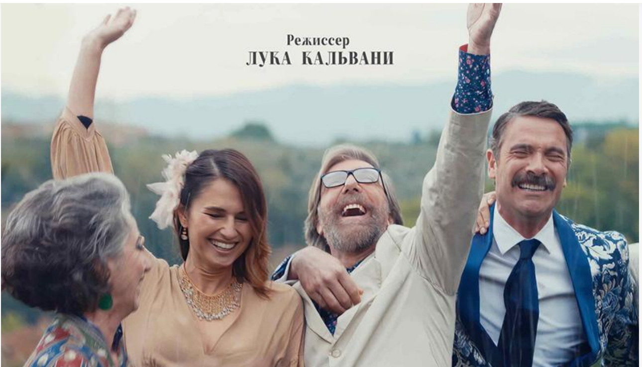
Постер к фильму «Из Тосканы с любовью»