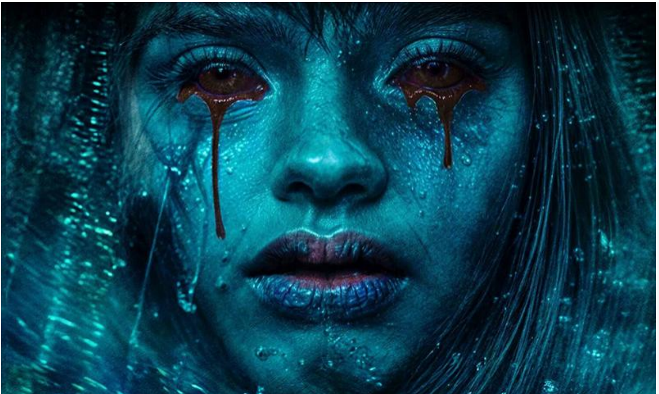
Постер к фильму «Паранормальное. Маяк»