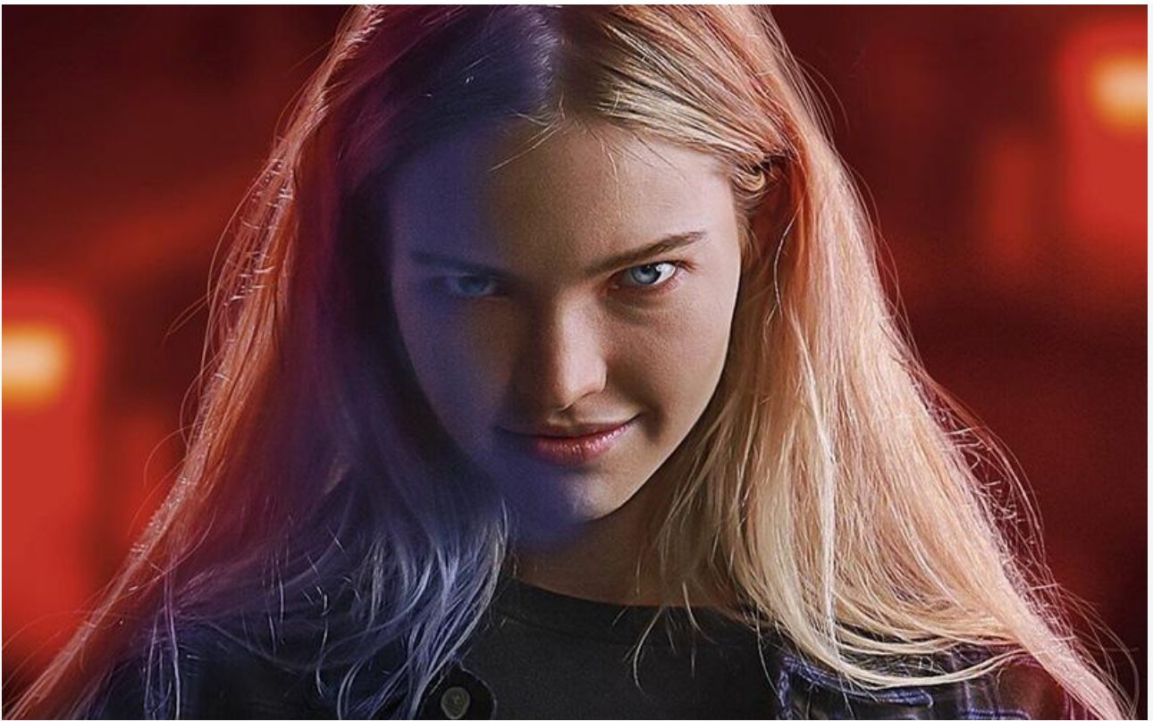
Постер к фильму «Ханна. В игре»