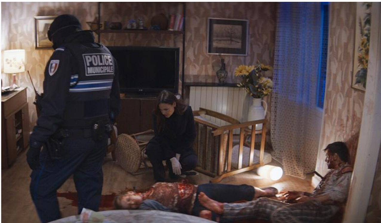
Кадр из фильма «Синистер. Пожиратель душ»

российский прокат в прошлый четверг, разжилась 351 экраном и наскребла в кассах кинотеатров 2,8 миллиона. В результате – средняя посещаемость 17,3 зрителя за сеанс и 16-е место по итогам стартового уикенда.