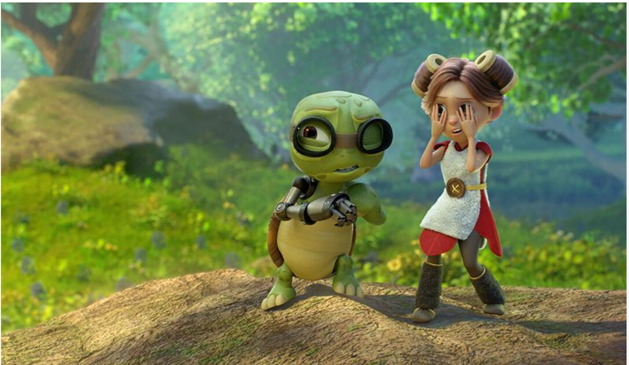
Кадр из фильма «Эмма в мире лам»