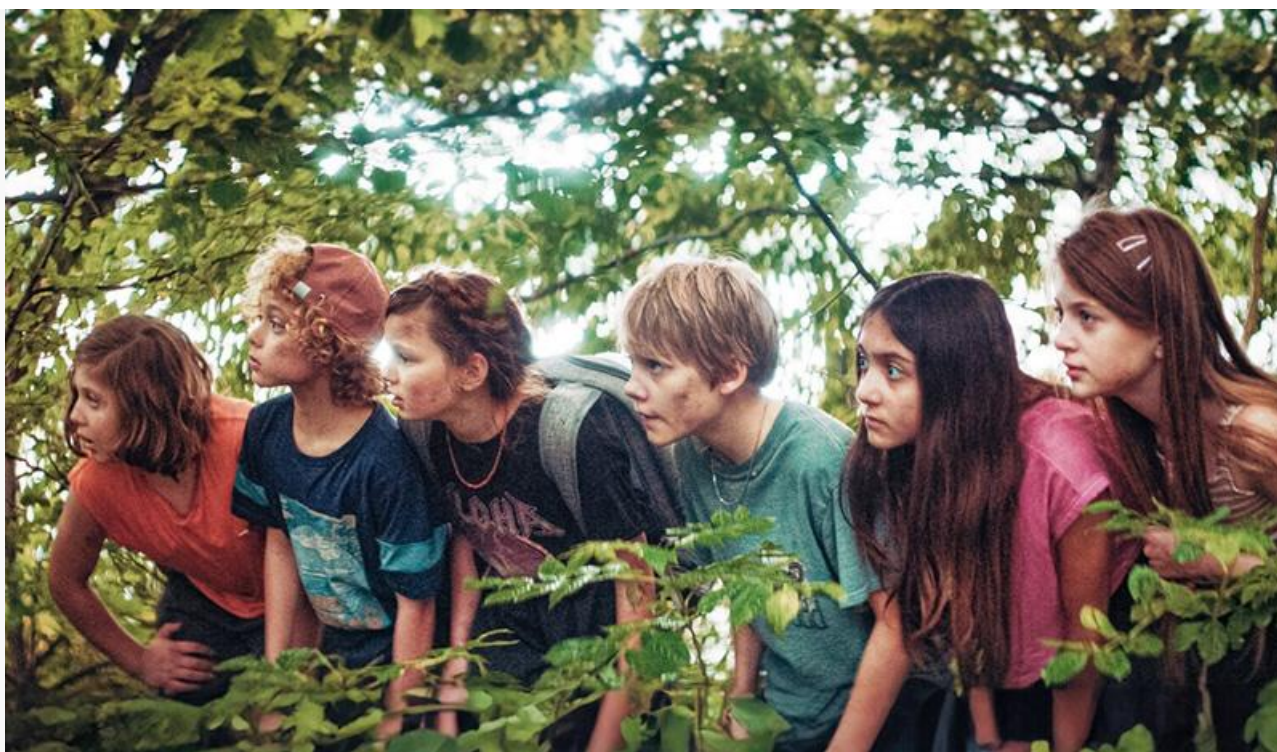
Кадр из фильма «Самая нескучная школа»