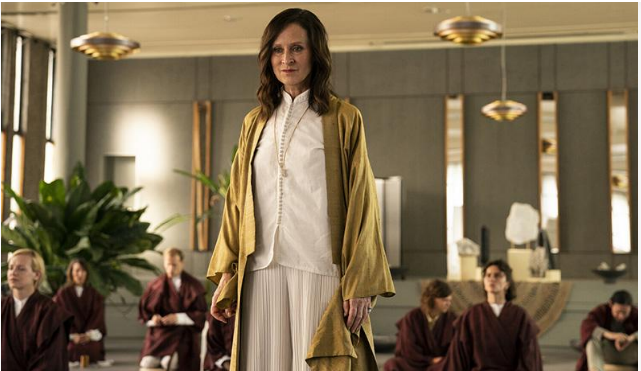
Кадр из фильма «Город страха»

Кроме того, поклонников фильмов ужасов ждут в кинотеатрах испано-аргентинский триллер Анхелес Эрнандес «Паранормальное. Маяк» (18+) и канадский хоррор Криса Нэша «Нежить» (18+).