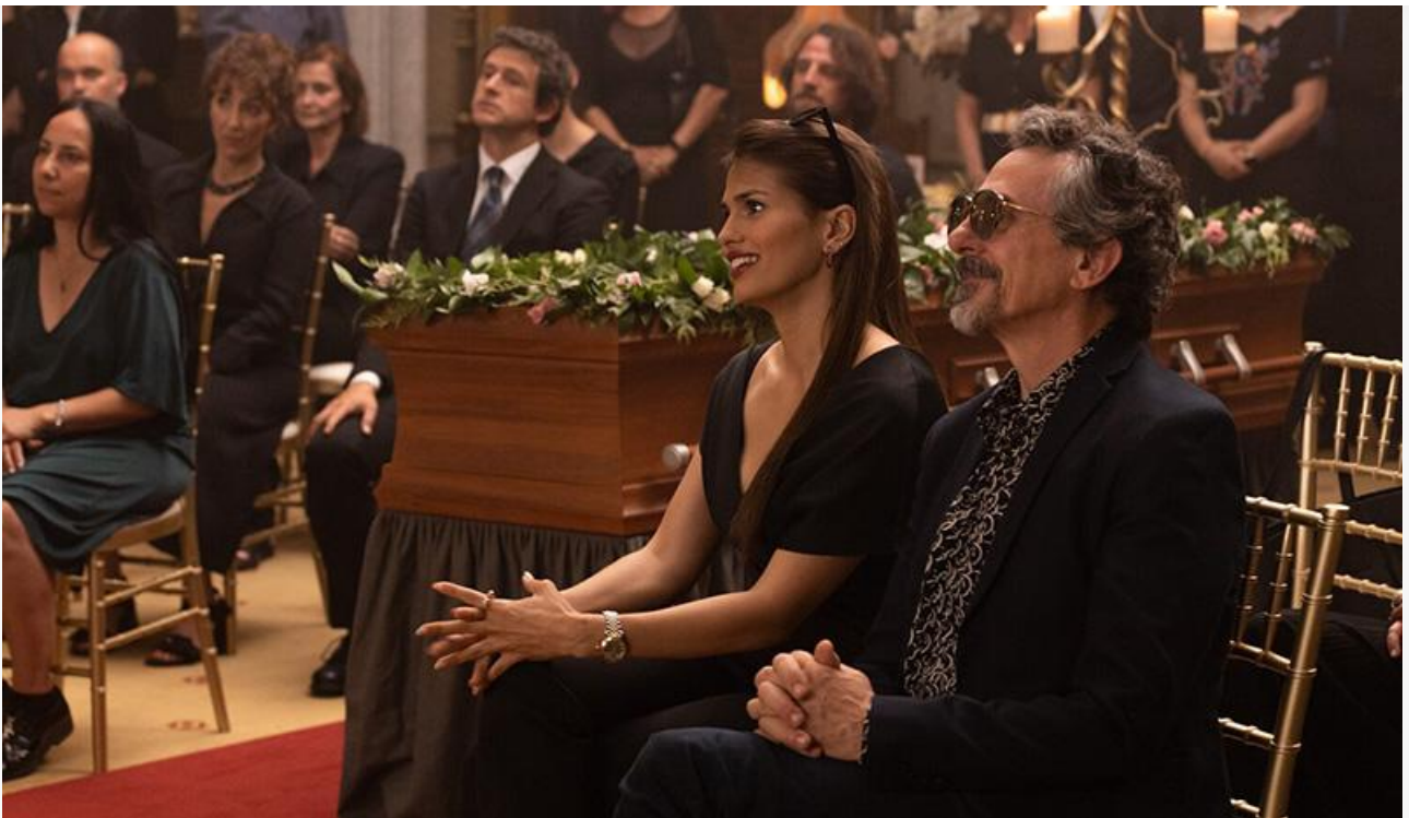
Кадр из фильма «Отчаянные наследники»