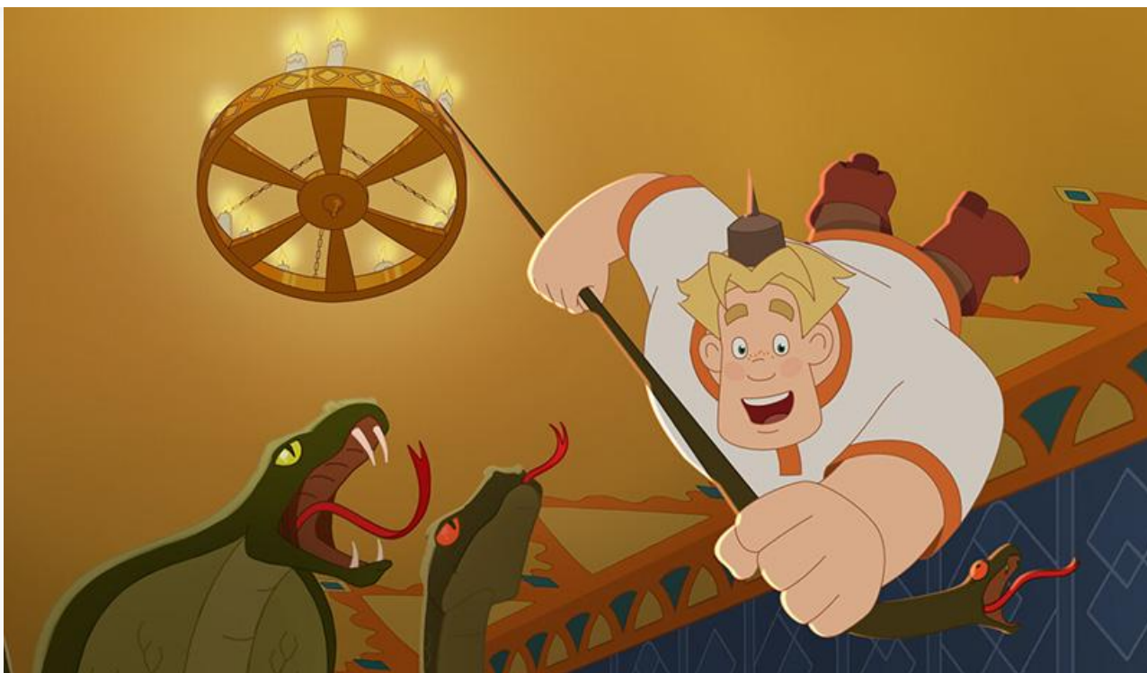
Кадр из фильма «Три богатыря. Ни дня без подвига»

На втором месте, как и неделей ранее, – музыкальная комедия Марка Горобца «Тур с Иванушками» : 2 098 экранов и 18,6 миллиона с потерей в сборах 55 %.