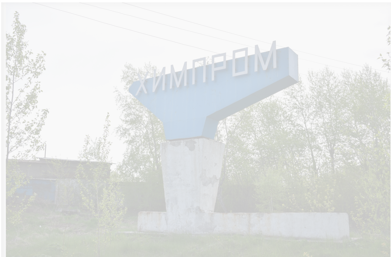
Автор: Екатерина Долинская Фото из альбома "Иркутская область. Усольский Химпром" © Фотобанк "RuBabr"

Возложение ответственности за эту работу на ФГУП «Федеральный экологический оператор», входящий в государственную корпорацию «Росатом», до сих пор не привело к желаемым результатам. Деятельность ФЭО свелась лишь к бессмысленному перекидыванию грязи из одной цистерны в другую на фоне громких заявлений о «демеркуризации» и «мониторинге». Однако сама экологическая ситуация на площадке «Усольехимпрома» продолжает оставаться в критическом состоянии.