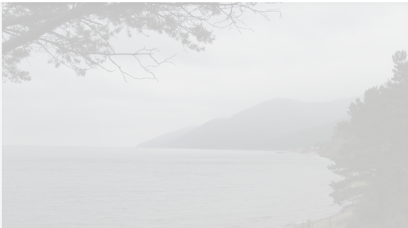
Автор: Екатерина Долинская Фото из альбома "Байкал. Виды - лето" © Фотобанк "RuBabr"

Кроме того, РАН требует научно обеспечить меры по экологически безопасному развитию производств и инфраструктуры в российско-монгольском трансграничном бассейне реки Селенга. Совместно с монгольскими коллегами необходимо провести стратегическую экологическую оценку влияния строительства гидроэнергетических объектов на Байкал.