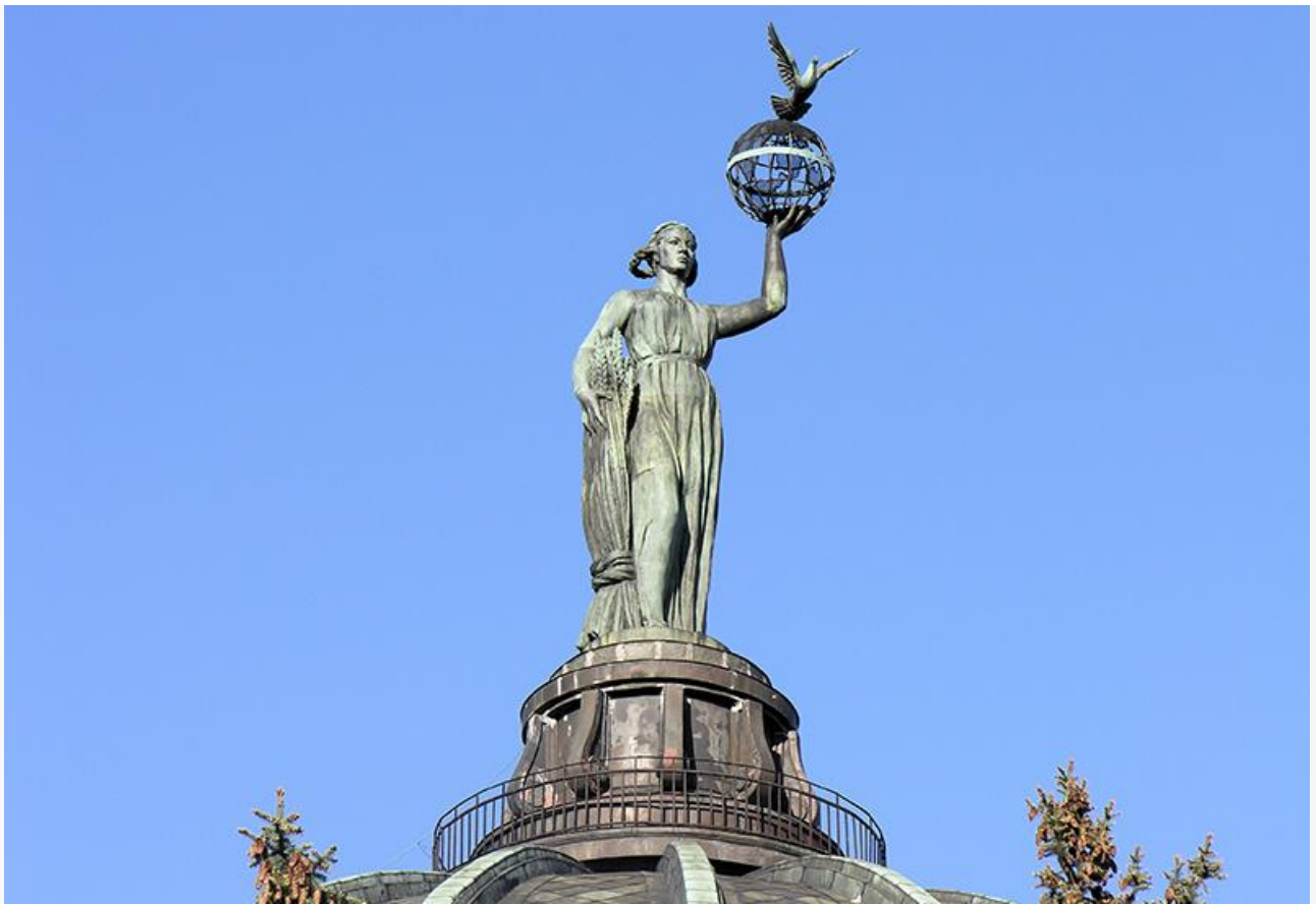
«Мир», 1953 год. Последняя работа скульптора. Установлена на куполе Волгоградского планетария