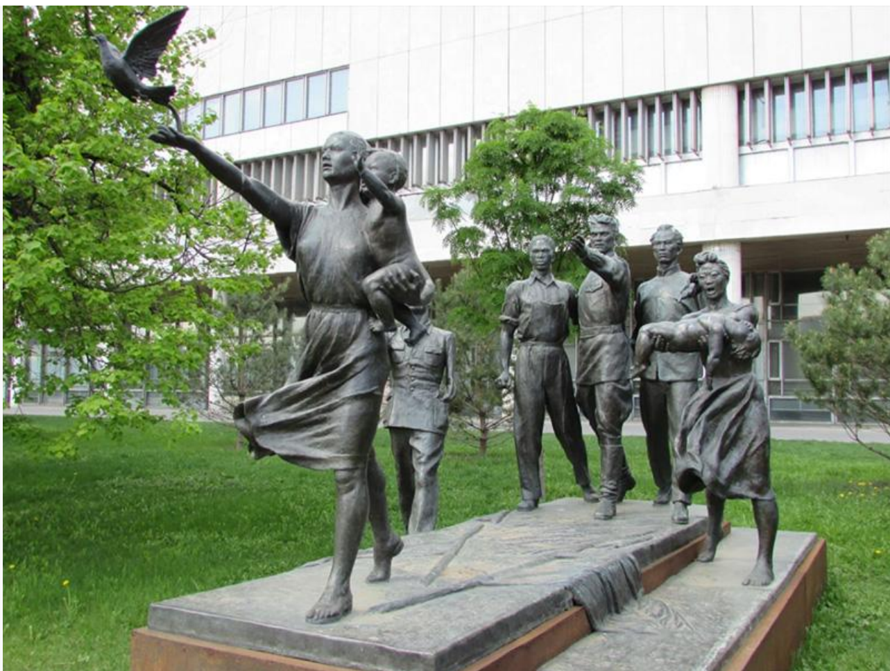
«Требуем мира!», 1950 год. Установлена в 1960 году на проспекте Мира в Москве, сейчас – в парке «Музеон» в Москве