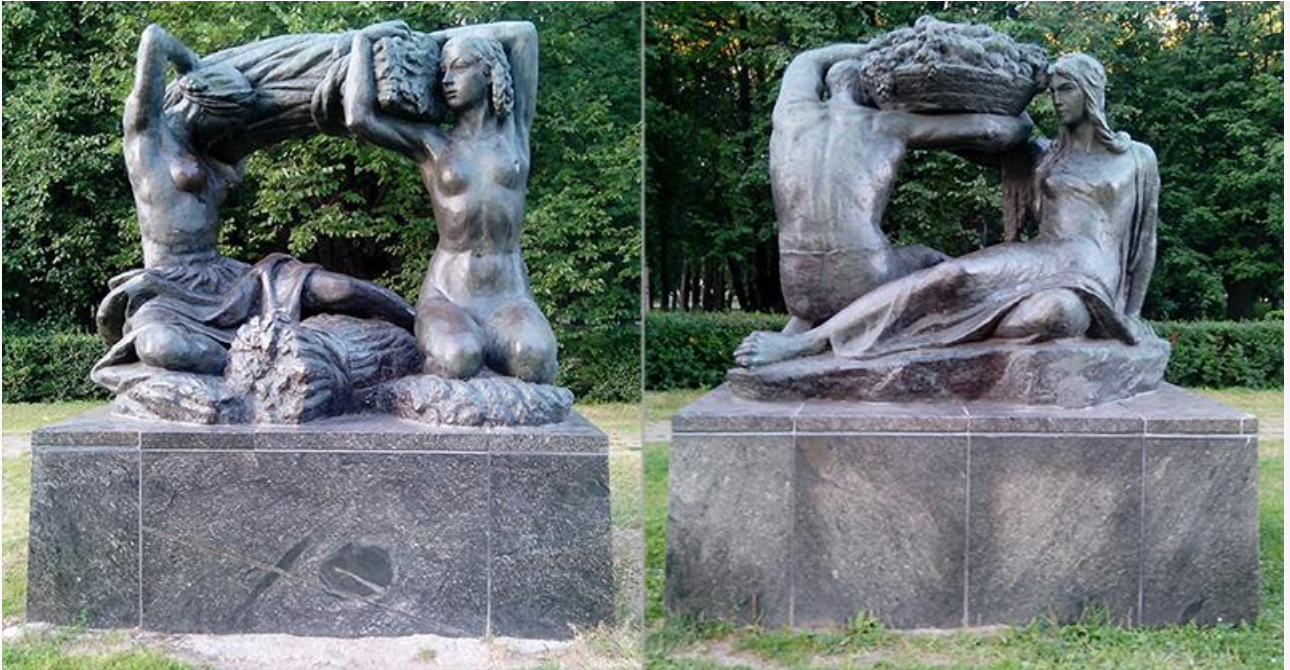
«Хлеб» и «Плодородие», 1963 год. Созданы после смерти Мухиной по эскизам скульптур для Москворецкого моста. Установлены в Парке Дружбы возле Речного вокзала Москвы