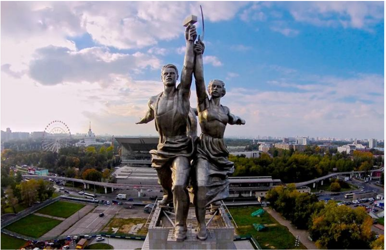
«Рабочий и колхозница», 1936 год. Скульптурная группа для Советского павильона на Международной выставке в Париже. Установлена на павильоне-постаменте высотой 34,5 метра у Северного входа на ВДНХ в Москве. Внутри постамента функционирует музей Веры Мухиной