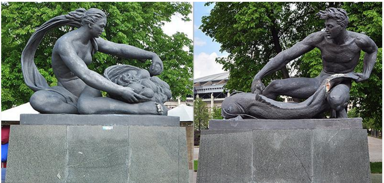
«Земля» и «Вода», 1957 год. Созданы после смерти Мухиной по эскизам скульптур для Москворецкого моста. Установлены на Фестивальной площади Москвы