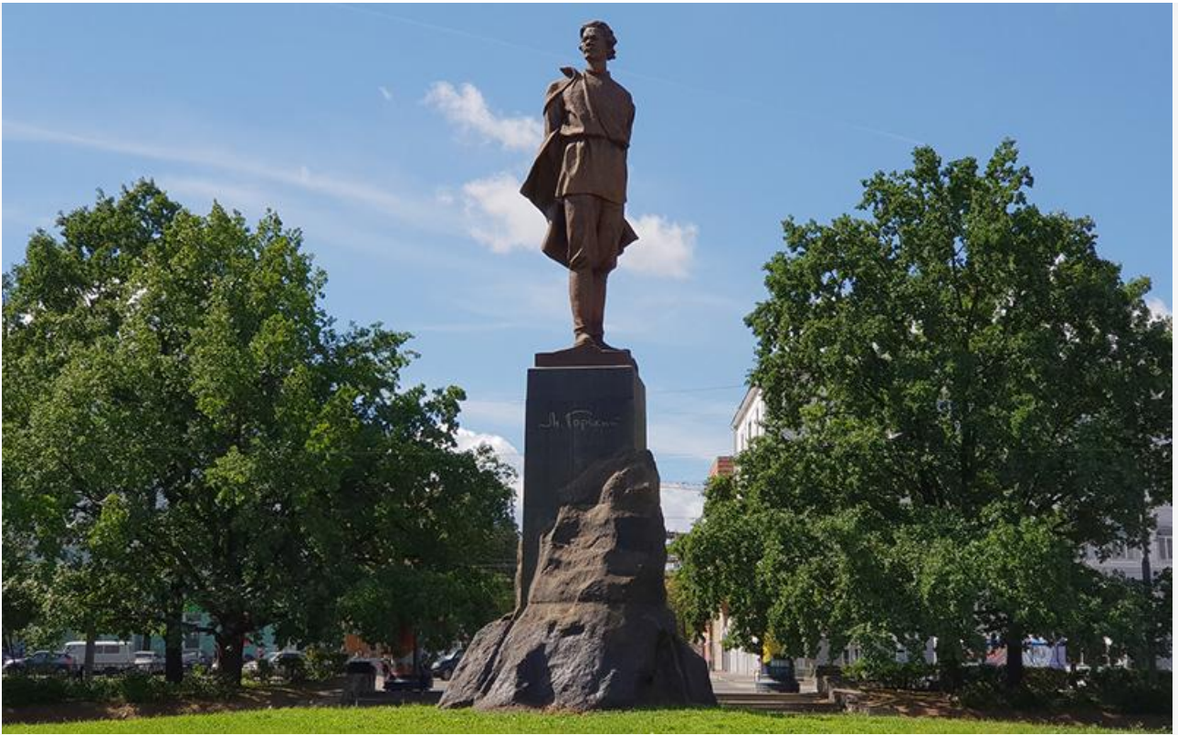
Памятник Максиму Горькому, 1952 год. Установлен в Нижнем Новгороде на площади Горького