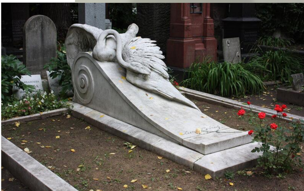
«Умирающий лебедь», 1941 год. Надгробный памятник Леониду Собинову на Новодевичьем кладбище