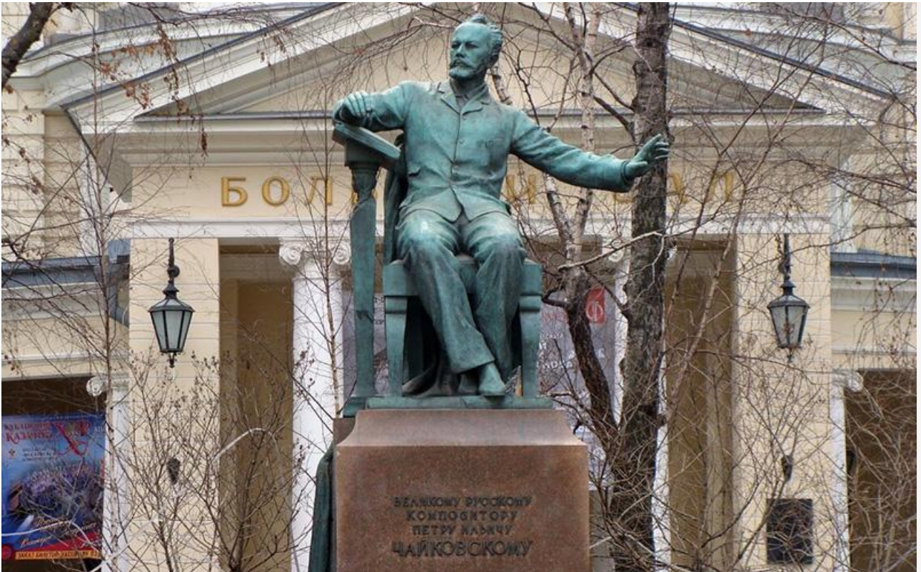
Памятник П. И. Чайковскому, 1944-1947 годы. Установлен после смерти скульптора перед Московской государственной