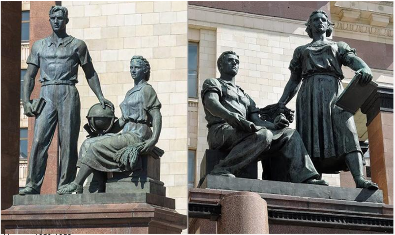
«Наука», 1950-1952 годы. Скульптурные группы установлены перед зданием МГУ