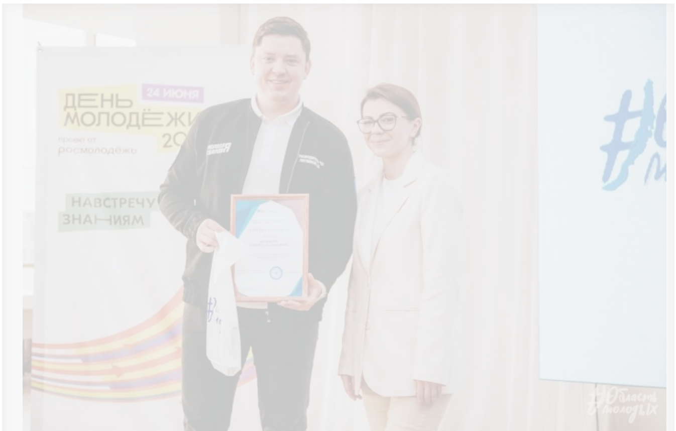
Юные «звезды» иркутской политики: министр Цыганова и депутат Литвинов

По всей стране отгремел День молодежи. Делаем пусть и запоздалый реверанс этому празднику и вспоминаем про самого яркого представителя молодежной политики региона. И речь вовсе не о министре ведомства, курирующего это направление, Маргарите Цыгановой. Речь о целом депутате Заксобрания региона – двадцатипятилетнем единороссе Данииле Литвинове.