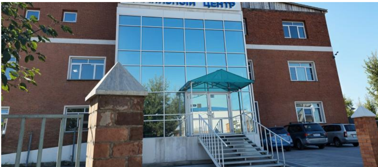
Диализный центр Vita, принадлежащий ООО «Здоровье»

по утилизации ТКО, которые также образуются в результате деятельности фирмы. «Здоровье» уклоняется от оплаты за услуги, которые фактически были оказаны регоператором.