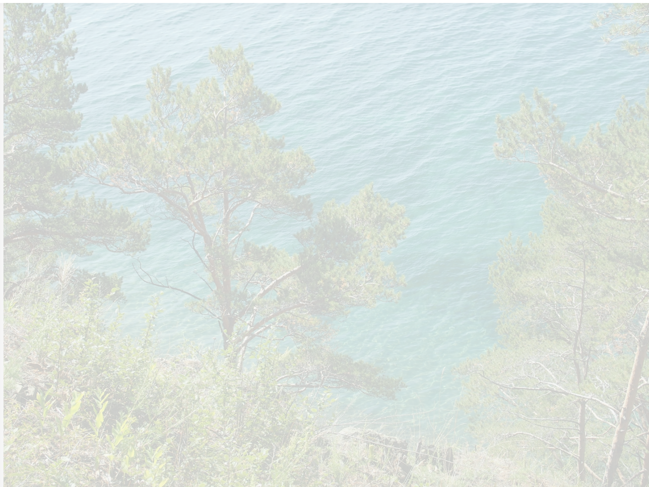
Автор: Екатерина Долинская Фото из альбома "Байкал. Виды - лето" © Фотобанк "RuBabr"

24 июня 2024 года ведущие российские ученые и экологи направили обращение в Госдуму с просьбой не принимать этот законопроект в текущей редакции, так как он создает риски существенного ухудшения состояния озера Байкал и противоречит российскому законодательству и международным обязательствам страны.