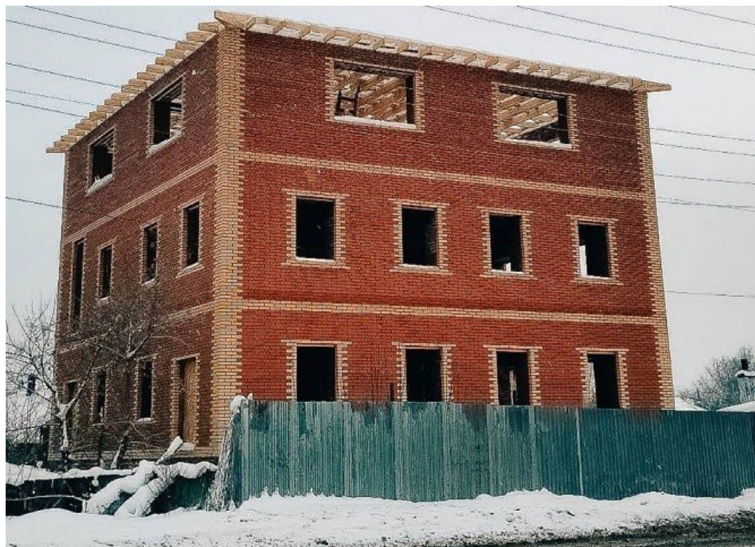
Фото: Бабр, мэрия Томска

Автор: Андрей Игнатъев © Babr24.com КУЛЬТУРА, ИСТОРИЯ, ТОМСК 👁 36147 26.06.2024, 11:08 📄 204 URL: https://babr24.com/?IDE=261681 Bytes: 3109 / 2823 Версия для печати Скачать PDF