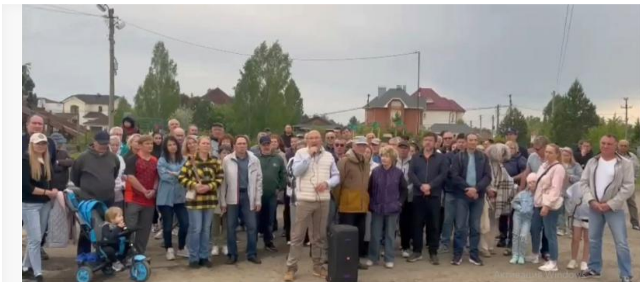
Сход жителей поселка Молодежный

Настоящий социальный взрыв разразился в известном поселке на Байкальском тракте. Собственники жилья, отчаявшись от непрерывных судов и прокурорских исков, надеются только на защиту генерала юстиции Александра Бастрыкина. На сходе они сделали видеообращение председателю Следственного комитета России .