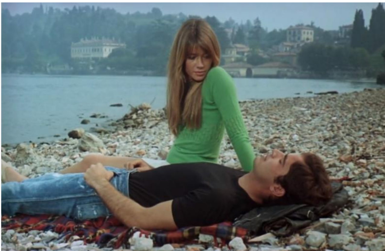
Лиза в фильме Большой приз (1966 год)

В 1988 году певица объявила о прекращении музыкальной карьеры, однако спустя восемь лет Франсуаза выпустила альбом Le Danger. С 2000 года по 2012 год певица выпустила четыре сольных альбома. В 2006 году Франсуаза выпустила альбом дуэтов с известными французскими исполнителями и получила медаль французского шансона, учреждённую Французской академией.