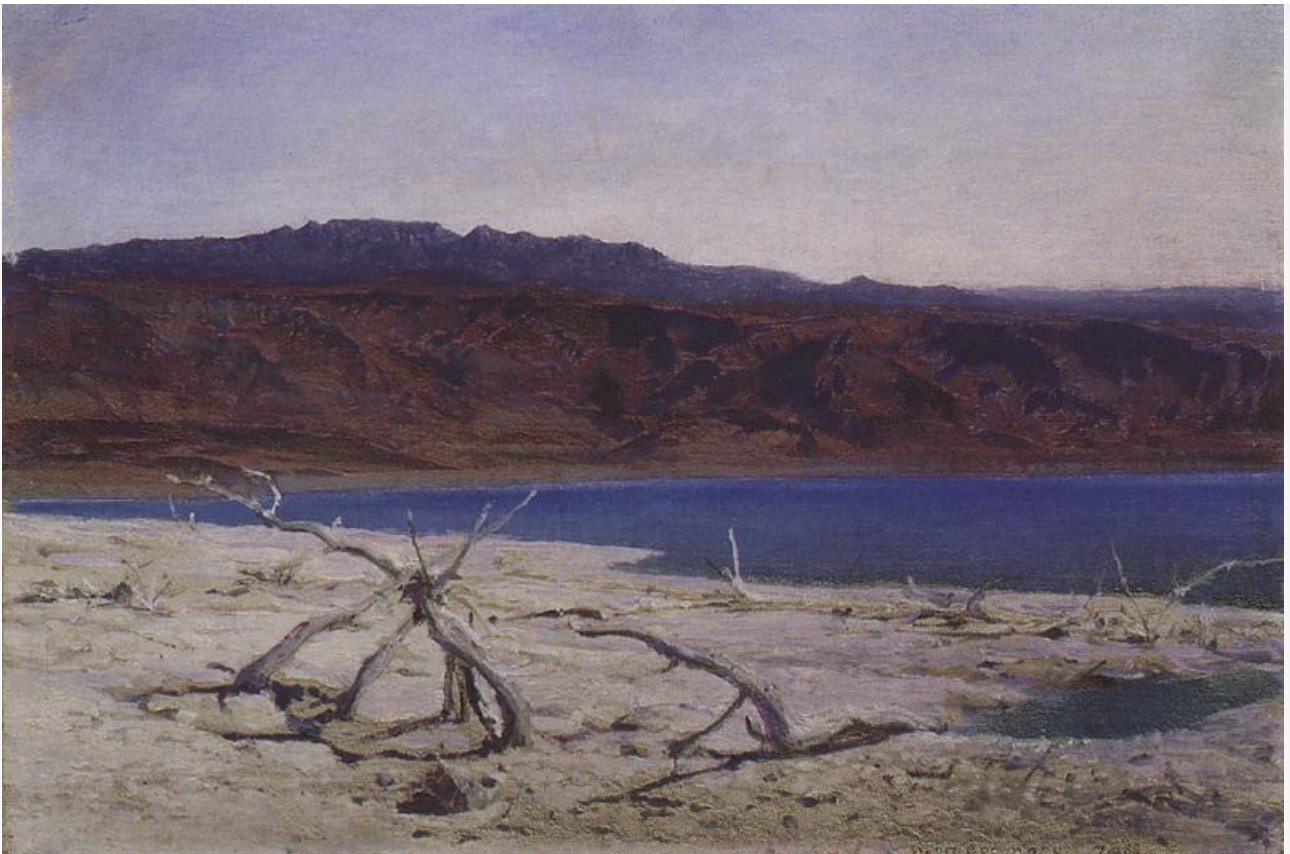
Мёртвое море, 1882. Хранится в Краснодарском художественном музее