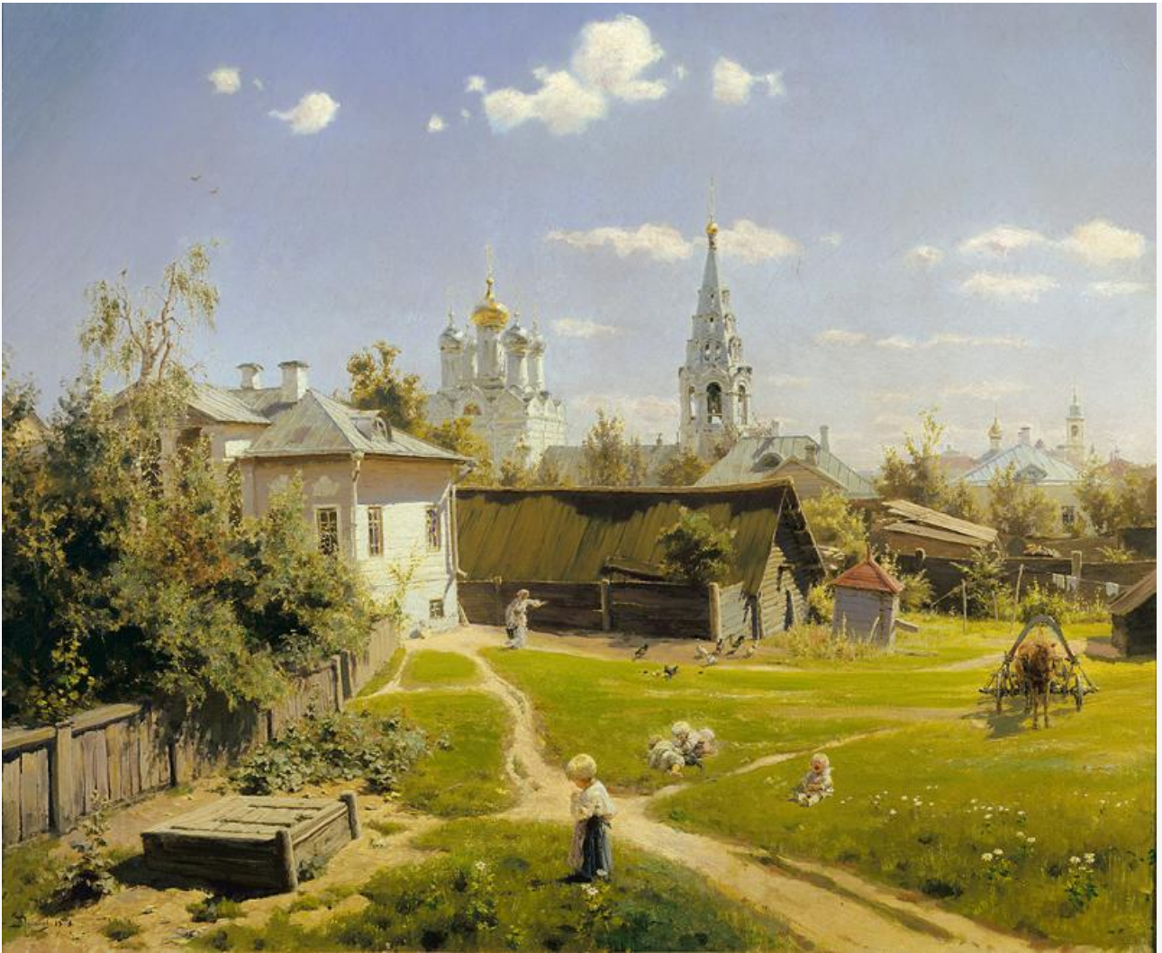
Московский дворик, 1878. Хранится в Третьяковской галерее