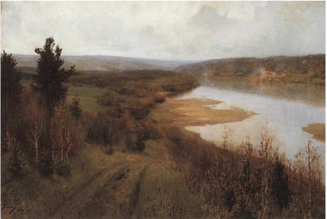
Стынет. Осень на Оке близ Тарусы, 1893. Хранится в частной коллекции