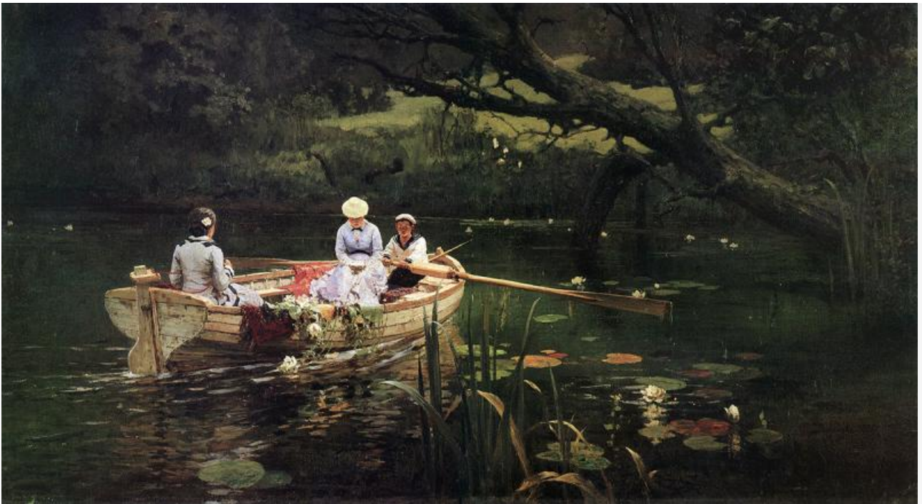
На лодке. Абрамцево, 1880. Хранится в Киевской картинной галерее