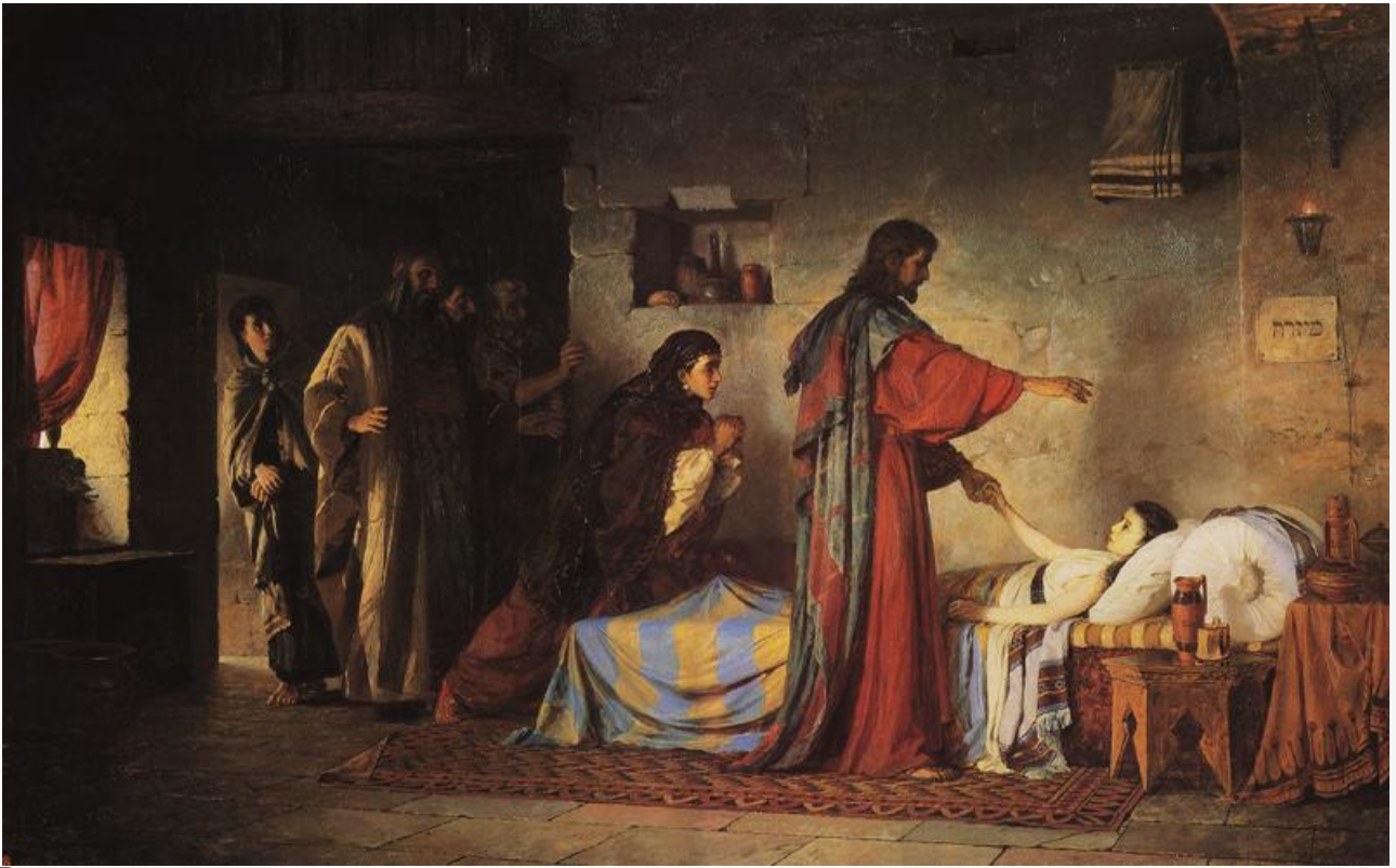
Воскрешение дочери Иаира, 1871. Хранится в Государственном русском музее