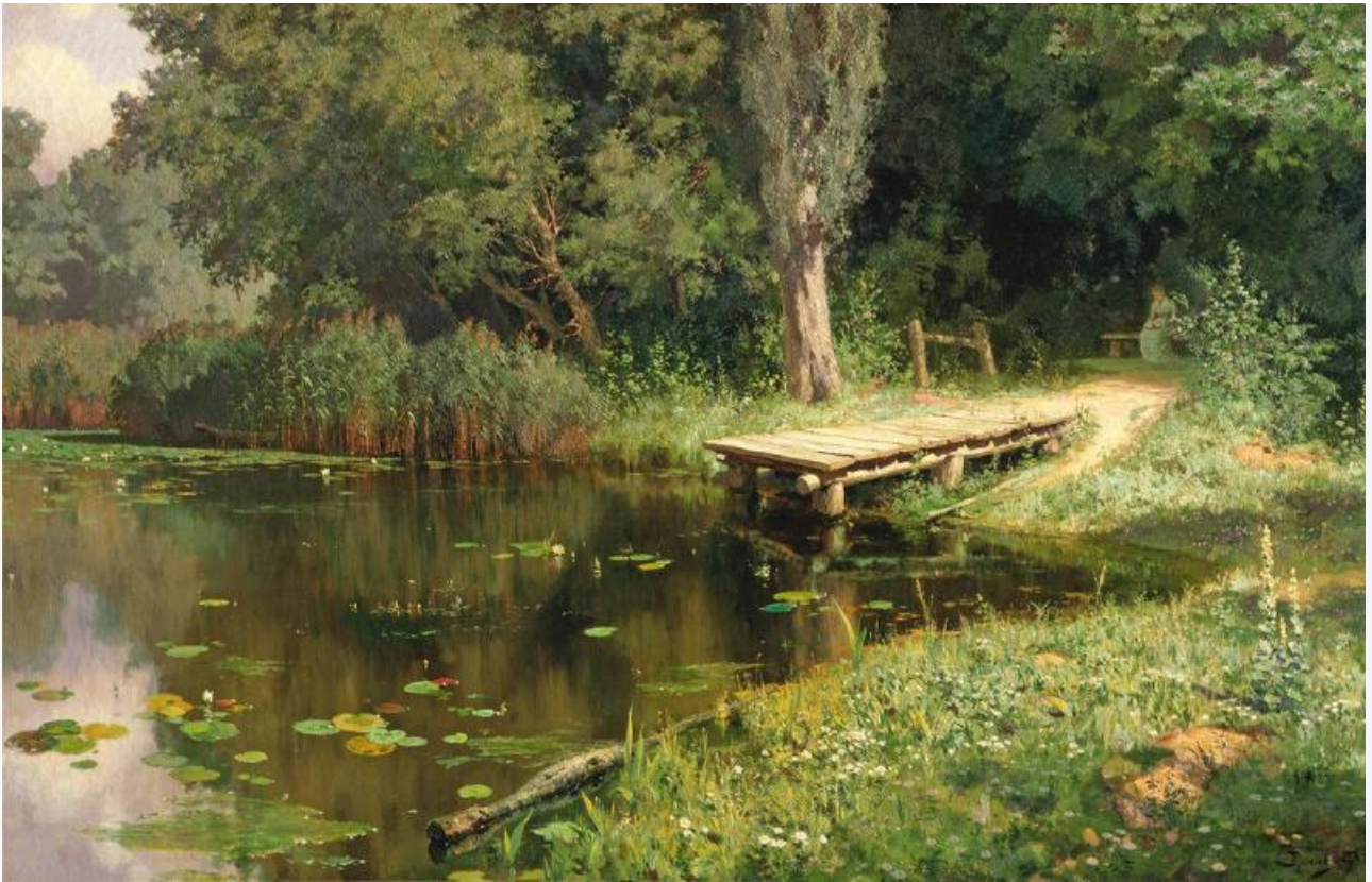
Заросший пруд, 1879. Хранится в Третьяковской галерее