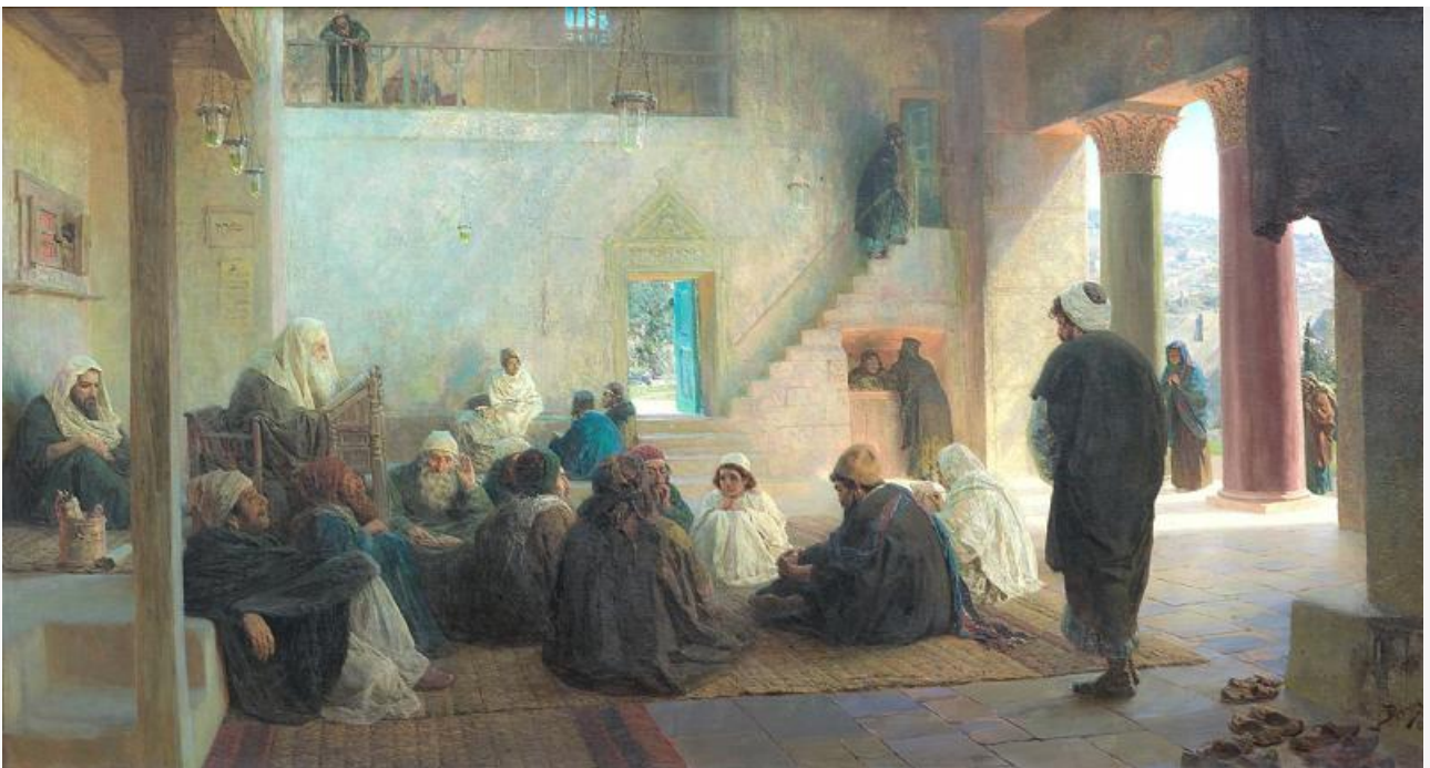
Среди учителей, 1896. Хранится в Третьяковской галерее