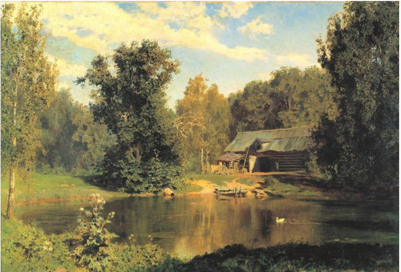
Пруд в Абрамцеве, 1883. Хранится в Третьяковской галерее