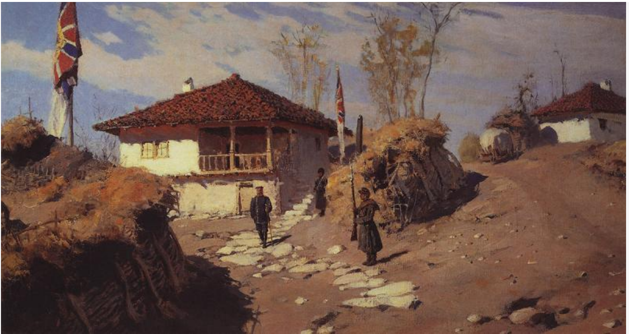
Главная квартира командующего Руцукским отрядом в Брестовце, 1883. Хранится в Государственном русском музее