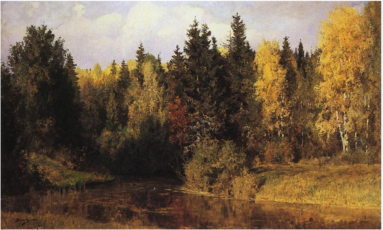
Осень в Абрамцеве, 1890. Хранится в Музее-заповеднике «Поленово»