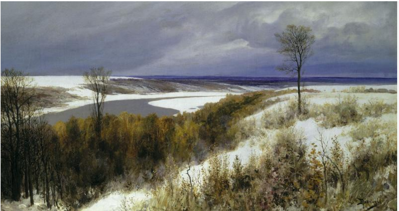
Ранний снег, 1891. Хранится в Третьяковской галерее