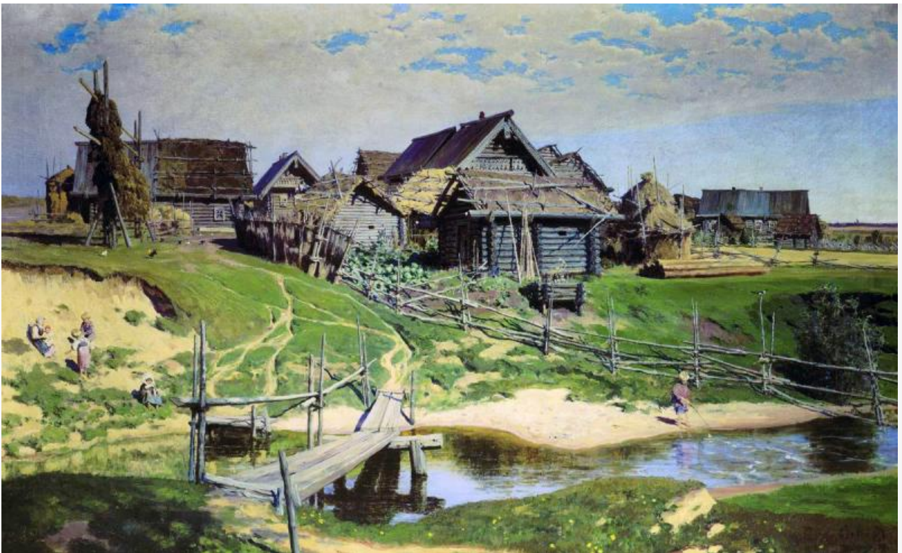
Русская деревня, 1889. Хранится в Саратовском художественном музее