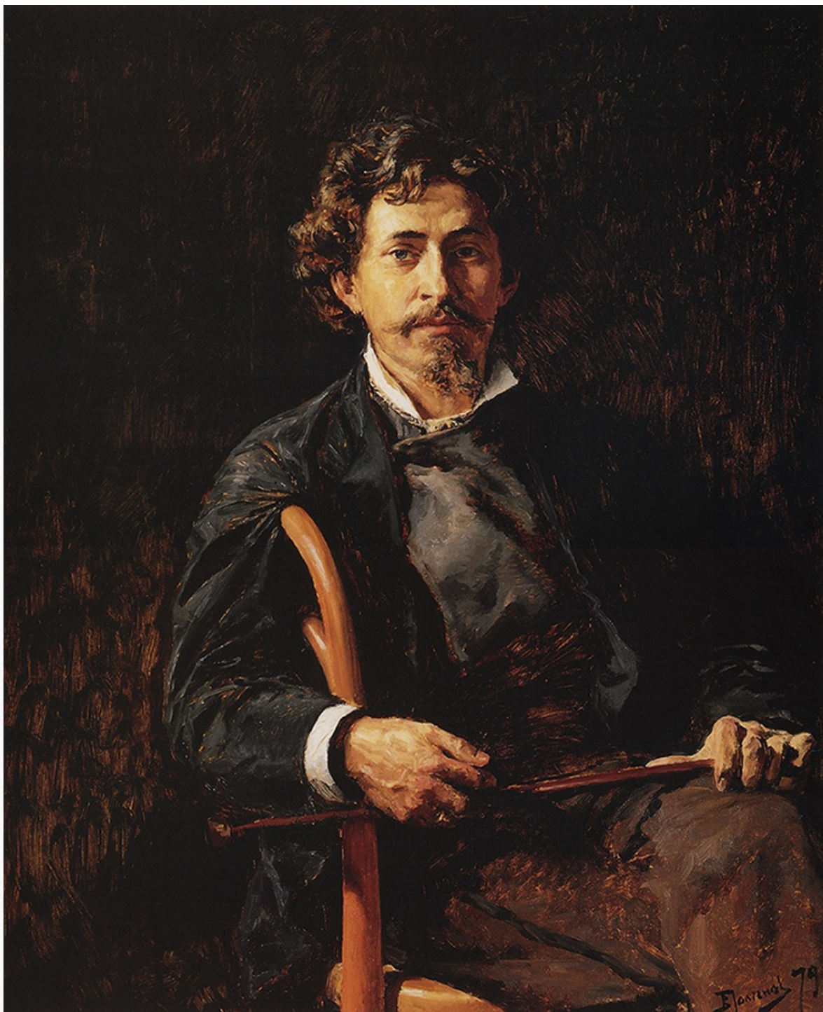
Хранится в Третьяковской галерее