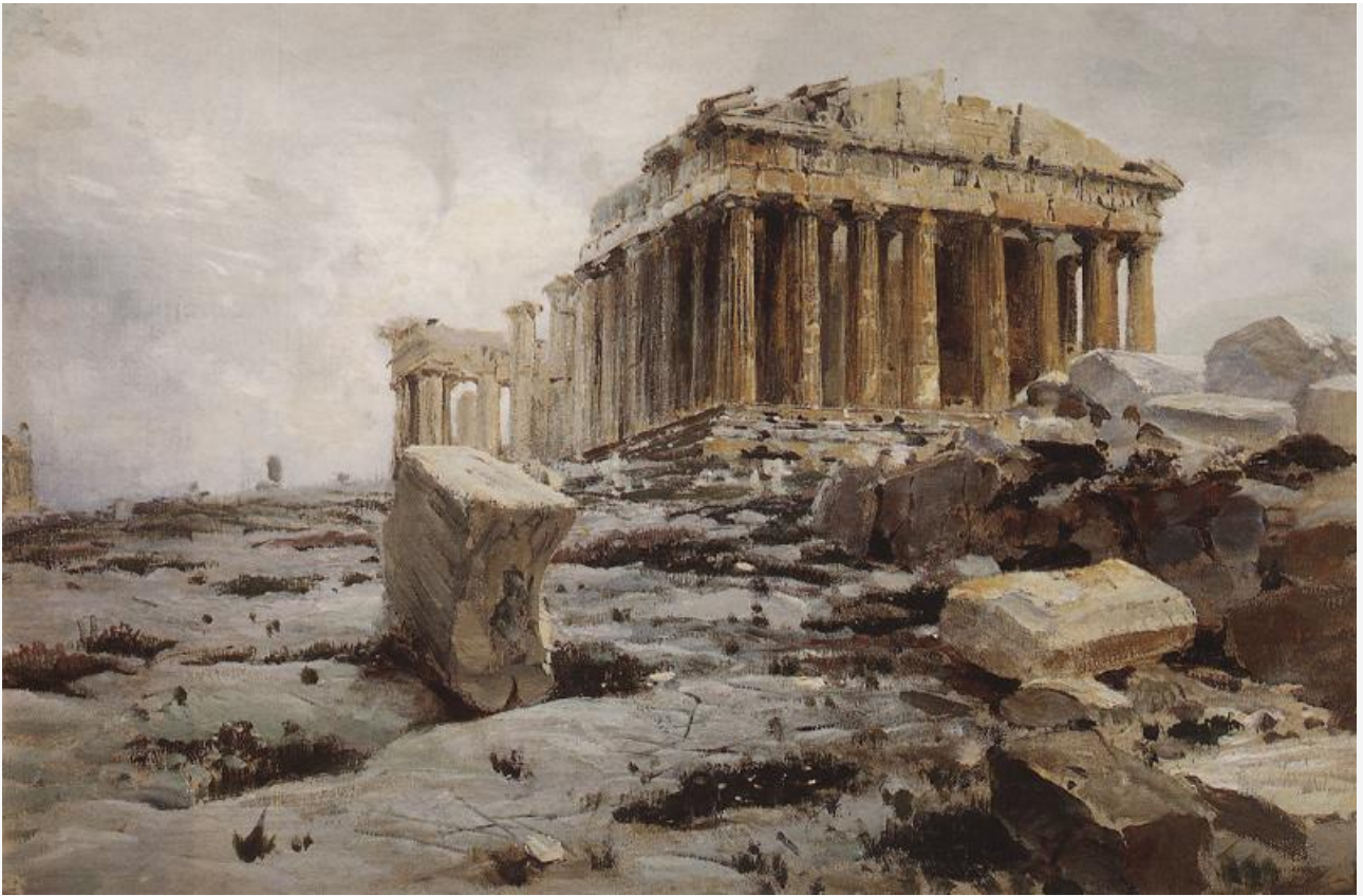
Парфенон. Храм Афины-Парфенос, 1881-1882. Хранится в Третьяковской галерее