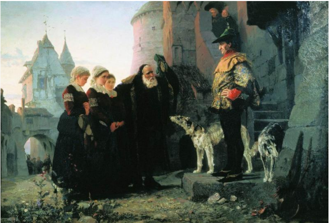
Право господина, 1874. Хранится в Третьяковской галерее