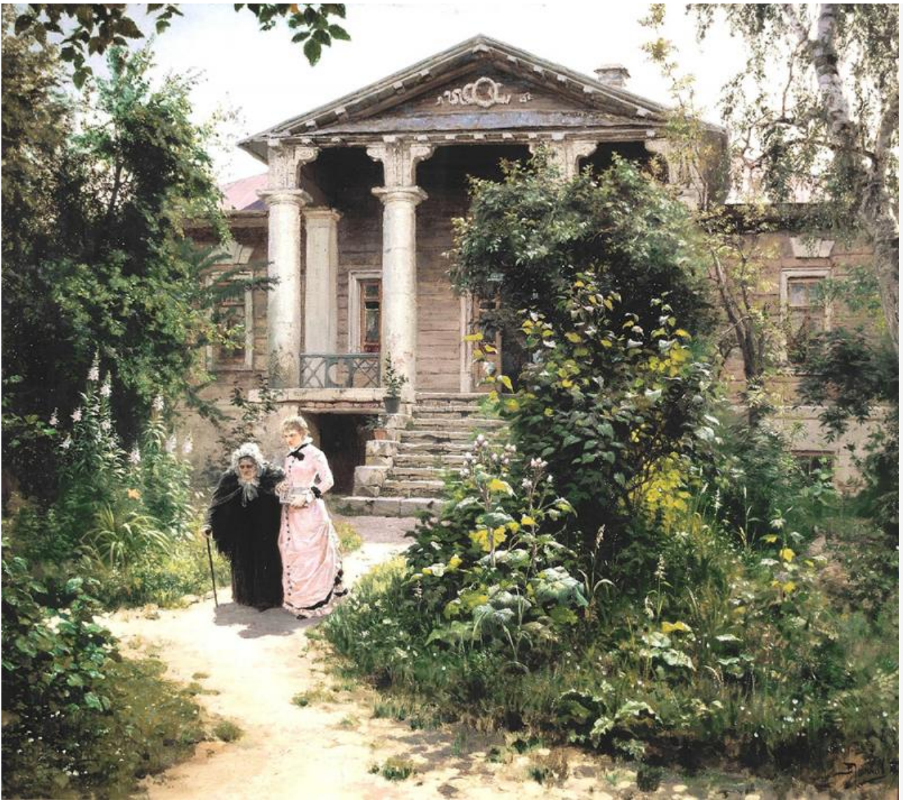
Бабушкин сад, 1878. Хранится в Третьяковской галерее