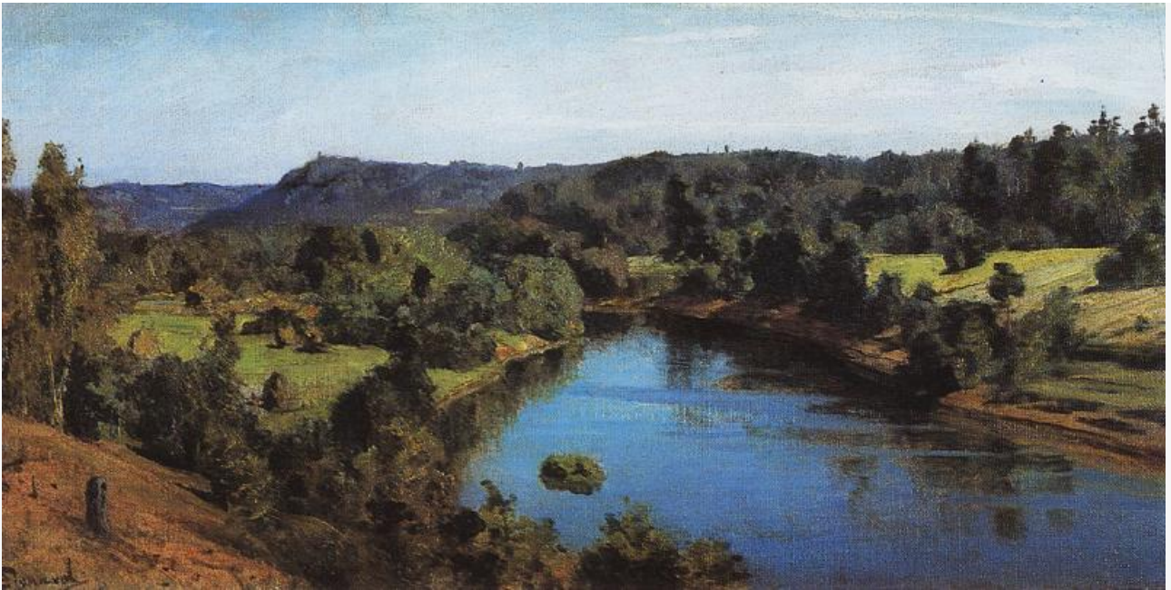
Река Оять, 1915. Хранится в Музее- заповеднике «Поленово»