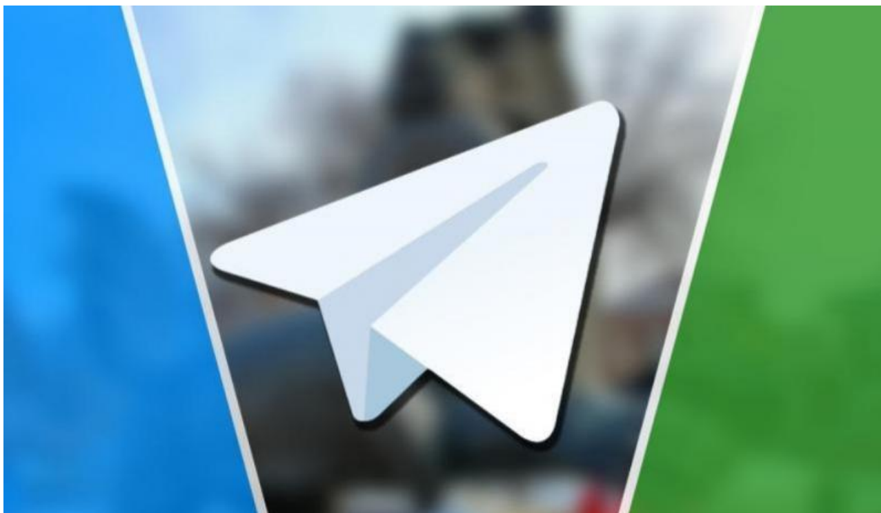
Фото: t.me/stepanovnm , primamedia.ru

Автор: Глеб Севостьянов © Babr24.com ПОЛИТИКА, ЭКОНОМИКА И БИЗНЕС, ИРКУТСК 👁 26992 27.05.2024, 05:05 🔄 283