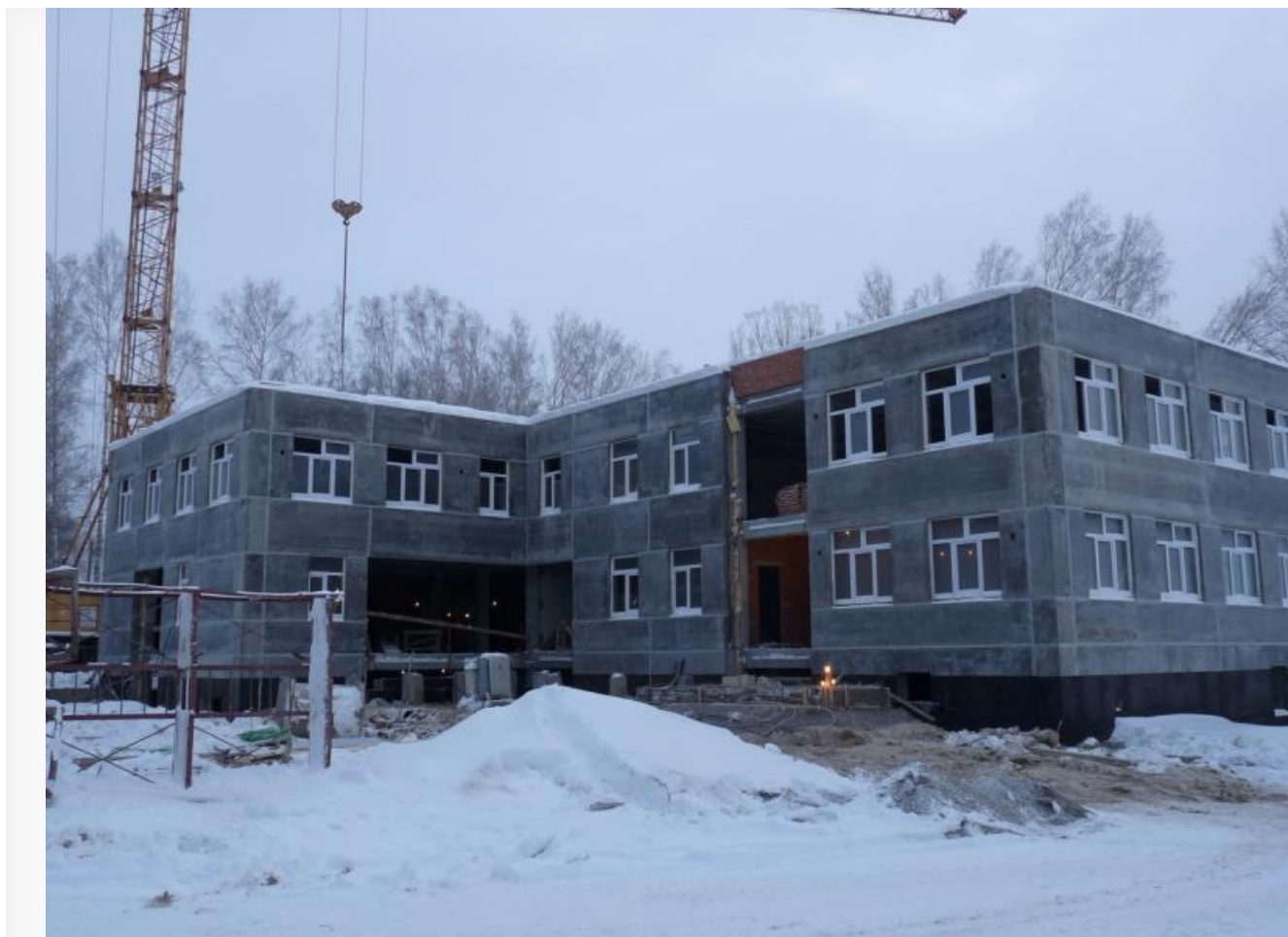
Детский сад в Мельниково

Чуть позже выяснилось, что организация завысила цену детсада на 700 тысяч рублей , против неё возбудили уголовное дело по части третьей статьи 159 УК РФ (мошенничество). Чем закончилась эта история, неизвестно.