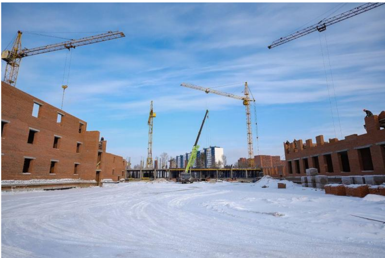
Школа на Высоцкого

Корпус довели до ума только во второй половине ноября 2023 года.