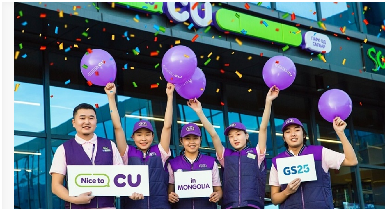
Корейский магазин CU имеет 370 филиалов в Монголии

Во многом росту интереса помог и бренд GoMongolia , который в Корее активно продвигается под девизом «Всегда в движении». Цель этой инициативы — привлечь иностранный туризм и киноиндустрию в Монголию.