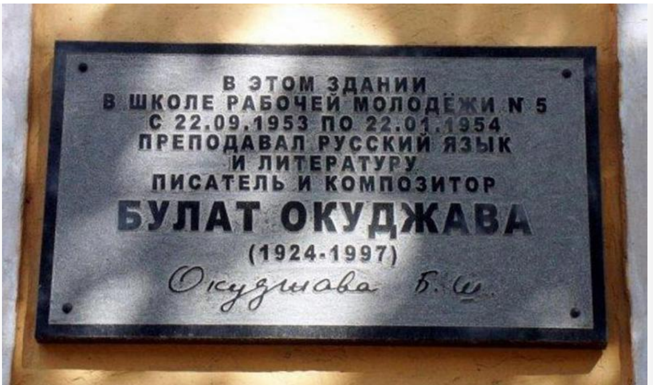
Мемориальная доска Булату Окуджаве на здании школы № 14 в Калуге

Первый официальный вечер авторской песни Булата Окуджавы состоялся в Харькове в 1961 году. В том же году в альманахе «Тарусские страницы» была опубликована его автобиографическая повесть «Будь здоров, школяр». Спустя год поэт и прозаик стал членом Союза писателей СССР.