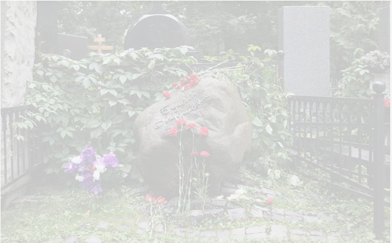
Могила Булата Окуджавы на Ваганьковском кладбище

Церемония прощания прошла 18 июня в Театре имени Евгения Вахтангова на родном для Окуджавы Арбате. Похоронили легендарного автора и исполнителя на Ваганьковском кладбище Москвы.