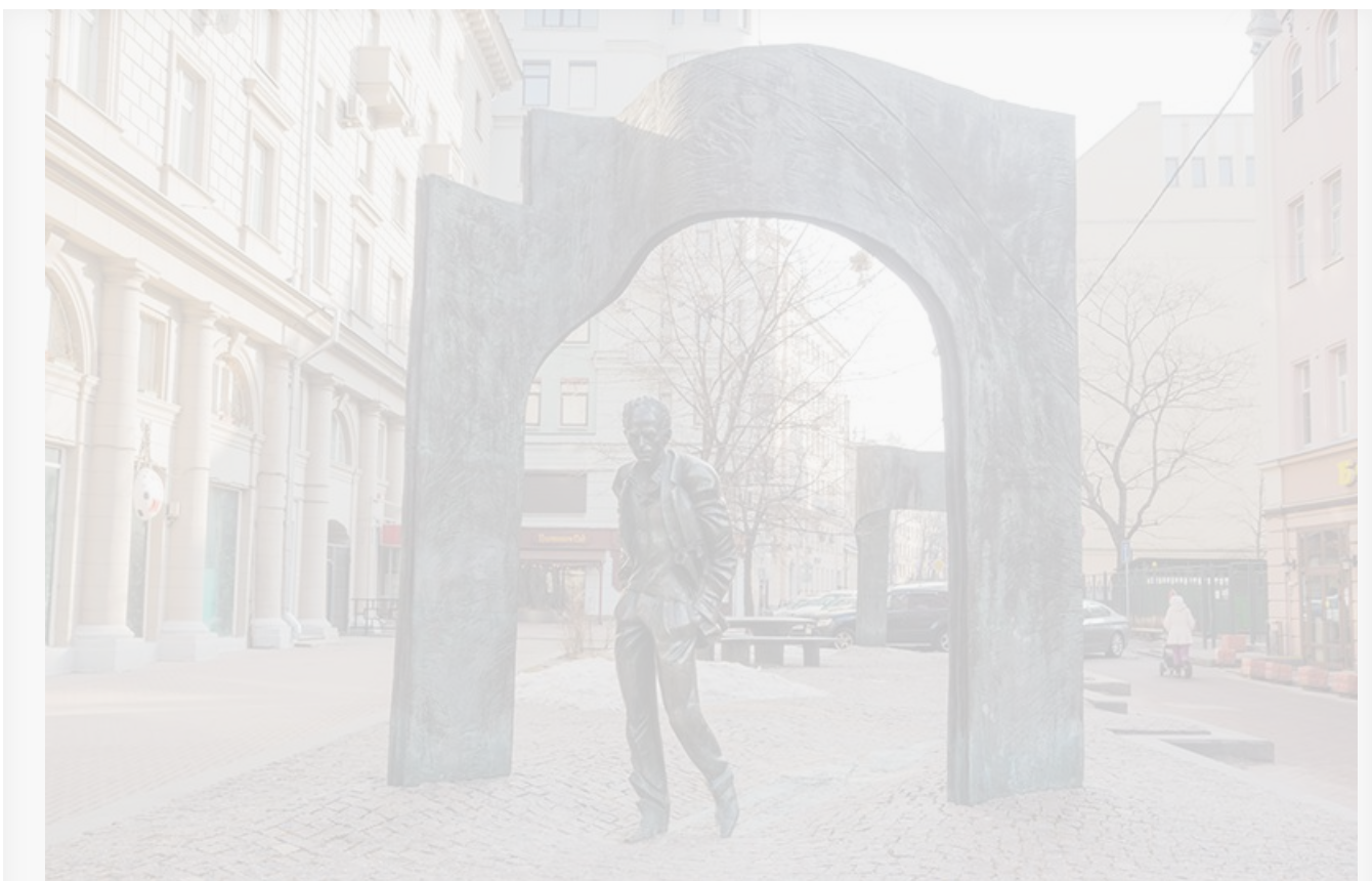
Памятник Булату Оуджаве на Старом Арбате в Москве

Ваше благородие, госпожа Удача, Для кого ты добрая, а кому иначе. Девять граммов в сердце постой, не зови... Не везёт мне в смерти, повезёт в любви!