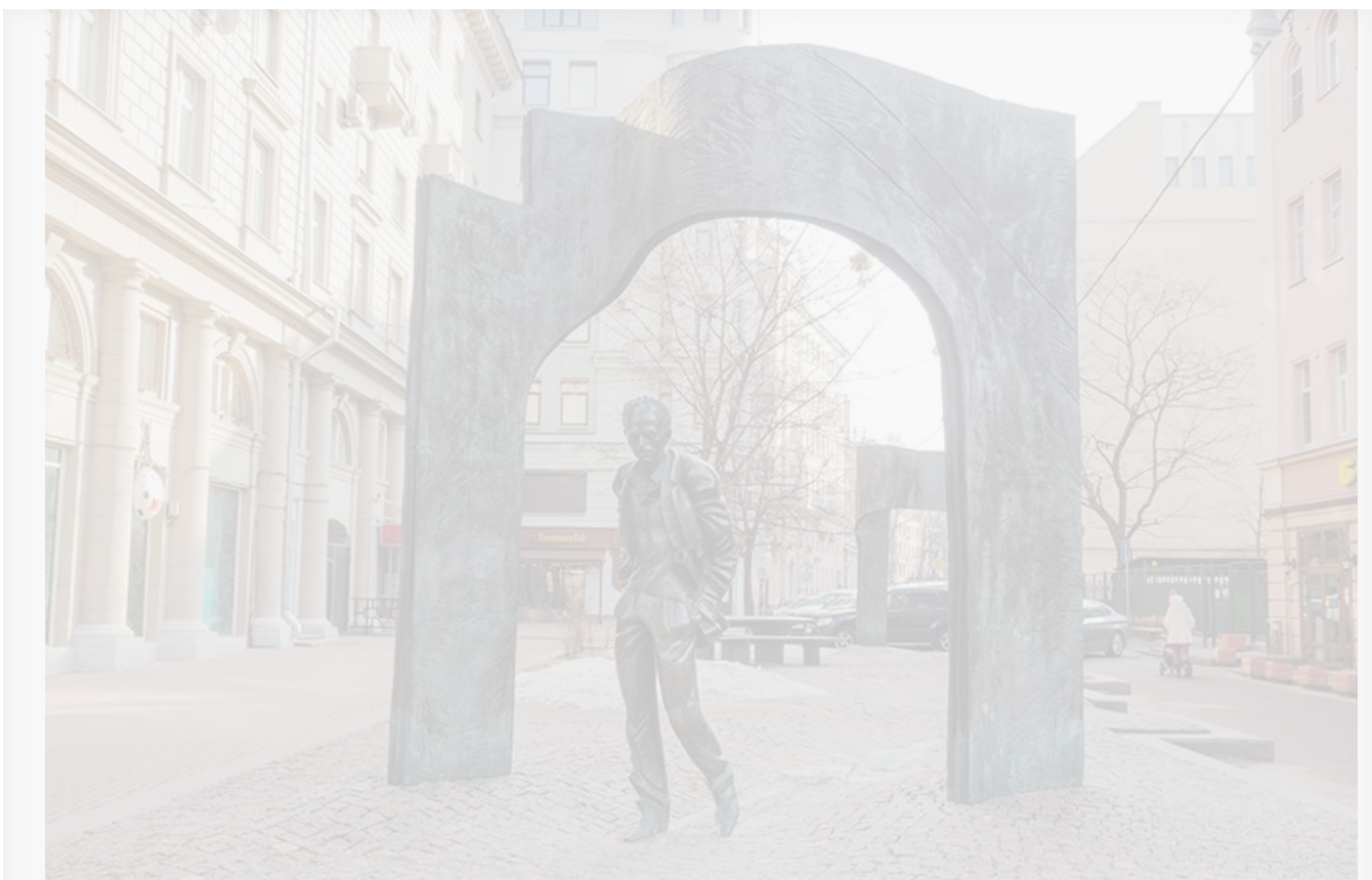
Памятник Булату Окуджаве на Старом Арбате в Москве

Ваше благородие, госпожа Удача, Для кого ты добрая, а кому иначе. Девять граммов в сердце постой, не зови... Не везёт мне в смерти, повезёт в любви!