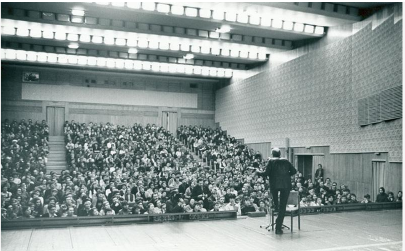
Концерт Булата Окуджавы в Туле, 1984

В 1991 году за сборник стихотворений «Посвящается Вам» Булат Окуджавы был удостоен Государственной премии СССР. В 1994-м за роман «Упразднённый театр» он получил премию «Русский Букер».