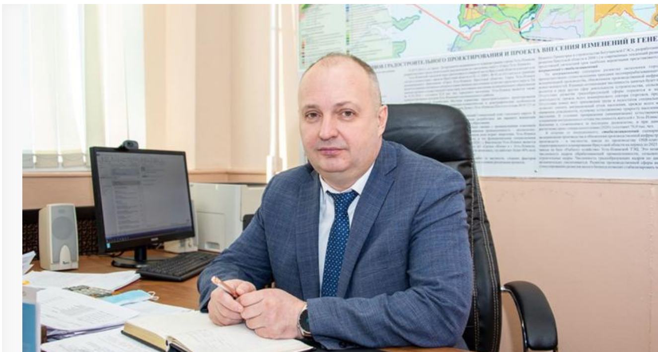
Эдуард Симонов, заммэра Усть-Илимска

Но раком стал многострадальный Эдуард Симонов – слабое и безвольное решение в слабом и далеком Усть-Илимске. И это – второй пример кадрового бессилия Едра .