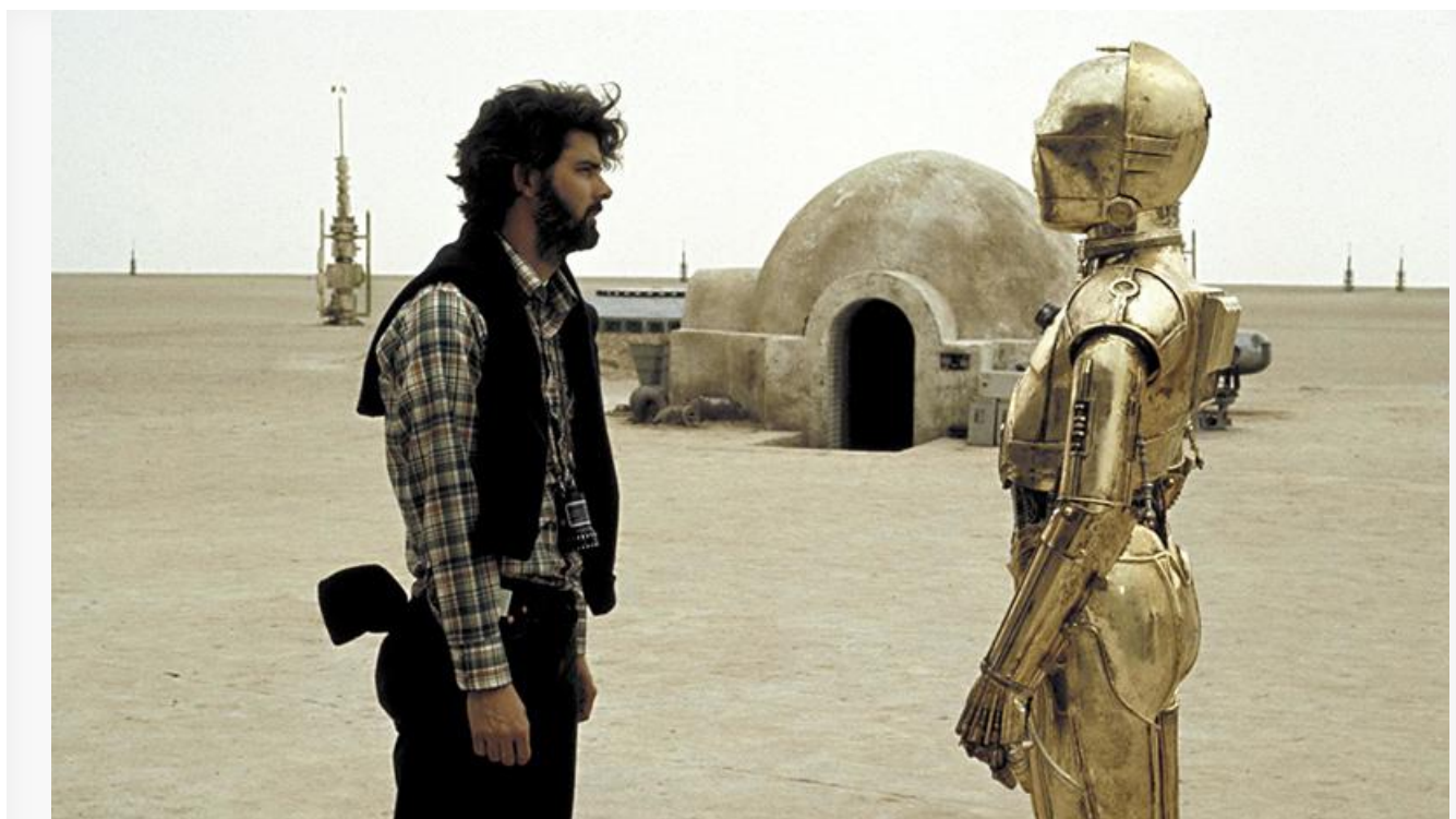
Джордж Лукас на съёмках фильма «Звёздные войны. Эпизод IV: Новая надежда», 1977 год

В качестве режиссёра снял ещё пять фильмов: «Американские граффити», «Звёздные войны. Эпизод IV: Новая надежда», «Звёздные войны. Эпизод I: Скрытая угроза», «Звёздные войны. Эпизод II: Атака клонов» и «Звёздные войны. Эпизод III: Месть ситхов». Во многих культовых проектах выступал в роли автора сюжета, сценариста, продюсера, сорежиссёра, оператора, монтажёра.