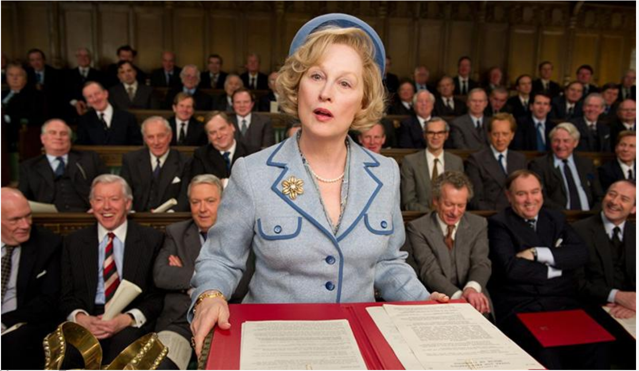
Маргарет Тэтчер в фильме «Железная леди», 2011 год