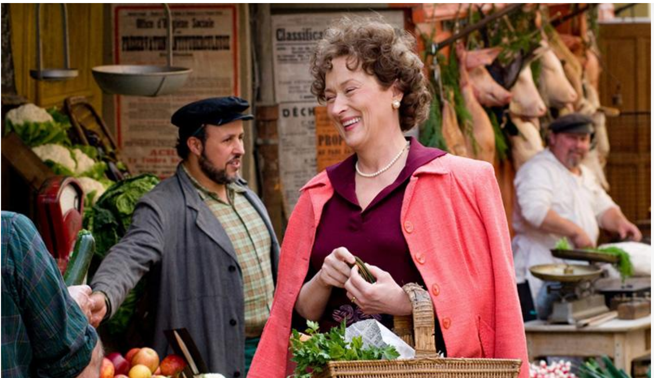
Джулия Чайлд в фильме «Джули и Джулия», 2009 год

Почётная «Золотая пальмовая ветвь» добавится в коллекции актрисы к Серебряной премии за лучшую женскую роль Каннского кинофестиваля, полученной в 1989 году за роль Линди Чемберлен в драме Фреда Скеписи «Крик в темноте», Серебряному медведю за лучшую женскую роль Берлинского кинофестиваля за роль Кларисс Вон в психологической драме Стивена Долдри «Часы», Премии имени Станиславского «Верю!» Московского международного кинофестиваля, премии Doinostia за выдающиеся достижения Сан-Себастьянского кинофестиваля, почётной премии «Сезар», трём «Оскарам», девяти «Золотым глобусам», премиям BAFTA, «Эмми», «Спутник», «Давид ди Донателло» и многим другим.