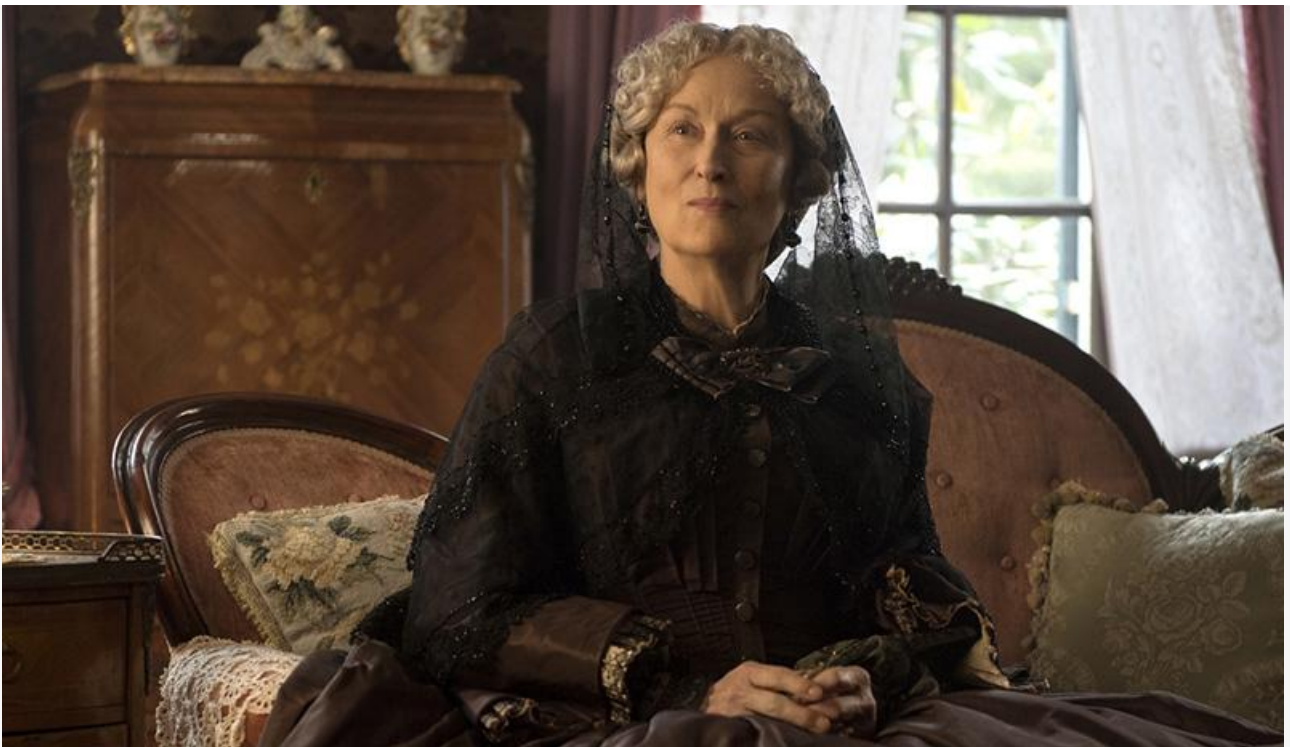
Тётушка Марч в фильме «Маленькие женщины», 2019 год

В день закрытия фестиваля ещё одна почётная «Золотая пальмовая ветвь» найдёт своего обладателя в лице американского продюсера, сценариста и режиссёра, создателя «Звёздных войн» и «Индианы Джонса» Джорджа Лукаса, который в день открытия кинофорума в Каннах отметит 80-летие.