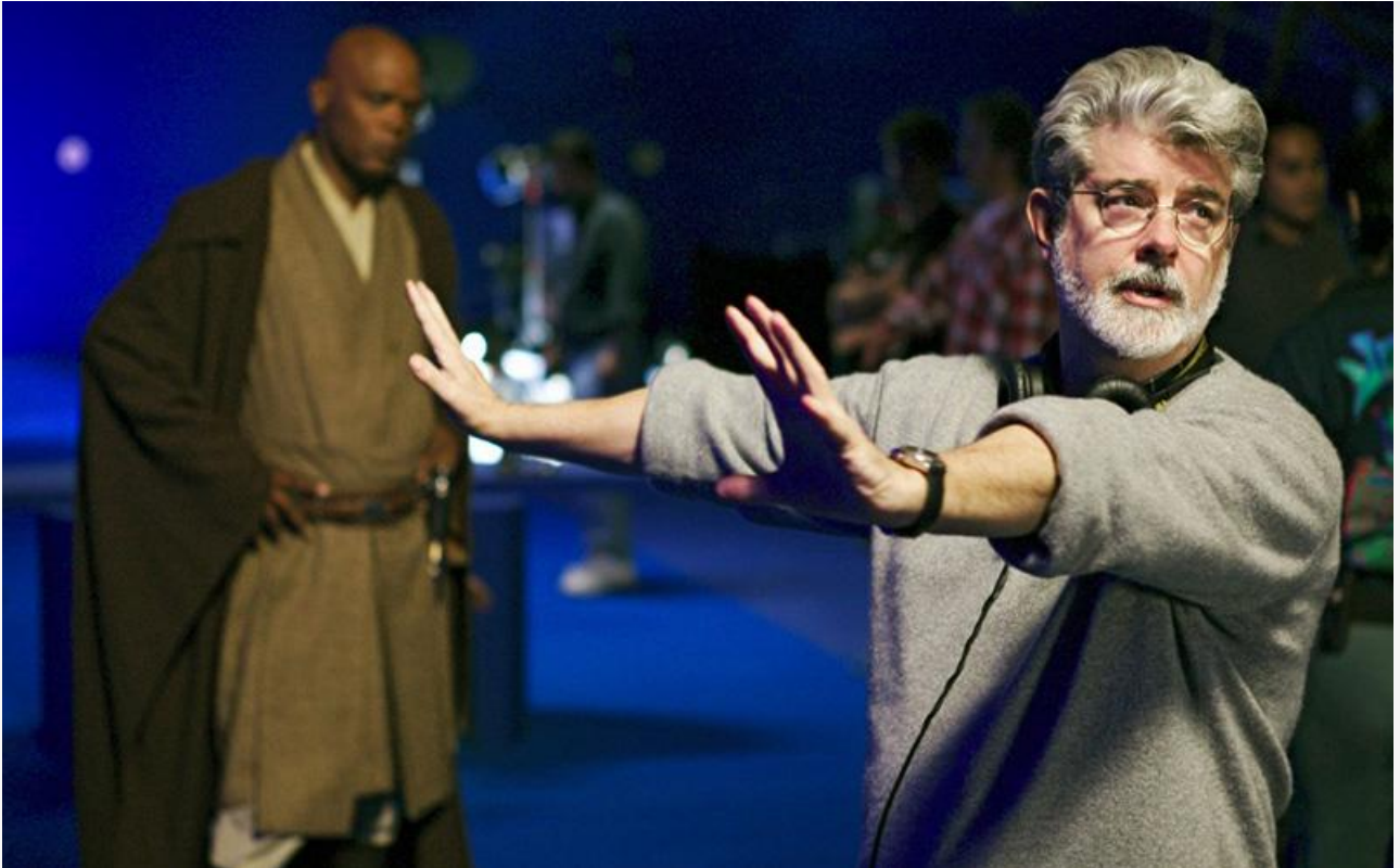
Джордж Лукас на съёмках фильма «Звёздные войны. Эпизод III: Месть ситхов», 2005 год