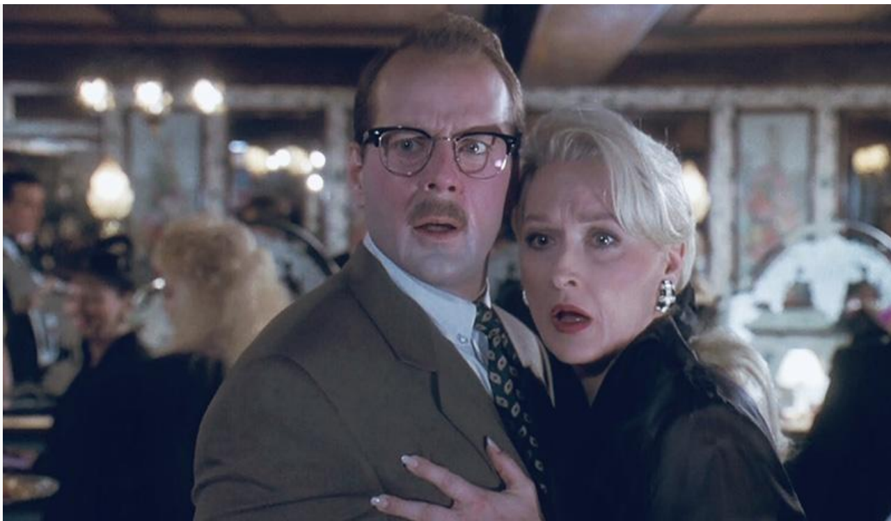
Мэдлин Эштон в фильме «Смерть ей к лицу», 1992 год