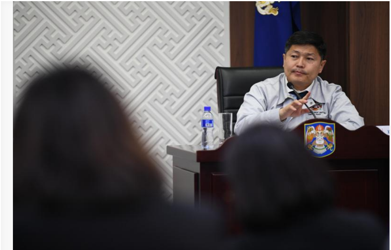
Мэр Улан-Батора Нямбаатар

Потребление энергии в Улан-Баторе выросло на 11,3% по сравнению со средним показателем 2023 года, и ожидается, что потребление будет быстро расти в будущем. В рамках политики по увеличению источников энергии в четвертом квартале 2024 года будет введен в эксплуатацию первый блок этой электростанции. Для проекта «Бөөрөлжүүтийн» потребуются общие инвестиции в размере 555,3 миллиона долларов США , в настоящее время инвестировано 393,5 миллиона долларов .