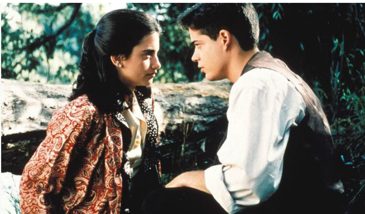
Лус в фильме «Изящная эпоха», 1992 год

Затем были съёмки ещё в двух десятках испанских, итальянских и французских фильмов, из которых достойны упоминания комедийная мелодрама Мануэля Перейры «Опасности любви», драма Альваро Армеро