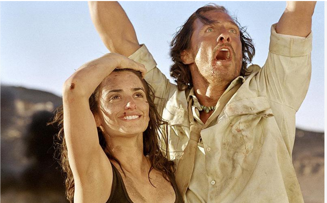
Эва Рохас в фильме «Сахара», 2005 год