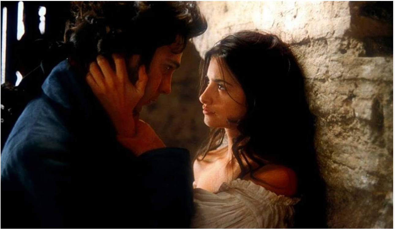
Пепита Туди в фильме «Обнажённая маха», 1999 год

И всё же главный успех Пенелопы Крус на старте карьеры был связан с Голливудом. Всемирная известность пришла к ней после съёмок в фильмах «Неукротимые сердца» Билли Торнтон с Мэттом Дэймоном, «Кокаин» Теда Демме с Джонни Деппом и «Ванильное небо» Кэмерона Кроу с Томом Крузом.