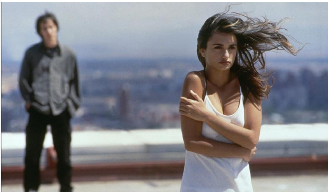
София в фильме «Открой глаза», 1997 год

В 1999 году за главную роль в драме Фернандо Труэбы «Девушка твоей мечты» Пенелопа Крус была удостоена первой в карьере премии «Гойя» и номинирована на премию Европейской киноакадемии в категории «Лучшая женская роль».