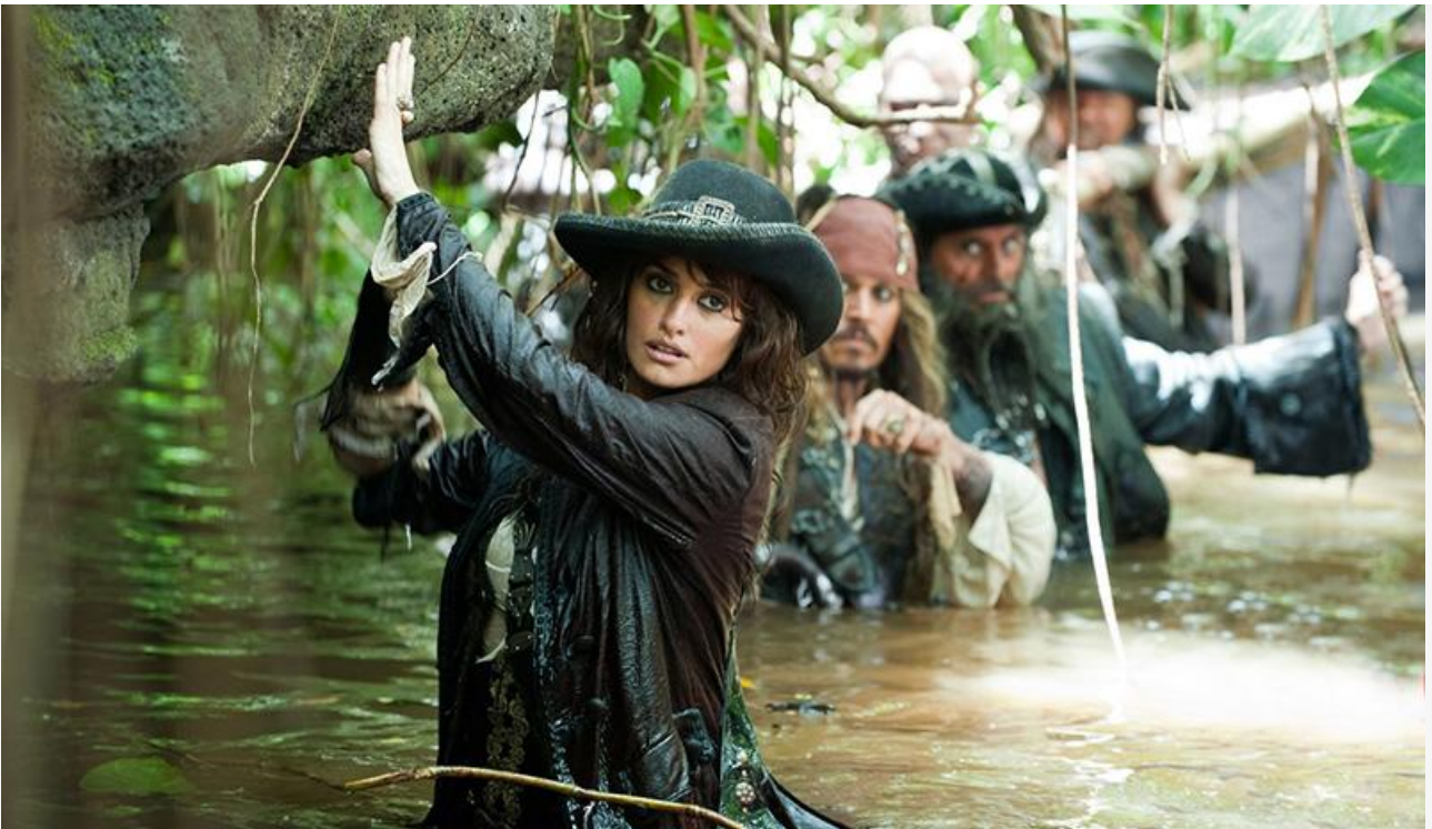
Анжелика в фильме «Пираты Карибского моря: На странных берегах», 2011 год