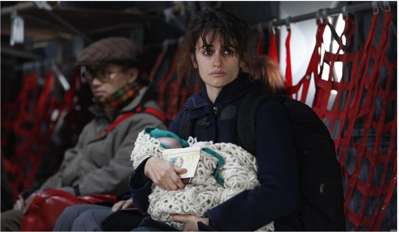
Джемма в фильме «Рождённый дважды», 2012 год