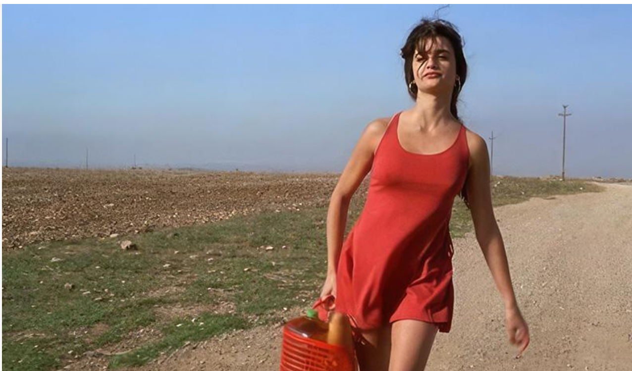
Сильвия в фильме «Ветчина, ветчина». Первая роль в кино, 1992 год

Первая же работа в кино принесла Пенелопе Крус номинацию на Национальную кинопремию Испании «Гойя» в категории «Лучшая женская роль».