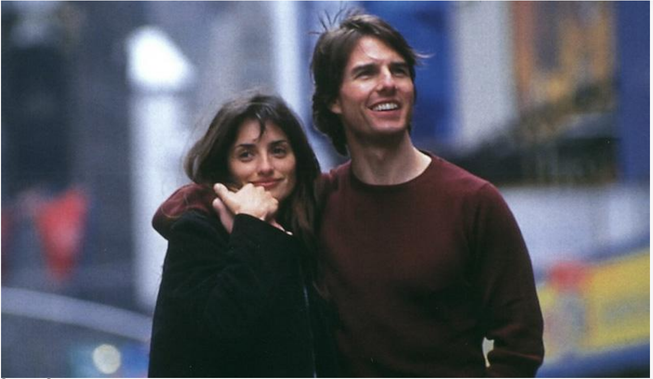
София Серрано в фильме «Ванильное небо», 2001 год