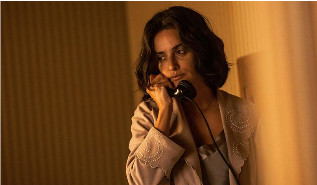
Лаура в фильме «Феррари», 2023 год