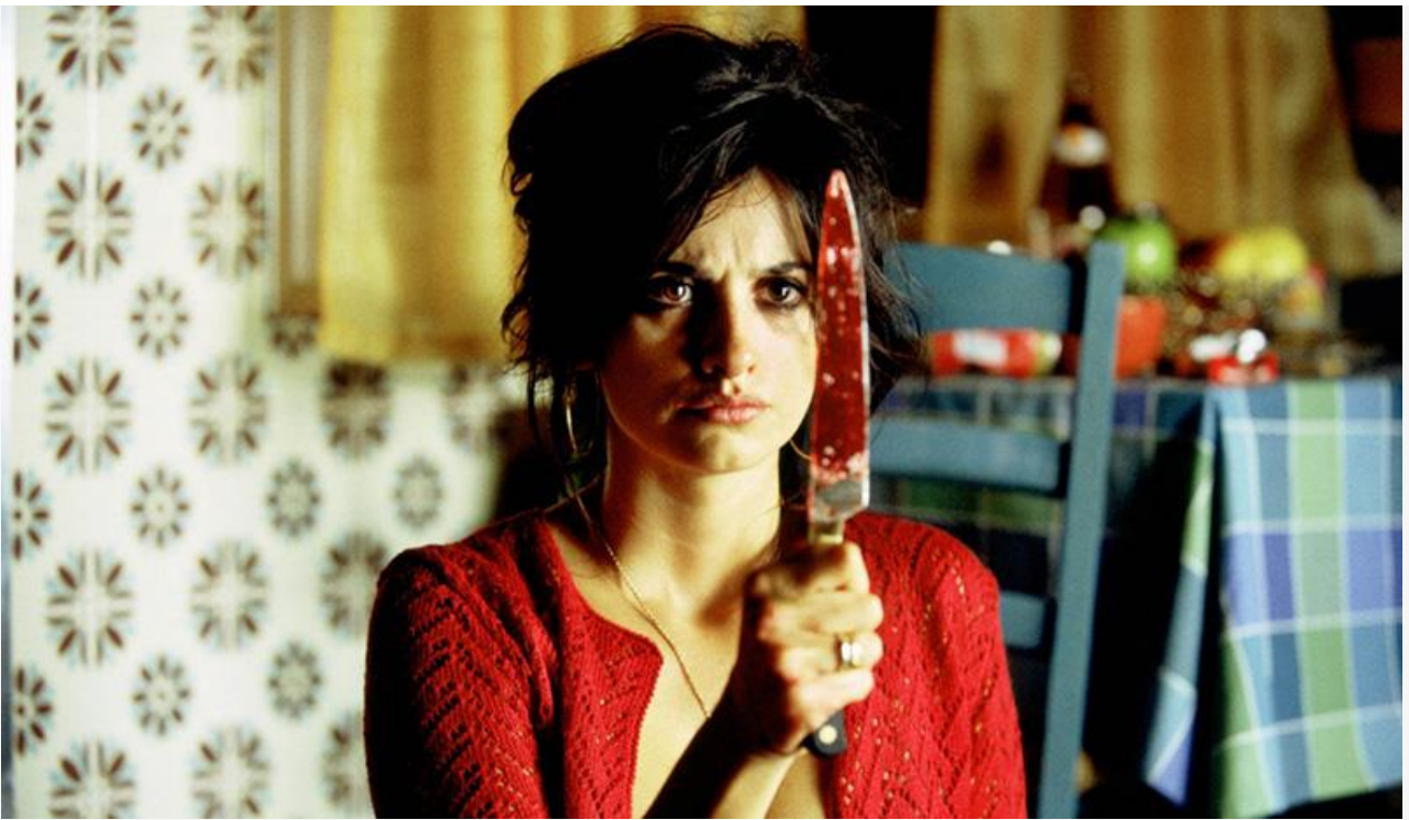
Раймунда в фильме «Возвращение», 2006 год

«Оскар» и ВАФТА покорились спустя два года: Пенелопа Крус стала лауреатом престижных премий в категории «Лучшая женская роль второго плана» за создание образа бывшей супруги главного героя Марии Елены в мелодраме Вуди Аллена «Вики Кристина Барселона».