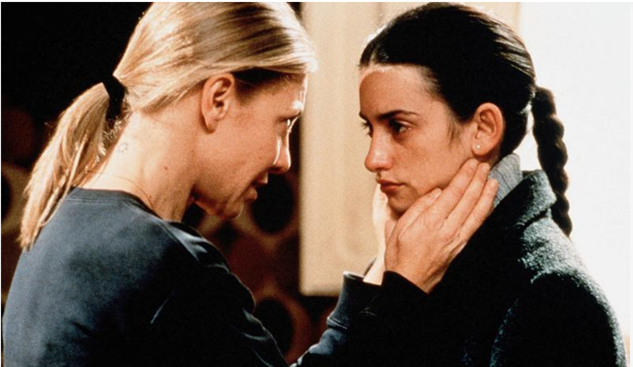
Сестра Мария Роза в фильме «Всё о моей матери», 1999 год