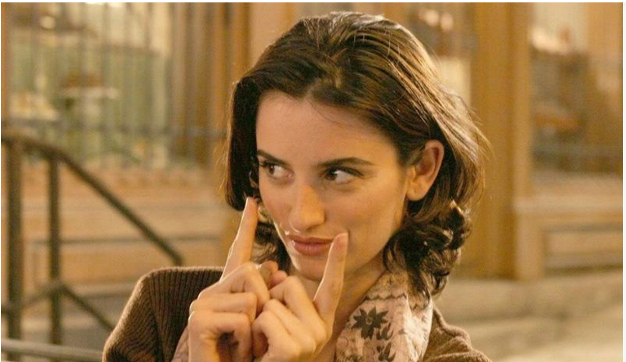
Мия в фильме «Голова в облаках», 2003 год