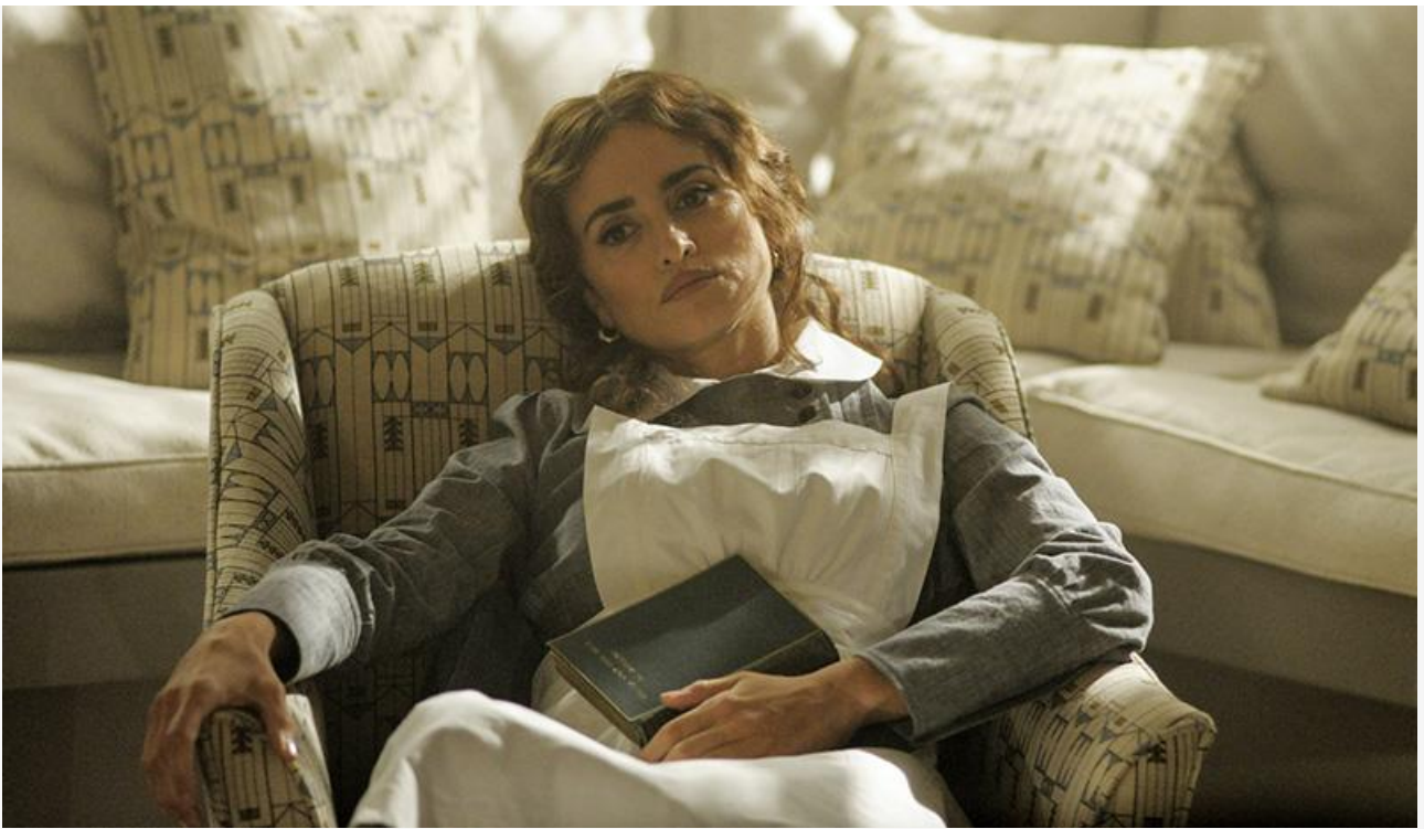
Пилар Эстравадос в фильме «Убийство в „Восточном экспрессе“», 2017 год