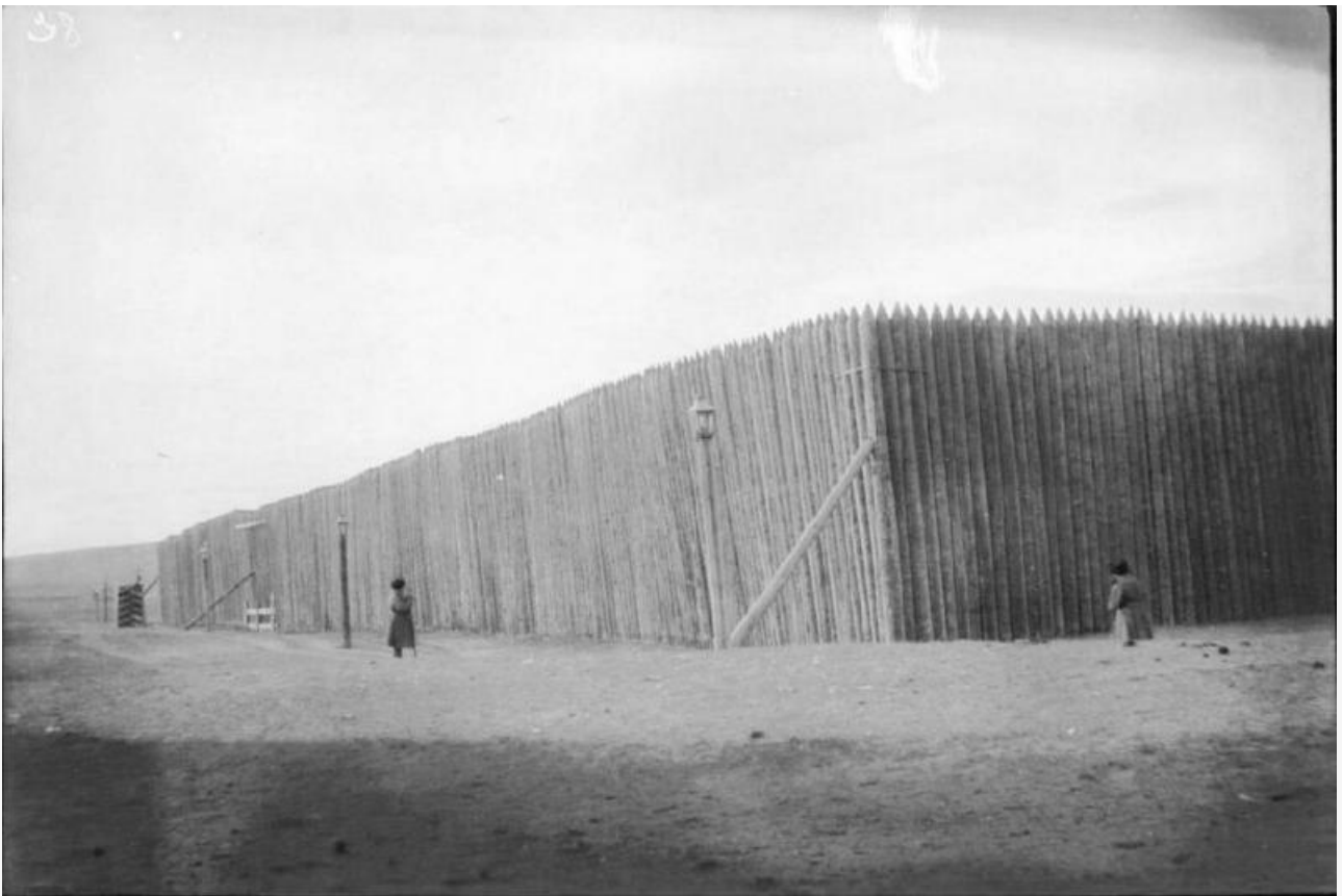
Так выглядел частокол вокруг тюрьмы.

Автор: Александр Мур © Babr24.com НАУКА И ТЕХНОЛОГИИ, КРАСНОЯРСК 👁 7385 25.04.2024, 16:25 👤 209