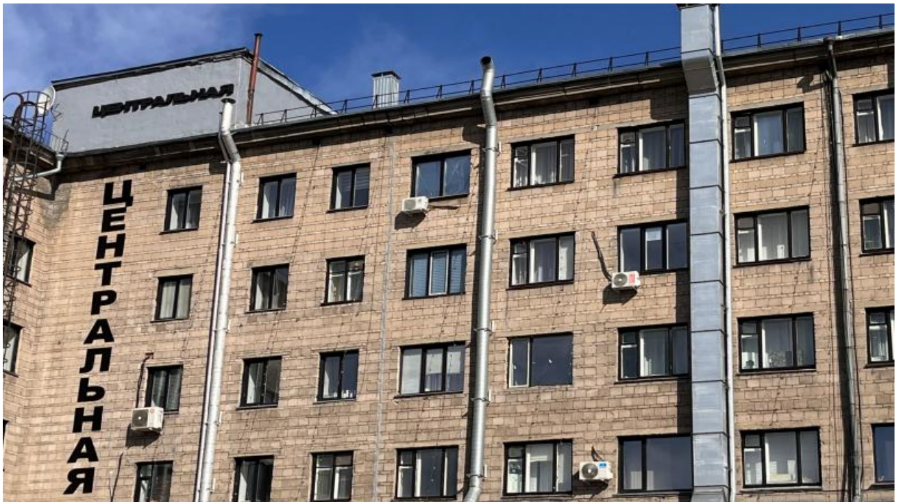
Фото: hotel-1.ru , Бабр

Автор: Лев Блиссов © Babr24.com ЖКХ, ТУРИЗМ, РАССЛЕДОВАНИЯ, НОВОСИБИРСК 👁 20715 25.04.2024, 13:11 📄 237