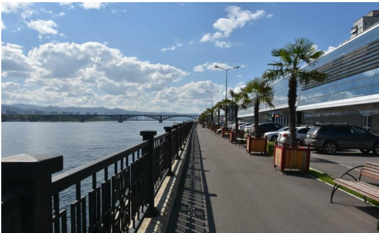
Фото: prmira.ru , axinet.ru , newslab.ru , vk.com

Автор: Валерий Лужный © Babr24.com ЖКХ, ЭКОЛОГИЯ, ЭКОНОМИКА И БИЗНЕС, КРАСНОЯРСК 👁 21007 19.04.2024, 20:49 📄 225