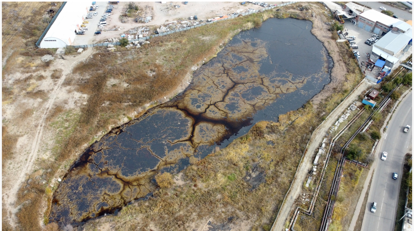
Автор: Аксель Дронов Фото из альбома "Улан-Удэ. Фенольное озеро" © Фотобанк "RuBabr"

На протяжении трех десятилетий фенольное озеро в центре Улан-Удэ стало настоящей экологической бомбой, которая угрожает здоровью местных жителей и серьезно вредит природной среде. В юбилейный для отстойника год опасные отходы собираются, наконец, утилизировать. Ликвидацией займется госкорпорация «Росатом», славящаяся своей любовью к отмыванию денег.