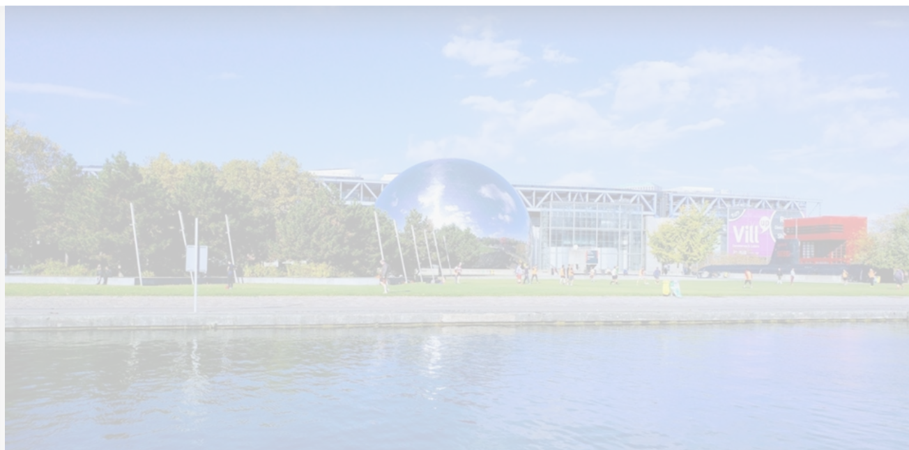
Парижский парк Ла-Виллет – будущее место расположения проекта «Монгол хаус»

Для популяризации этого направления с 27 июля по 11 августа в парижском парке Ла-Виллет будет открыт « Монгол хаус ». Проект представляет собой комплекс сооружений, цель которых – популяризация монгольской культуры на международном уровне. Например, посетителям расскажут о быте и традициях кочевников, а также предложат национальную кухню и развлечения.