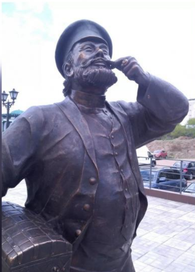
Купец, бывший хозяин амбара, в гробу переворачивается