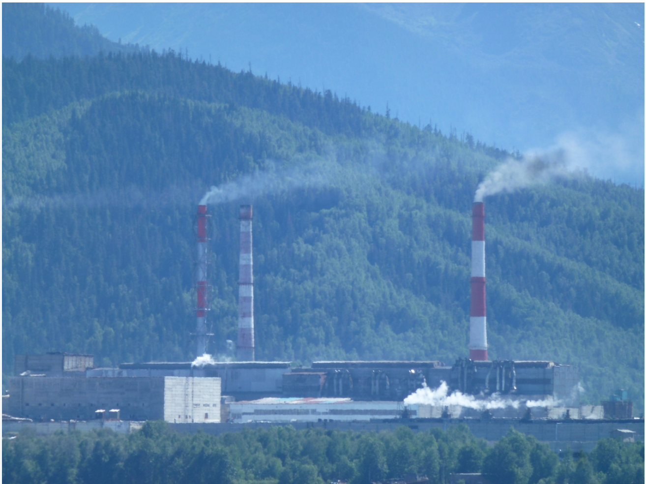
Автор: Даниил Тетерин Фото из альбома "Иркутская область. Байкальск. БЦБК" © Фотобанк "RuBabr"

БЦБК начал свою деятельность в 1966 году, а закончил в 2013 году. На территории бывшего комбината существуют карт-накопители, на которых находятся около 6,5 миллиона тонн отходов, включая шлам-лигнин, отходы от сжигания угля, кору, золу и другие.