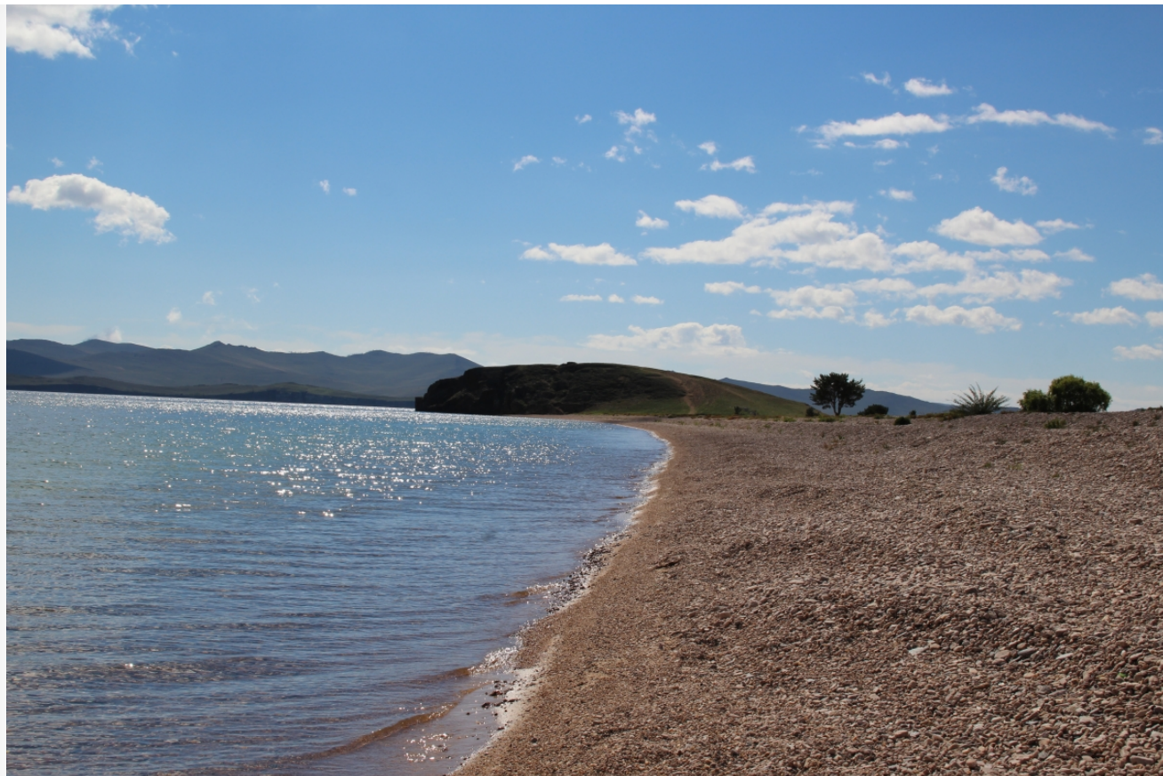
Автор: Даниил Тетерин Фото из альбома "Малое море. Виды. Лето" © Фотобанк "RuBabr"

На Байкальской природной территории на данный момент отсутствуют очистные сооружения, соответствующие экологическим требованиям . Введение запрета на сброс неочищенных сточных вод в Байкал имеет огромное значение для сохранения чистоты и уникальности озера. Установленный срок исполнения данного поручения — до 1 сентября 2024 года .