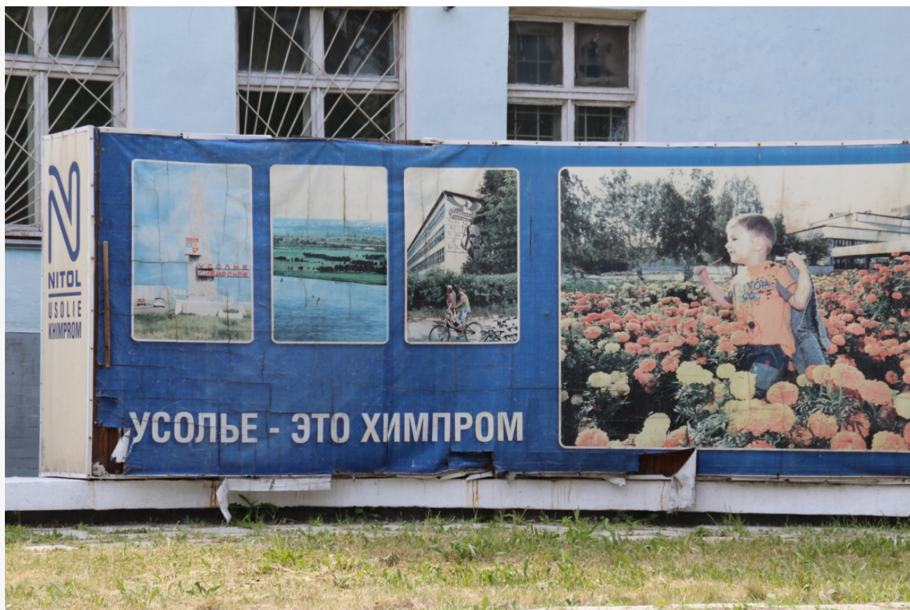
Автор: Даниил Тетерин Фото из альбома "Иркутская область. Усольский Химпром" © Фотобанк "RuBabr"

Усольехимпром — крупнейшее химическое предприятие за Уралом, с 1936 года занимало большую площадь. В 2012 году большинство его цехов были остановлены, а в 2017 году компания обанкротилась. Несмотря на закрытие предприятия, проблемы остались, включая утечку ртути на территории ртутного цеха. Президент России Владимир Путин велел ликвидировать эти проблемы еще в июле 2020 года.